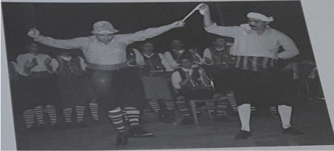
Tablo 1: Sirto Oyunundan Bir Görüntü

Kuzey Kıbrıs genelinde en çok oynanan ve sevilen oyun türü olan sirtolar genelde solo nitelikte oynanan bir oyun türüdür. "sirto" sözcüğü her ne kadar yabancı kökenli bir sözcük olsa da ezgisel ve müzikal olarak ritim kalıplarında Türk motifleri açıkça görülmektedir. Yörede oynanan en yaygın oyunlardan bir tanesi olan aziziye sirtosu 19. Yüzyılda Osmanlı döneminde sultan Abdülaziz tarafından bestelenmiştir. Rum halkında da etkileşim sağlayıp azizies sirtos ismiyle çalır oynamışlardır. Sirtolar Anadolu'nun hora bölgesinde kasap havasının ikinci kısmı olarak oynanmaktadır. İlginç olan Kuzey Kıbrıs bölgesinde sadece ikinci kısmının yani sirtoların oynanmasıdır. Kaynak araştırmalarında edinilen bilgilere göre kaynak kişilerin eski zamanlarda kasap havası kısmının da üçlü, beşli gruplar halinde oynandığının görüldüğünü söylemişlerdir. Cemil Demirsipahi "Türk Halk Oyunları" isimli kitabında sirtoların kasap oyunları ile arasından ki bağlantıdan şöyle bahsetmiştir: