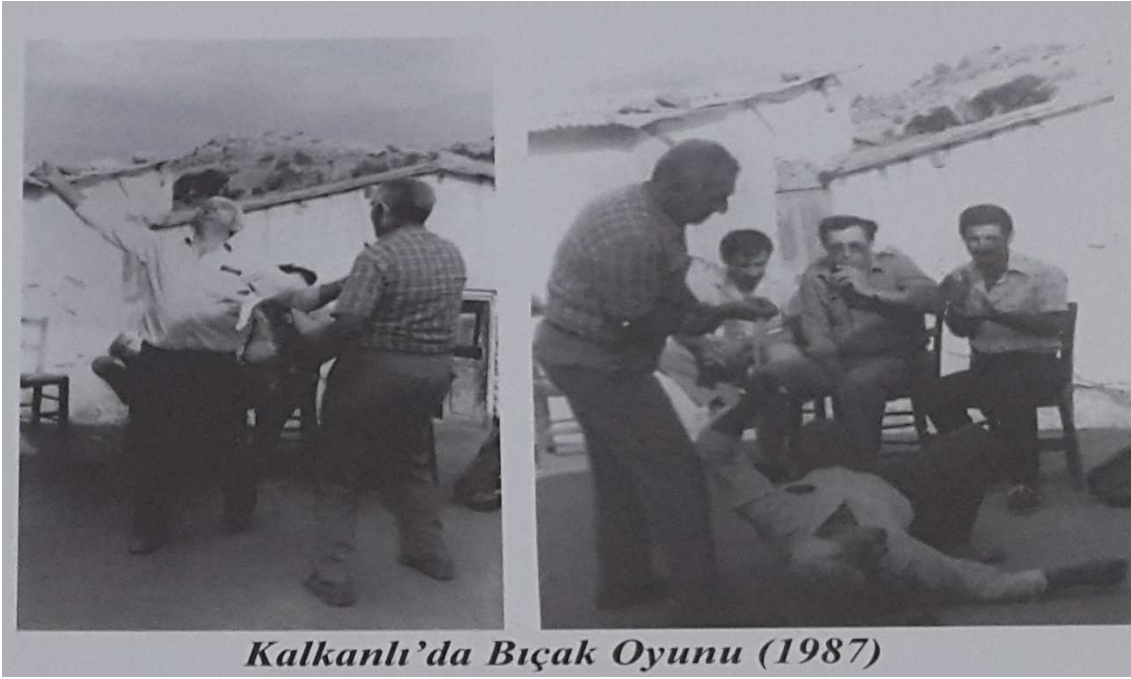
Kalkanlı'da Bıçak Oyunu (1987)

b) Orak oyunu: Teknolojinin daha insan hayatının her alanına girmediği zamanlarda insanlar işlerini kendi imkânlarıyla yapmak zorundalardı. Hasat zamanı gündelik olarak çalışan işçiler hasadın sonuna doğru çeşitli eğlenceler ve oyunlar oynanır. Bunlardan biri olan hasat işleminde kullanılan adını da buradan alan orak oyunu topluluk olarak oynanmayan tek başına bağımsız oynanan bir oyundur. Oynayacak kişi kendi yeteneklerine göre çeşitli döndürme havaya fırlatıp tekrar yakalama gibi yetenek isteyen figürleri sergiler. Teknolojinin gelişmesi ile birlikte oyun o günleri anlatan taklidi bir hale gelip düğünlerde oyunu oynayacak kişinin ortaya çıkması ile birlikte seyircilerden birinin oynayan kişiye bir buğday demeti atıp hasat etmesi şeklinde de oynanır. Orakların demir ve tahtadan olan sap kısmının dengeli olması çok önemlidir eğer dengeli değil ise titizlikle tahta olan sap kısmı delinip erimiş kurşun dökülür. Orağın sap kısmına deriden yapılan püsküller eklenip süslenmektedir ya da genç erkeklerin daha çok kızları cezbetmek için sap kısmının dibine ayna yapıştırılan çeşitleri de vardır. Püskül kısmına zil takıp hasat ederken ses çıkarması Kıbrıs'ta bulunan tehlikeli yılanlardan korunmak amaçlıda kullanılmıştır. Anadolu'nun Adıyaman bölgesinde mantık olarak aynı olan hasat işlemini yapan bir seyirlik oyun olup zaman zamanda halkdanslarında oyun sahnelerinde kullanılmıştır.