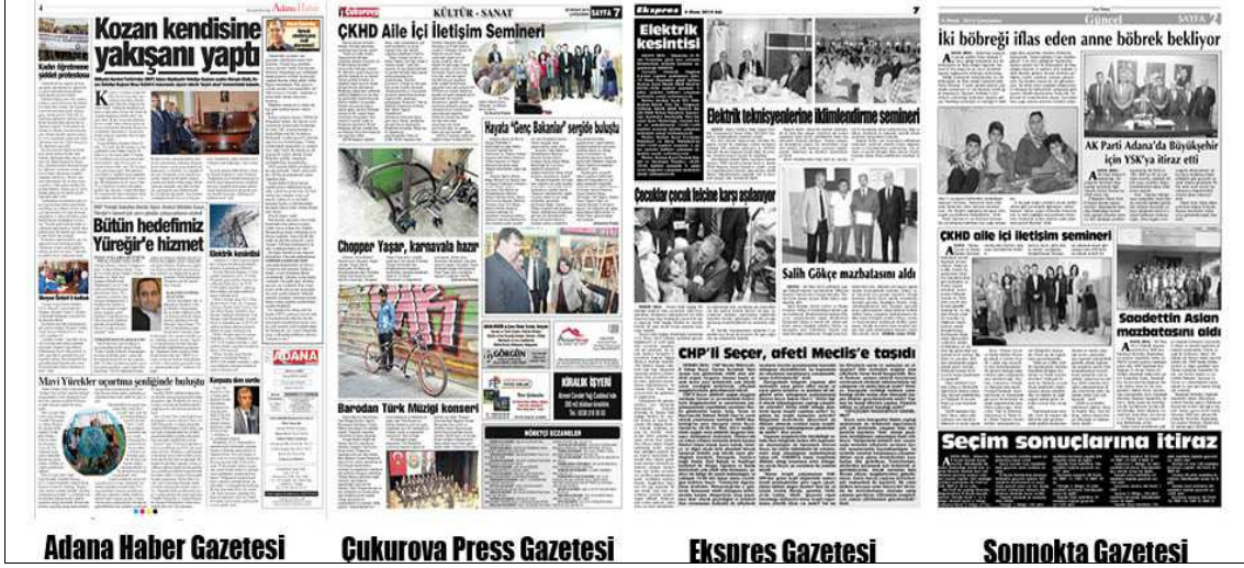
Şekil 13: Çizgi ve Çerçeve Kullanımı