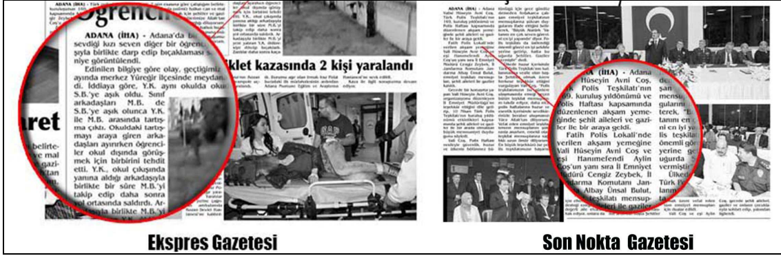
Şekil 3: Kelimeler Arası Espas (Boşluk) Hatası

Şekil 3'te Ekspres ve Sonnokta gazetesinde espas (boşluk) hatasının incelenen nüshalarında yer yer yapıldığı gözlemlenmiştir. Özellikle dar sütun seçimlerinde ve tasarımda kullanılan fotoğrafın veya herhangi bir görselin metin sütununu sıkıştırması sonucu harfler ve kelime aralarının bozulduğu tespit edilmiştir.