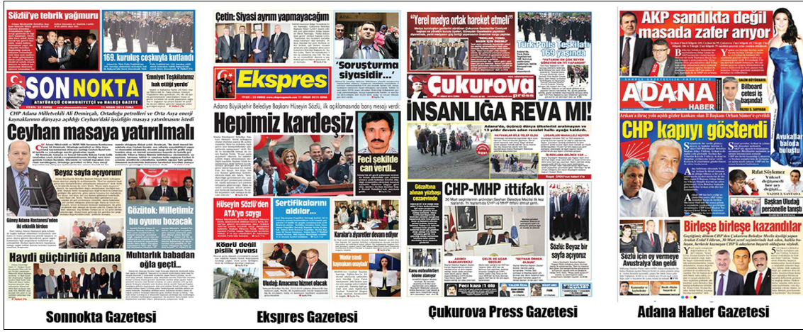
Kaynak: 11 Nisan 2014 (Sonnokta Gazetesi), 11 Nisan 2014 (Ekspres Gazetesi), 11 Nisan 2014 (Çukurova Press Gazetesi), 7 Nisan 2014 (Adana Haber Gazetesi)

Birinci sayfadan, iç sayfalara haberin anonslandığı sayfa düzenine vitrin sayfa düzeni denmektedir. Vitrin sayfa düzeninde haberler spot halinde sunulurken, ana sayfada çok fazla haber ve başlığa yer verilmektedir. Bu uygulamada amaç, iç sayfalarda aktarılan önemli haberleri okuyucuya birinci sayfadan duyurmaktır (Bıyık, 2007:188).