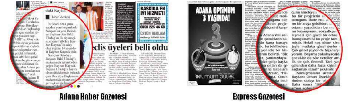
Adana Haber Gazetesi