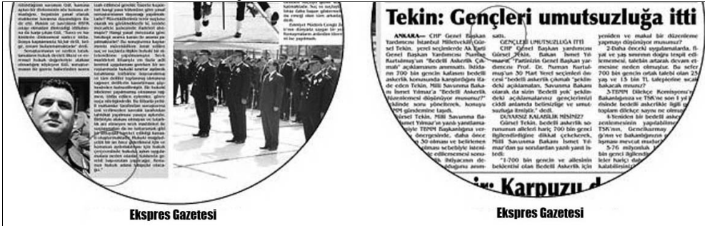
Şekil 5: Dul ve Yetim Sözcük Hatası

Tipografide dul ve yetim sözcük hatası okuma rahatlığı açısından sıkıntı yaratmaktadır. Şekil 4'te, 5'te ve 6'da örnekleri görüldüğü gibi bu çalışmada örneklemlenilen dört gazetenin tüm sayılarında bu tipografi hatasının sık sık yapıldığı gözlemlenmiştir. Özellikle köşe yazılarında ve dar sütunla dizilmiş haberlerde yetim ve dul sözcüğe daha çok rastlanmıştır.