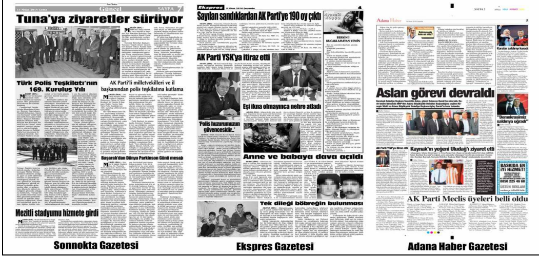
Kaynak: 11 Nisan 2014 (Sonnokta Gazetesi), 9 Nisan 2014 (Ekspres Gazetesi)

Tipografi açısından başlığı ele aldığımızda aynı sayfada birden fazla kalın başlık kullanımı doğru değildir. Kullanıldığında sayfada görsel karmaşa meydana gelmekte ve vurgulanmak istenen tam olarak anlaşılammaktadır.