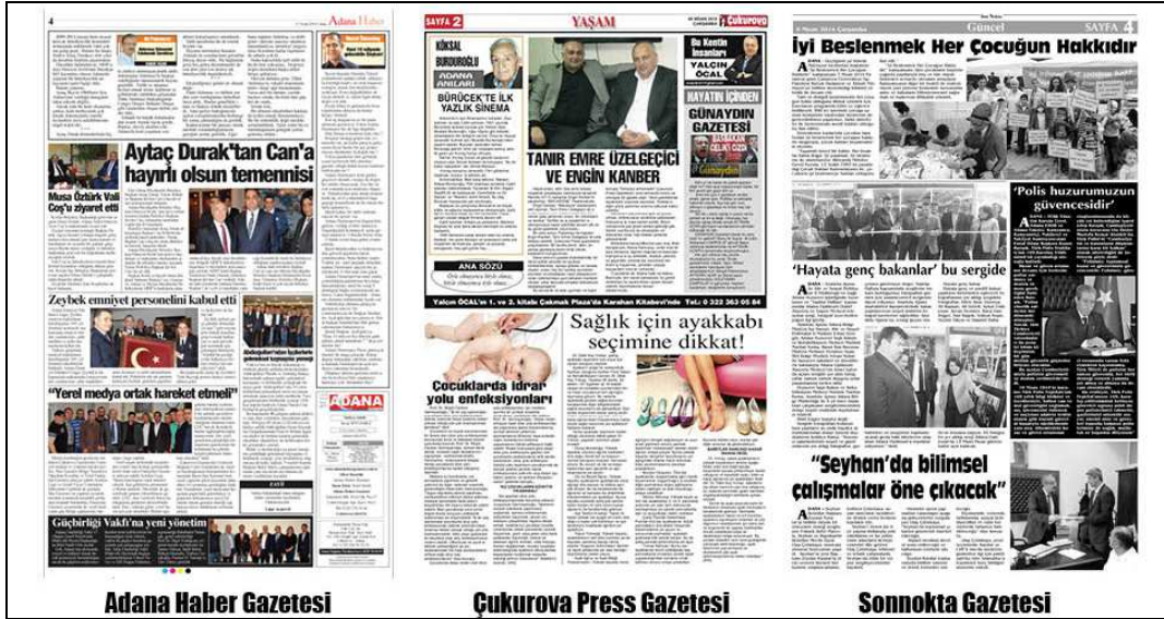
Kaynak: 7 Nisan 2014 (Çukurova Press Gazetesi), 10 Nisan 2014 (Adana Haber Gazetesi), 8 Nisan 2014 (Ekspres Gazetesi), 10 Nisan 2014 (Sonnokta Gazetesi)

Gazete sayfasında yer alan her haber başlığının farklı fonttan dizilmesi çok büyük bir acemiliktir (Şeker, 2004: 22). Haber başlığı ve metin farklı fontlardan oluşturulmamalıdır. Şekil 9'da yer alan örnekte de yer aldığı gibi incelenen gazetelerde bu kurala dikkat edilmediği gözlenmiştir.