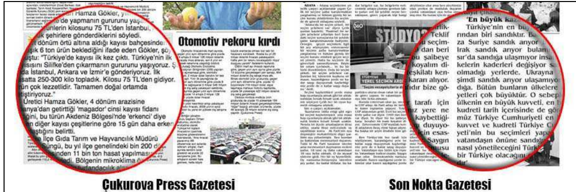
Çukurova Press Gazetesi