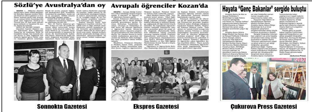
Kaynak: 7 Nisan 2014 (Sonnokta Gazetesi), 9 Nisan 2014 (Ekspres Gazetesi), 9 Nisan 2014 (Çukurova Press Gazetesi)