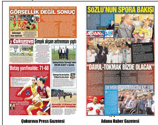
Kaynak: 9 Nisan 2014 (Çukurova Press Gazetesi), 7 Nisan 2014 (Adana Haber Gazetesi)