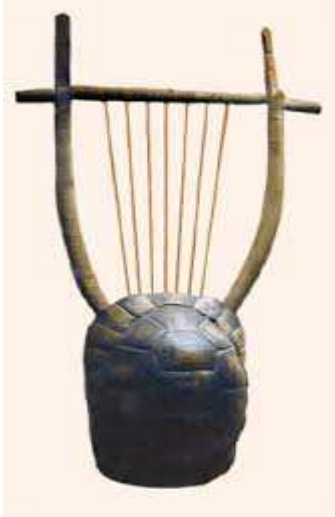
Şekil 2: Lyra (British Museum 1816,6-10.501)

Atina'da bulunmuş olan bir lir 'in fotoğraflarına bakarak bunun nasıl bir müzik aleti olduğunu anlamak mümkündür. Aşağıda şekli bulunan Lir'in kaplumbağa kabuğundan yapılmış bir ses kutusu vardır. Şekilde göremediğimiz arka yüzünde teller köprü üzerinden geçirilerek gerilmiş durumda. Şekilde de görüldüğü gibi teller iki eğri kuşağın arasında yer alan bir çubuğa bağlı. Bu teller, aletin akort edilebilmesi için ağaç veya deriden çubuklara dolanmış durumdadır.