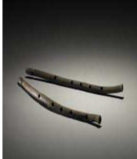
Şekil 3: Aulos (British Museum, 1819,6-10.502)

Timon'un konumundaki çocukların müzik yeteneklerini ortaya koymak için birçok fırsatları vardır. Örneğin, çocuklar festivallere dans etmek veya şarkı söylemek üzere katılabilirlerdi. Hatta bazı durumlarda çocukların müzik yarışmalarına bile katılmaları sağlanmaktaydı. Bu devirde Atina'da şarap tanrısı Dionysos onuruna bir festival düzenlenmekte ve adına şehir Dionysia Şenlikleri denmekteydi. Atina nüfusu 10 kabileden oluşmakta ve bu festivale her kabile 50 erkek çocuktan oluşan birer koro ile katılmaktaydı. Bu festivalde sanatçılar bir daire içinde söyledikleri şarkıları uygun danslarla zenginleştiriyorlardı. Ayrıca bu festival, şehirli ailelere, kırsal kesimden gelen halka çocuklarını nasıl iyi bir şekilde eğitmiş olduklarını gösterme fırsatı da veriyordu. Yine bu festival sayesinde, Atina kenti Grekçe konuşan diğer şehir devletlerine bir gövde gösterisi yapma olanağı buluyordu. Festival, Akdeniz'de ulaşımın güvence içinde yapılabileceği bir mevsimde düzenleniyor ve buradaki etkinlikleri görmek üzere her taraftan akın akın insan geliyordu.