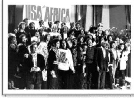
Şekil 2. Biz Dünya'yız! 7

Mikro düzeyde, birey ve ailelerle çalışıldığında, bu değişimler çevresel değişiklikler olarak tanımlanmaktadır. Örneğin, araba kazasında çok kötü yaralar alan bir bireyin sınıfa dönmeden önce okul sosyal hizmet uzmanının öğrencileri bu dönüşe hazırlaması. Makro düzeyde, topluluk ve toplumlarla çalışırken, destekleyici, duyarlı, güçlendirici bir çevre yaratmak sosyal hizmet uzmanlarının hedefidir. Bu düzeyde, sosyal hizmet uzmanı toplumda karar verici organların, devlet ya da hükümetin insan ihtiyaçları ve sosyal problemlere karşı nasıl harekete geçtiğini gözlemler. Bu çabalar, sosyal ve ekonomik adaleti sağlama, insanlar için fırsatları genişletme, insan hayatındaki gündelik şartları iyileştirmek gibi yaklaşımları içerir. Nihai hedef, politik eylemi sosyal değişime teşvik etmektir.