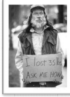
Şekil 1. Sokakta yaşayan bir yoksul 5

Sosyal hizmet her ne kadar tüm insanlığın sosyal işlevselliği ile ilgilense de bir öncelik kuralı esastır. Bu kapsamda, toplumun en savunmasız üyelerine, sosyal adaletsizliğe, ayrımcılığa ve baskıya maruz kalan kesimlere öncelik vermektedir (Sheafor ve Horejsi, 2002). Küçük çocuklar, yaşlılar, yoksullar, zihinsel ve fiziksel engelliler, LGBTİ bireyler veya etnik yapısı ya da ırkları sebebiyle azınlık olanlar toplumun en savunmasız bireyleri arasında gösterilebilir.