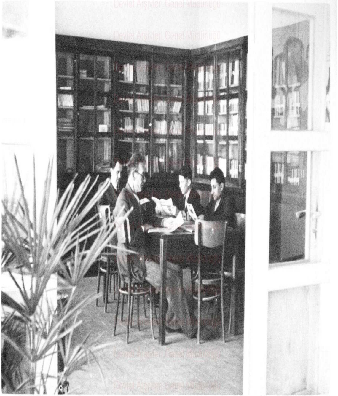
Kaynakça: BCA, 490.01/1076.1116.1.