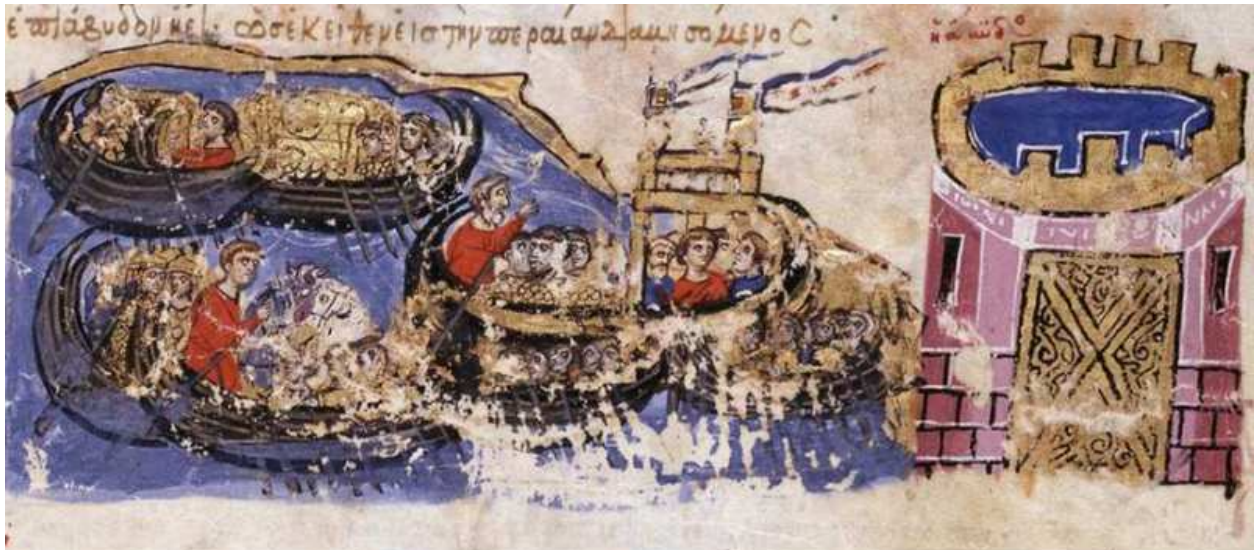
Fig.2 Xylokastra (Skylitzes Elyazmasından).