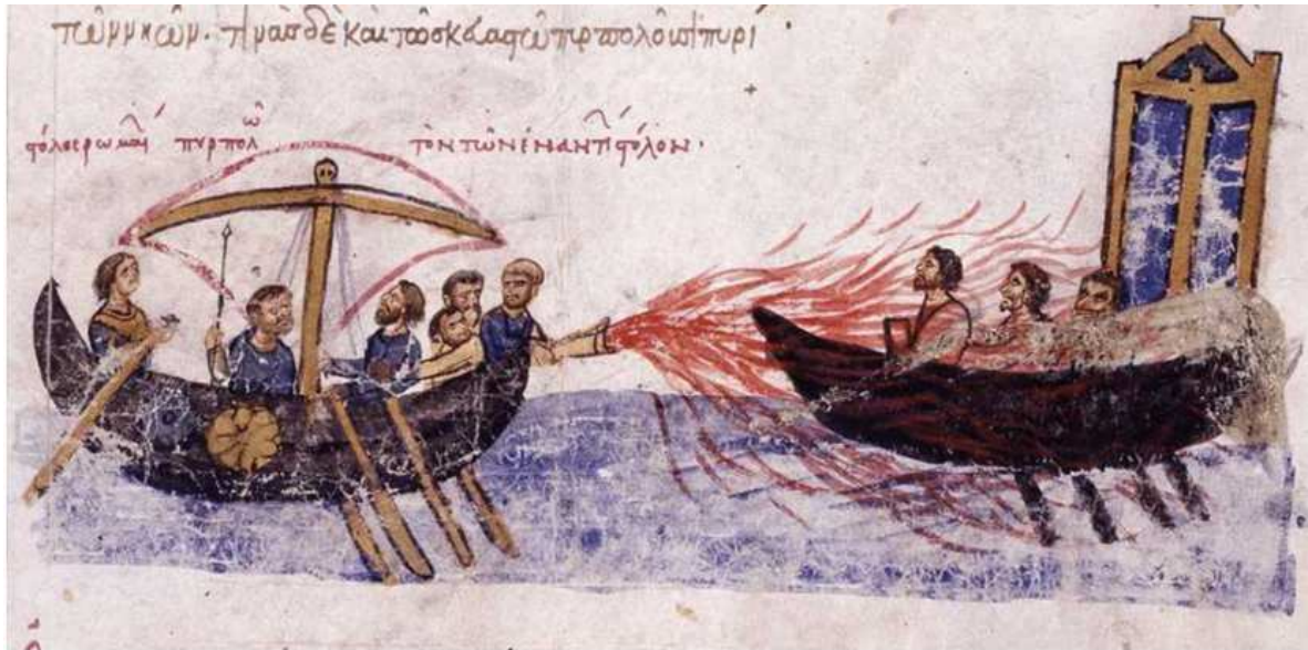
Fig.1 Siphon ve Siphonator (Skylitzes Elyazmasından).