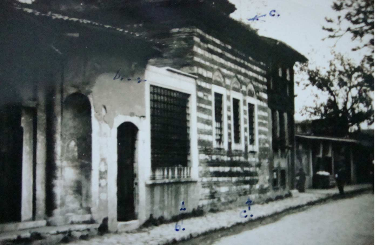
Kalenderhâne Tekkesi ve sıbyan mektebinin dıştan görünüşü, eski hâli.