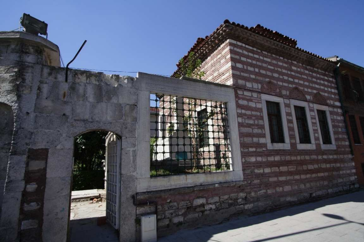
Kalenderhâne Tekkesi'nin bugünkü hâli.