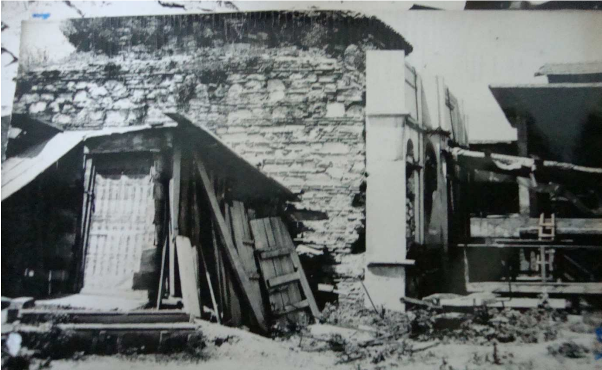
Kalenderhâne Tekkesi dıştan görünüşü, eski hâli.