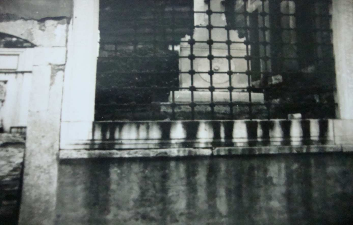
La'li-zâde Abdülbâkî Efendi'nin kabrinin eski hâli.