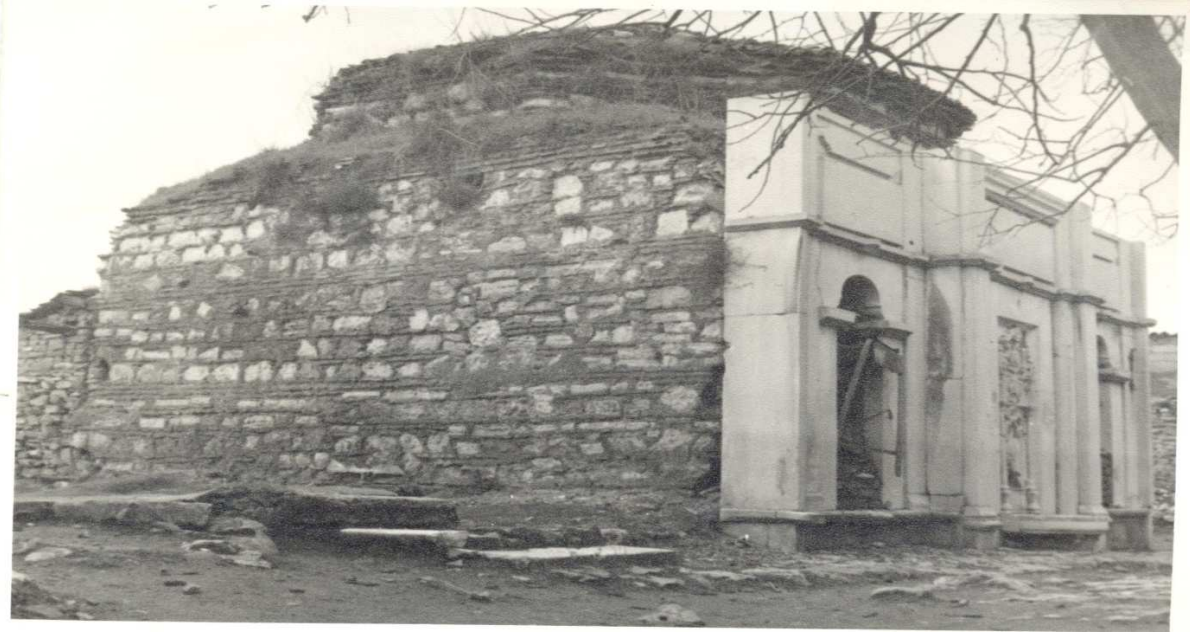
Kalenderhâne Tekkesi'nin dıştan görünüşü, eski hâli (Vakıflar Genel Müdürlüğü Arşivi).