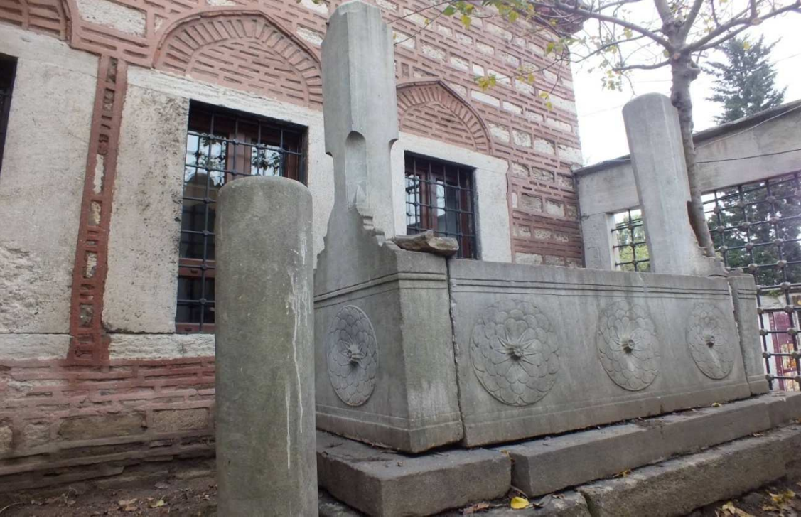
La'î-zâde Abdülbâkî Efendi'nin kabri.