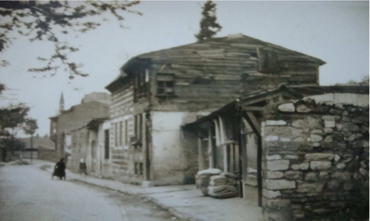
Kalenderhâne Tekkesi ve sıbyan mektebinin dıştan görünüşü, eski hâli.