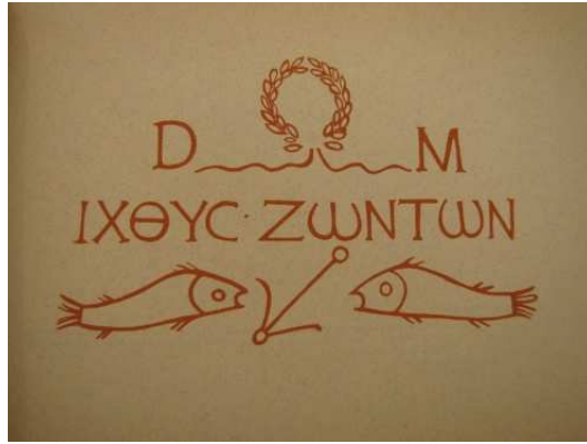
Resim 1. ICHTUS (Beyer, 1954)

betimi İsa ve haç olarak yorumlanmıştır.Roma Priscilla katakombunda iki betimde balık ve çıpa betimleri birlikte yer almaktadır (Castelli, 2013: 11-20).