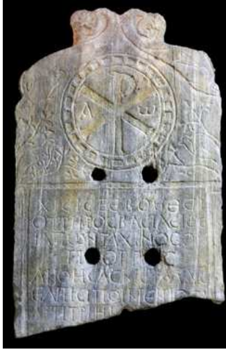
Resim6. Mezar Taşı, mermer, 5. - 6. yüzyıl, Env. 2793, (Kuruçeşme), İstanbul Arkeoloji Müzeleri.