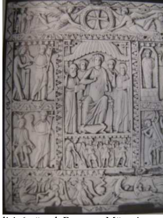
Resim 4. Altar panosu, fildişi, 6.yüzyıl, Ravenna Müzesi.

Bu örnekler Yunus öyküsü ve balık betimlerinin birden fazla sembolik anlatım içermesiyle hem Eski Ahit hem de Yeni Ahit ile olan bağlantısını göstermektedir. 10. yüzyıl ve sonrasına ait elyazmalarında Yunus peygamber öyküsü mezmur kitapları ve menologion örneklerinde işlenmiştir. Paris Mezmuru olarak adlandırılan ve 11.yüzyılın ikinci yarısında İstanbul'da (Konstantinopolis) yazılan bu eser günümüzde Paris Bibliothéque Nationale'dedir. Paris Mezmuru'nda Yunus peygamberin yaşamıyla ilgili dört olay aynı sahnede yer almaktadır. Yunus figürü giyimlidir ve Yunus'u yutan büyük balık deniz canavarı biçiminde betimlenmiştir (Morey, 1929: 27). Yunus peygamber bu betimde Bizanslı bir aziz veya din adamı görünümündedir. Diğer elyazması II. Basil Menologion'u (Azizler / Kutsal kişiler takvimi), 10.yüzyıl sonu-11.yüzyıla tarihlendirilmektedir ve günümüzde Vatikan Kütüphanesi'ndedir. Bu eserde de Yunus peygamberin deniz canavarının ağızından karaya çıkışı betimlenmiştir (Morey, 1929: 27). Yunus öyküsünün betimlendiği daha geç tarihli bir örnek 1300 yılına ait Spencer Mezmuru adlı kitapta yer almaktadır (Cutler, 1992: 129-150, resim 5). Yunus kitabındaki bölüm ile birlikte 'Yunus deniz canavarının ağızında' betimi biraradadır.