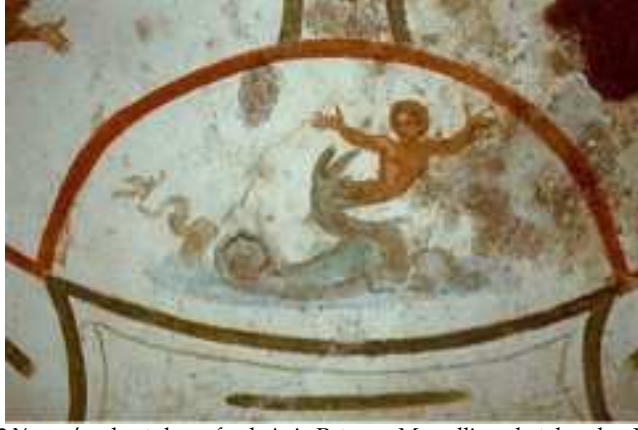
Resim 2. Yunus'un kurtuluşu, fresk, Aziz Peter ve Marcellinus katakombu, Roma.

Yunus peygamber öyküsü lahitlerde de işlenen bir konudur. Bu öykünün yeniden diriliş temasıyla bağlantısının lahitlerde betimlenmesinin nedeni olarak öne sürülebilir. İstanbul Arkeoloji Müzeleri'nde 4.-5. yüzyıllara tarihlenen lahite ait parça üzerinde kabartma olarak Yunus Peygamber öyküsü betimlenmiştir (Resim 3). Hıristiyan geleneğinde özellikle erken dönemlerde bu konunun işlendiğini gösteren bir eserdir. Eserde gemi, denizciler ve Yunus peygamberin balina veya deniz canavarına atıldığı sahne ayrıntılı biçimde betimlenmiştir. Bu bölümde denizde bir Yunus balığı betimi de bulunmaktadır.