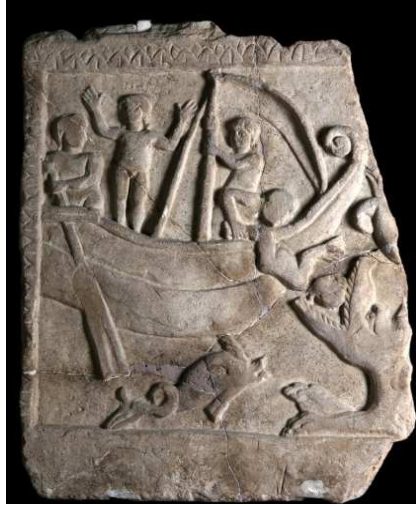
Resim 3. Lahite ait parça, 90x71 cm, kalker, 4.-5. yüzyıl, Env. 4517 (Fatih), İstanbul Arkeoloji Müzeleri.

Yunus peygamber öyküsü lahitlerde de işlenen bir konudur. Bu öykünün yeniden diriliş temasıyla bağlantısının lahitlerde betimlenmesinin nedeni olarak öne sürülebilir. İstanbul Arkeoloji Müzeleri'nde 4.-5. yüzyıllara tarihlenen lahite ait parça üzerinde kabartma olarak Yunus Peygamber öyküsü betimlenmiştir (Resim 3). Hıristiyan geleneğinde özellikle erken dönemlerde bu konunun işlendiğini gösteren bir eserdir. Eserde gemi, denizciler ve Yunus peygamberin balina veya deniz canavarına atıldığı sahne ayrıntılı biçimde betimlenmiştir. Bu bölümde denizde bir Yunus balığı betimi de bulunmaktadır.