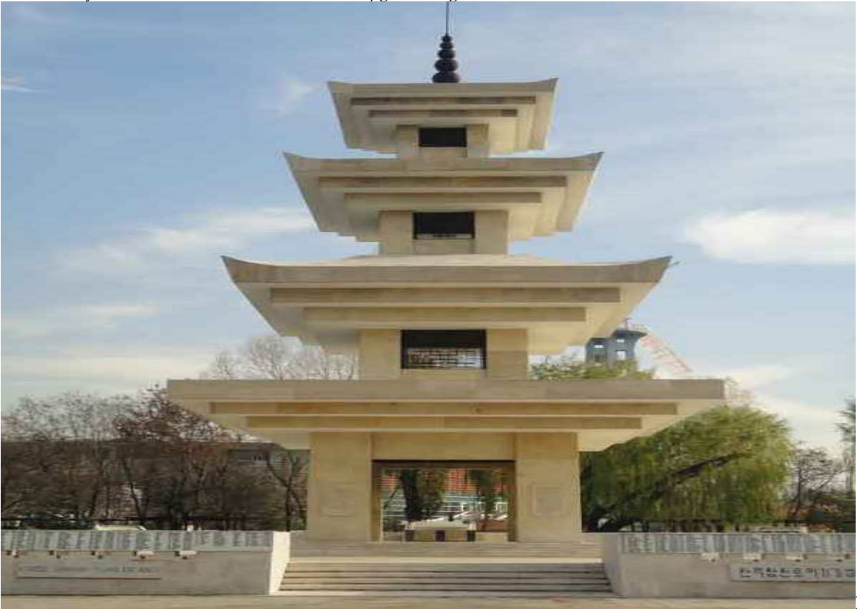
:6 Kore'de Savaşanlar Anıtı - Ankara muharipgaziler.org.tr