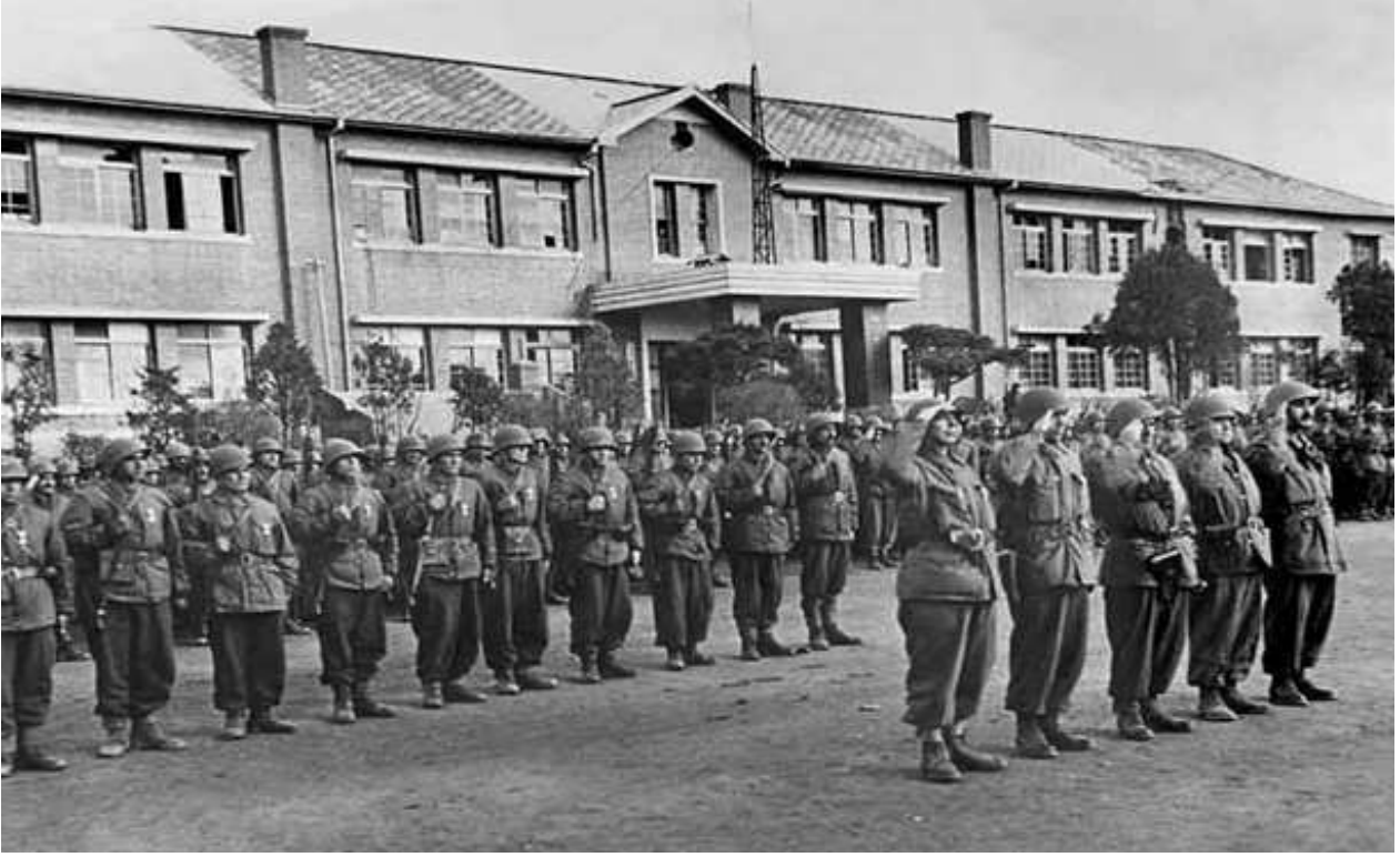
Ek:1 Türk Tugayına Kunuri Muharebelerindeki Başarılarından Dolayı Düzenlenen Madalya Töreni.