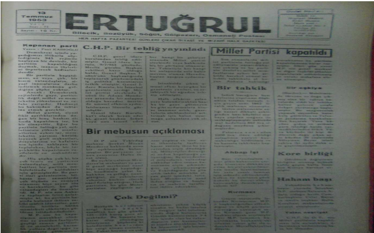
Ek:11 13 Temmuz 1953 tarihli Bilecik Ertuğrul gazetesi.