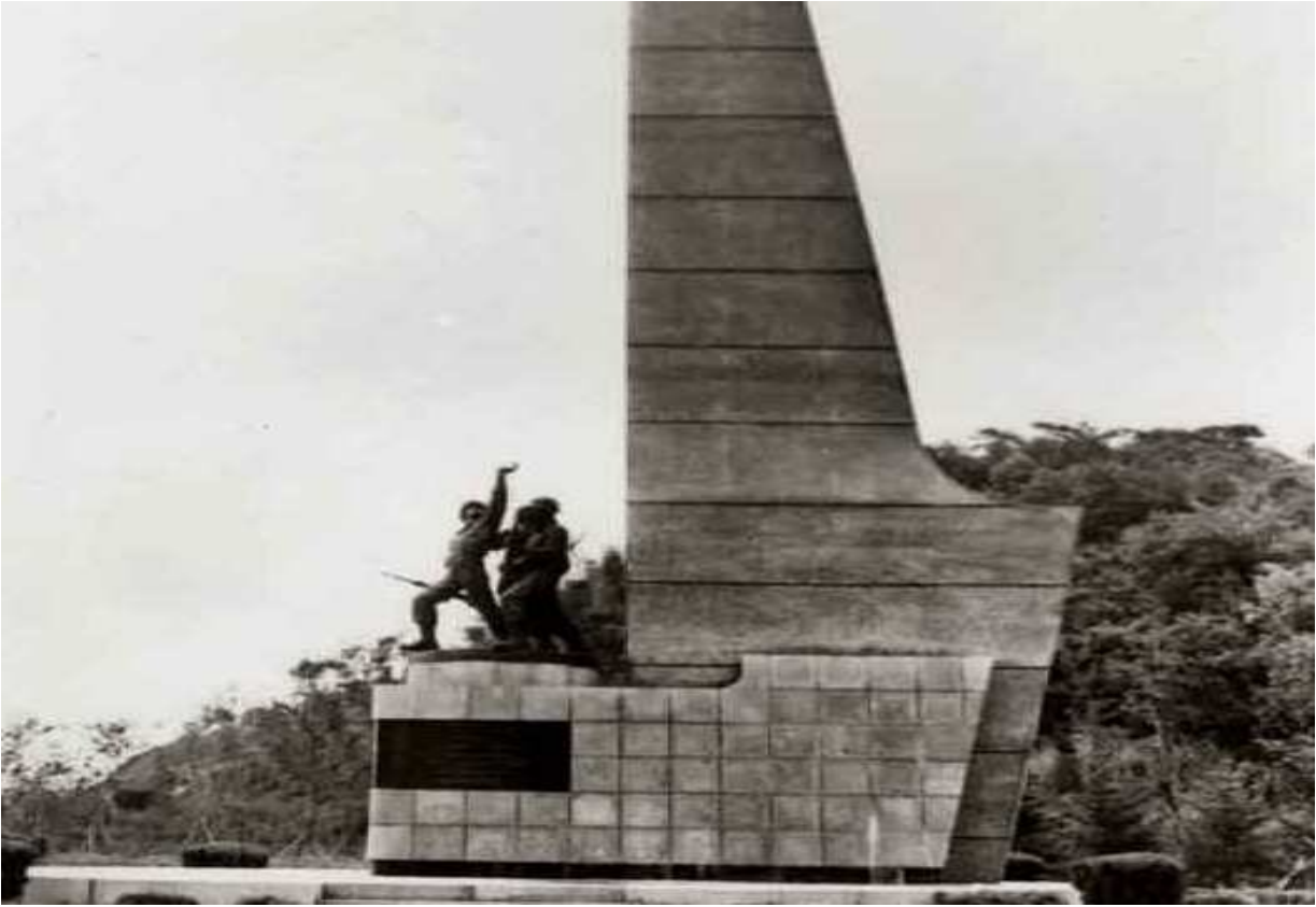
Ek:5 Güney Kore'de Türk Askeri Anıtı. muharipgaziler.org.tr