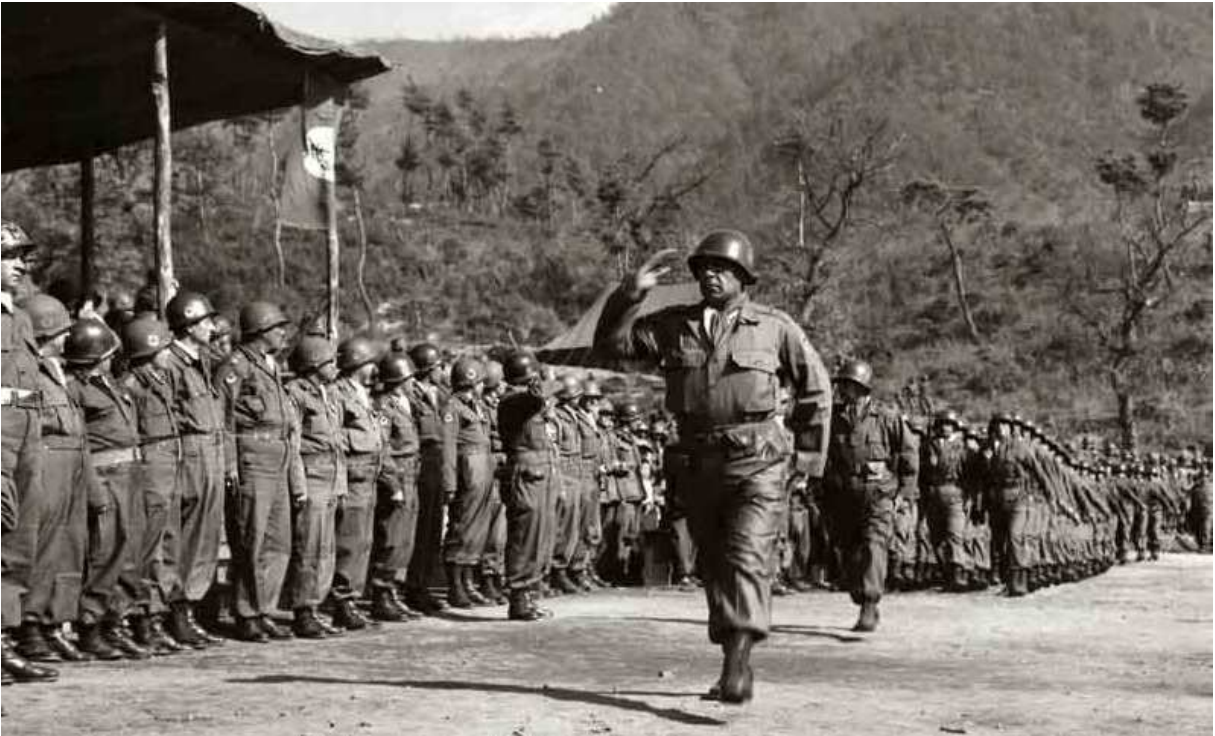
Ek:4 2'inci Türk Tugayı Alay Komutanı Şehit Piyade Albay Nuri Pamir Komutasında Alay Tören Geçişinde. muharipgaziler.org.tr