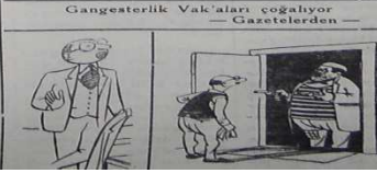
Ek:10 7 Temmuz 1952 tarihli Bilecik Ertuğrul gazetesi.

Gangesterlik Vak'aları coğalıyor — Gazetelerden — 29/6/1952 günü Vezirhanda yapılan muhtar meclisinin C.H.P. 4 üyesi