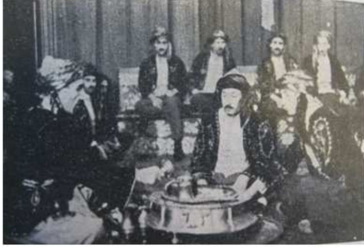
Mırra Yapılırken (Ülkü Dergisi'nden Hamdi Olcay'ın Ziyaretinden Alınmıştır)