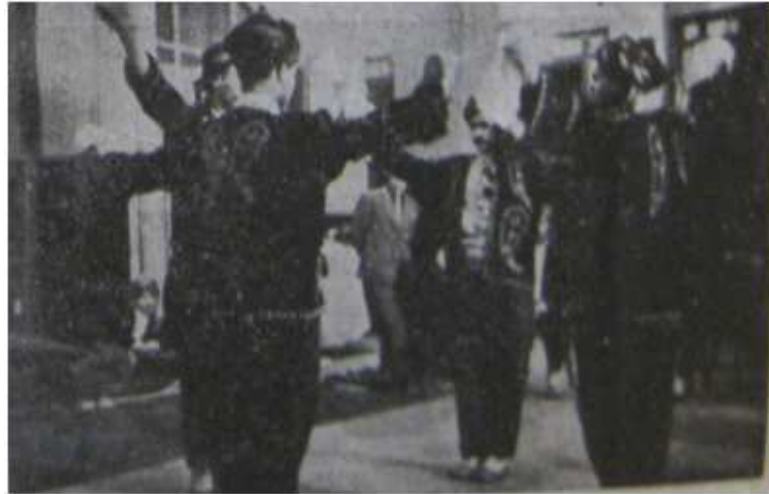
Urfa'nın Yöresel Oyunlarından Dörtlü Oyun