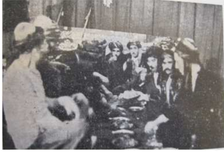
Çiğ Köfte Yenirken