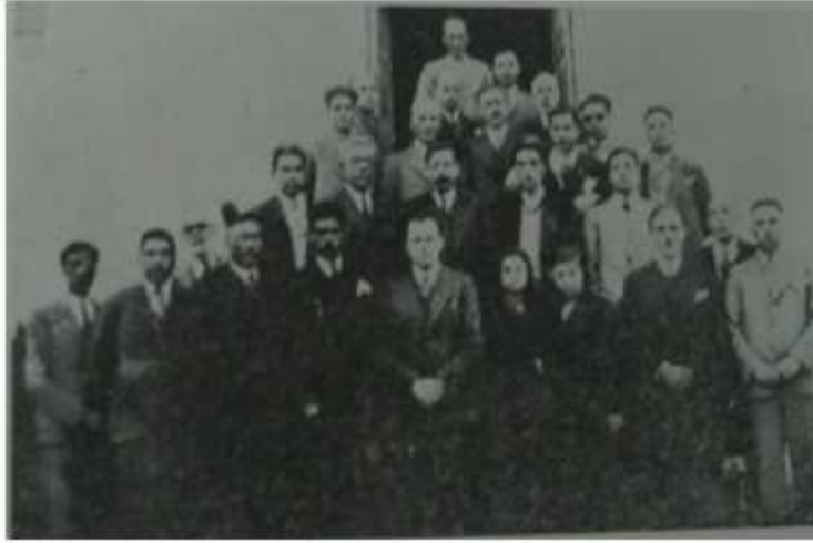
Urfa Halkevinin İlk Şube Üyeleri (Urfa Halkevi 1 Yıllık İş Sayımı)