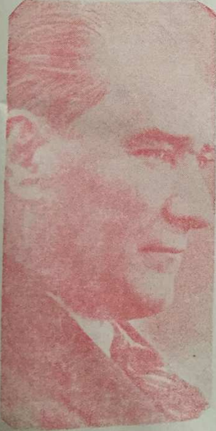
Anavatanı ve bu meyanda Gazi yurdumuzu esaretten urtaran aziz halâşkârımız Gazi M. Kemal Hz.

Umumî harbin neticesin de bir çok türk şehirleri