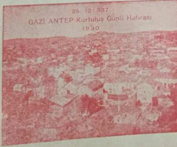
25. 12. 337 GAZİ ANTEP Kurtuluş Günü Hatırası 1930 Gaziantepin umumî manzarası

Meserretimizin büyüklü- ğü, kurtulduğumuz felâke- tin dehşet ve azameti nisbe.