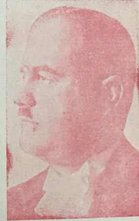
Şehrimizin kurtuluşunda unutulmaz hizmetleri seb- keden aziz mebusumuz Kılıç Ali Beyefendi