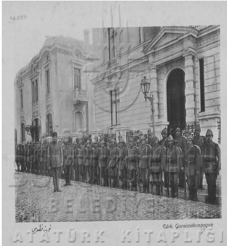
Bükreş'te Türk Nöbet Kıtası