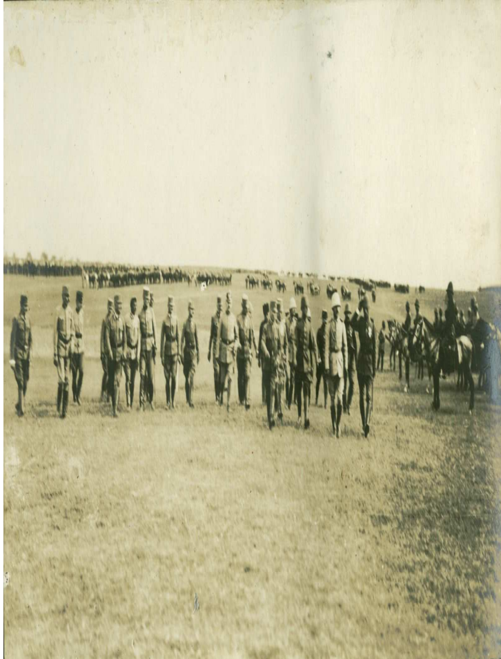
Enver Paşa'nın Romanya Cephesi'ndeki Türk Birliklerini Ziyareti