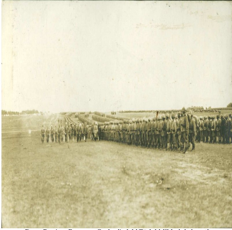
Enver Paşa'nın Romanya Cephesi'ndeki Türk birliklerini ziyareti