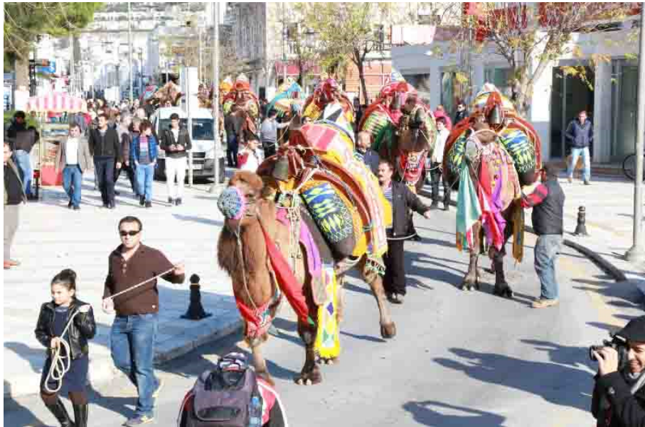
Fotoğraf 3. Deve güreşi korteji, Bodrum / Muğla, 02.01.2015.

Ritüelin hazırlık aşamasında güreşten bir ya da iki gün önce isteğe bağlı olarak bazı develer davul-zurna veya davul-klarinet eşliğinde kent ya da ilçe merkezinde dolaştırılır. Bu da güreşlerin yapılacağını duyurmak ve 'komünitas'ı oluşturacak insanların güreşe davet edilmeleri anlamına gelir.