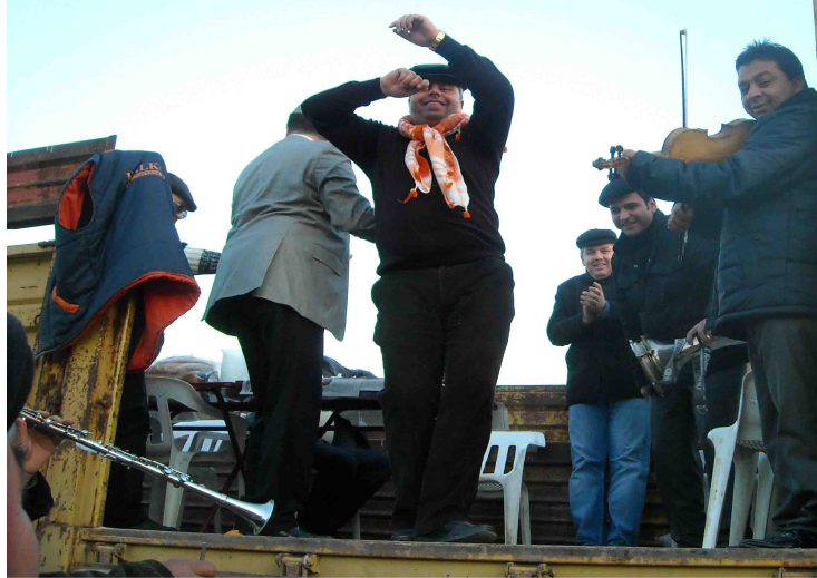
Fotoğraf 8. Kiralandıkları masaya müzik hizmeti sunan müzisyenler, Germencik / Aydın, 09.01.2011.

alıyorlardı. Bu müzik hizmetinde kiralanılan takım, güreş bitinceye kadar sadece kiralandıkları masaya özel seslendirme yapar.