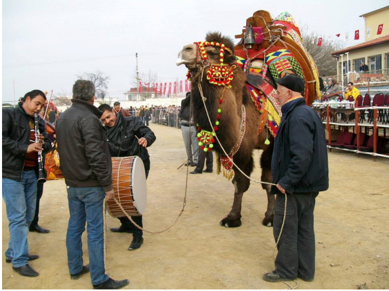
Fotoğraf 7. Güreşe çıkacak devenin Koroğlu Havası'yla motivasyonu, Karaağaç / Gömeç / Balıkesir, 05.01.2014.

ilişkilendirilen 'Koroğlu Havası' 15 ile yapılır. 16 Koroğlu Havası, deve güreşlerinin yanı sıra cirit, cop (mısır odunu), boğa güreşi, rahvan at yarışı, yağlı güreş vb. ritüellerde de icra edilen en yaygın havadır. İster komite tarafından kiralansın, isterse disko yapmak için gelmiş olsun ritüele katılan her müzisyen deve sahipleri tarafından "gel bir Koroğlu çal" deyip çağırılabilir ya da develerin bağlı bulunduğu alanda develerin arasında Koroğlu Havası çalarak dolaşip deve sahiplerinden bahşiş toplamaya çalışırlar. Develerinin Koroğlu'nu duyunca daha fazla kızıştıklarına inanan deve sahipleri çoğu zaman bu durumdan memnundurlar ve müzisyenlere bahşiş verirler.