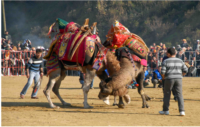
Fotoğraf 1. Deve gürüşü, Germencik / Aydın, 09.01.2011.

Ekonomik olarak, deve gürüşleri birçok kişiye kazanç elde etmeleri için ortam sağlar. Deve gürüşleri, deve sahipleri dışında, gürüş sahası çevresinde kurulmuş tezgâhlarda deve gürüşünün simgesi olan deve etinden yapılmış sucukları, daha önce yapılan deve gürüşlerinin DVD videolarını, el yapımı deve aksesuarlarını, bölge ve deve gürüşüyle ilişkilenen yerel kıyafetleri, el yapımı çizmeleri ve gürüşlere katılan deve sahiplerine verilen halıları, çeşitli gıda ve içecek ürünlerini satan esnaflar ve elbette çok sayıda müzisyen için önemli bir ekonomik pazardır. Yerel yönetimlerin deve gürüşlerinin kültürel olduğu kadar yerli-yabancı turistleri kendine çekmesiyle 'kış turizmi' olarak tanımlanabilecek ekonomik kazanımlarının farkına varmış olmaları sayesinde, son yıllarda bir sezonda yapılan gürüş sayısının 140'a ulaşmış olması bunu doğrular. Sözelimi Selçuk'ta yapılan deve gürüşleri, çevre il ve ilçelerden gelen yerli turistlerin olduğu kadar Efes, Meryem Ana gibi tarihsel, arkeolojik ve dinsel öneme sahip yerleri gezmeye gelmiş yabancı turistlerin de ilgisini çekmektedir.