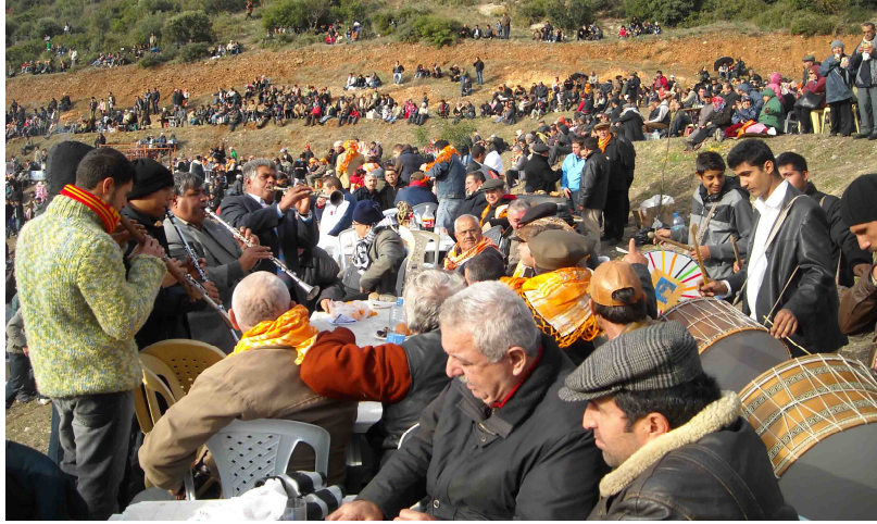
Fotoğraf 9. Deve güreşinde birkaç müzisyen grubun aynı masaya disko yapması, Kuşadası / Aydın, 20.12.2009.

saygınlığa ve prestije vurgu yapılması açısından önemlidir. Bu müzisyenler tanınmışlıkları oranında diğer takımlara oranla daha fazla saygı görür ve aynı oranda da daha fazla bahşış alırlar.