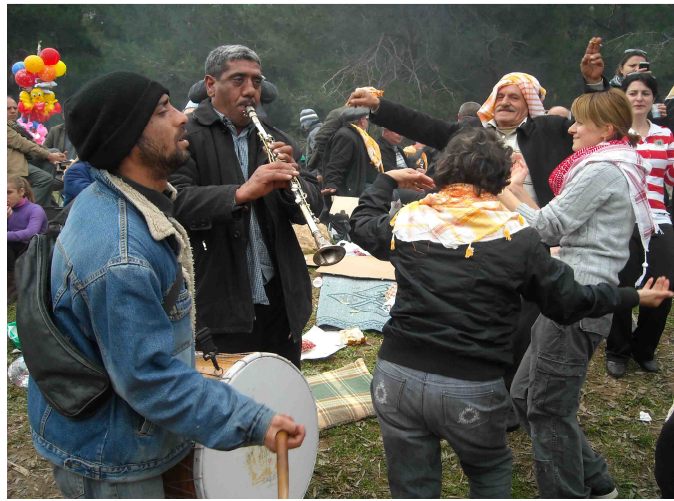
Fotoğraf 8. Deve güreşinde disko müzisyenliği yapan müzisyenler, Selçuk / İzmir, 16.01.2011.

Disko ediminde müzisyenler özellikle yüksek bahşiş verme potansiyeli olan masalara ve kişileri memnun etmeye özen gösterirler. Protokole davet edilen kişileri müzikle karşılanması çok sık görülür. O anda boşta olan takımlar, bu kişileri gördüklerinde müzik ile karşılarlar ve protokoldeki yerlerine oturuncaya kadar eşlik ederler. Özel davetlilerin statülerini vurgulayan ve prestijlerini pekiştiren müziğin karşılığında yüklü bir bahşiş vermeleri adettendir.