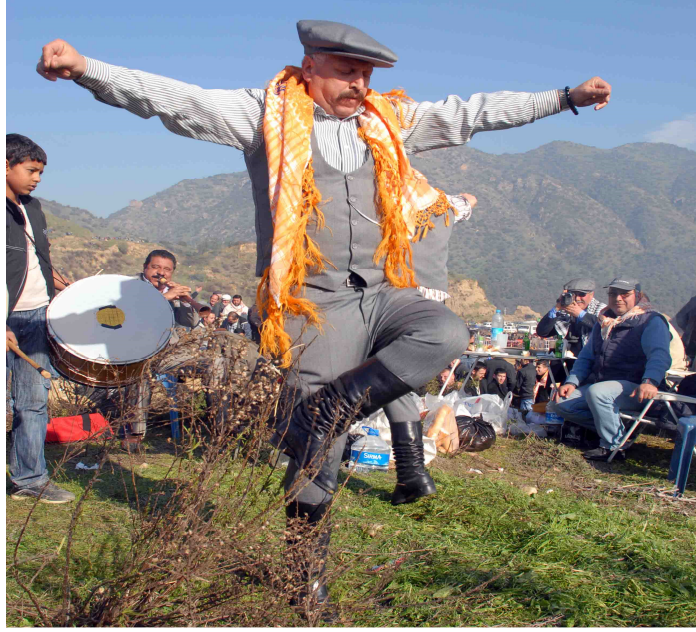
Fotoğraf 5. İzleyici olarak deve güreşine gelen iki kişinin zeybek performansı, Germencik/Aydın, 09.01.2011.

Müşterilere sunulan diğer bir müziksel içerik ise dinlemeye yönelik müziklerden oluşur. Seslendirilen müzikler ağırlıklı olarak 'ince çalgı' olarak adlandırılan ve klarinet, keman, darbuka gibi çalgıların yer aldığı çalgı toplulukları tarafından gerçekleştirilir. Çoğunlukla Türk Sanat Müziği ve Türk Halk Müziği biçemlerindeki şarkı ve türkülerin bilinen örnekleri seslendirilir.