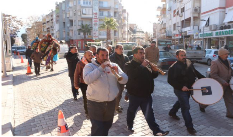
Fotoğraf 6. Develerin müzik eşliğinde dolaştırılması, Menemen / İzmir, 10.01.2015.

Sabit bir yerde müzik hizmeti her güreşte görülmemekle birlikte, genellikle ritüel yapısı daha büyük olan güreşlerde belediye veya komite tarafından kiralanan davul-zurna veya davul-klarinet takımlarının güreşlerden bir-iki gün önceden başlayarak şehir/köy meydanında deve güreşinin habercisi olarak yaptıkları seslendirmelerdir. Dinleti biçiminde gerçekleşen bu seslendirmelerde amaç, gerçekleşecek olan deve güreşi ritüelini müzik aracılığıyla duyurmaktır. Bu da özellikle ritüel anında seslendirilen yerel havalardan (Koroğlu, Harmandalı vb.) oluşan bir dağarın icra edilmesi yoluyla gerçekleştirilir.