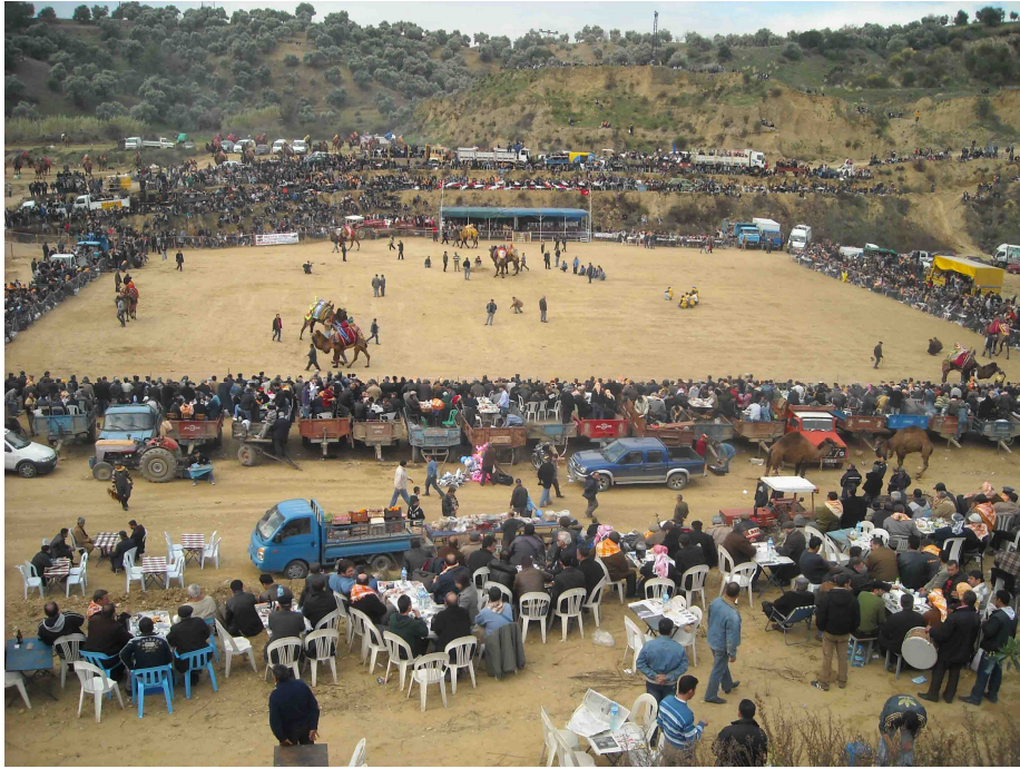
Fotoğraf 4. Deve güreşi arenası, Germencik / Aydın, 10.01.2010.

Güreş sahasındaki hazırlıklar, güreş sahasının güreş için temizlenip varsa protokol ve hakemlerin oturacakları yerlerin düzenlenmesi ile başlar. Güreş gününde (pazar) sabahın erken saatlerinde seyyar satıcıların güreş sahası çevresinde kendilerine ayrılan yerlerdeki hazırlıklarını yaparlarken, yiyecek hizmeti veren esnaflar da masa ve sandalyelerini yerleştirip mangallarını yakmaya başlarlar. Olası problemler için ambulans da saha kenarındaki yerini alır, güvenlik ise jandarma ya da polis tarafından sağlanır. Komitenin görevlendirdiği kişiler de saha girişinde bilet kesecekleri yerde konumlanırlar. Çoğu deve güreşi organizasyonu düzenlenen yerde seyirciler, düşük bir ücret karşılığında komiteye yardım etmek için veya elde edilen gelirle okul, cami, çeşme vb. yapılmasına katkı sağlamak amacıyla girişte bağış adı altında kesilen biletleri satın alarak güreş alanına girerler.