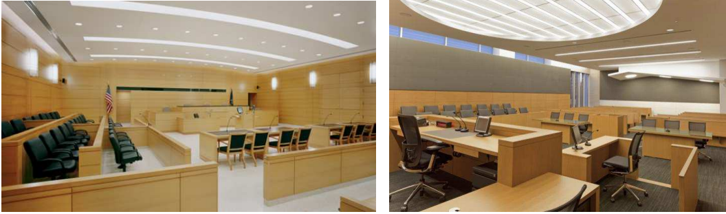
Şekil 5: "New York State Supreme Court" mahkeme salonu (Tasarım: Perkins Eastman Architects) ve "Kent County Courthouse" mahkeme salonu

Salonların belirli bir sistem içerisinde, kürsü ve sanığın duracağı yere korkuluk konması suretiyle tasarlanmalıdır. Ayrıca bu salonlarda dikkatli tefriş yapılmalıdır. Salonlar ışığı en iyi alacak şekilde düzenlenirken kürsü ve diğer tefrişatın mümkün olduğunca ahşap veya ahşap görünümlü eskitme malzeme ile yapılması ortama sıcak bir hava katacaktır (Şekil 5).