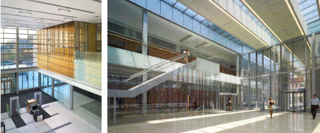
Şekil 2: Durham Consolidated Courthouse (WZMH Architects) iç mekân girişi ve "Franklin County Court of Common Pleas" adliyesi girişi

Giriş bölümünde, gün içinde duruşma ve saatlerin gösterildiği elektronik olarak tasarlanmış tabela, vatandaşların fazla vakit kaybetmeden ne zaman davalarının/görüşmelerinin olacağına takip ederek yol gösterici olur. Danışmanın bu sorularla olan görüşmeleri azalmış olur ve insanlar bu tabeladan görüşmelerini takip edebilirler.