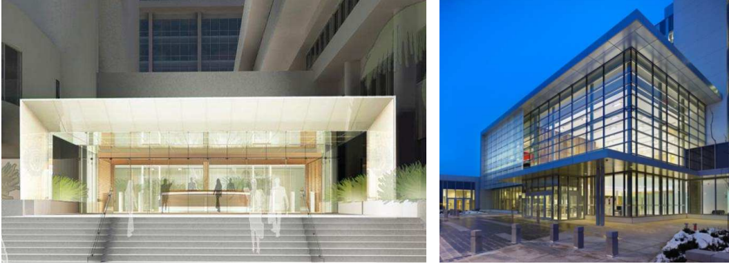
Şekil 1: "Honolulu Federal Courthouse" Girişi ve Durham Consolidated Courthouse (WZMH Architects, Kanada, 2010) girişi

Ayrıca mimari açıdan binaların ana giriş kapıları, gösterişten uzak fakat resmiyet ve haysiyet duygusu hissettirilerek, sade fakat çarpıcı bir etkiyle tasarlanmalı ve hemen her noktadan algılanması açısından önemli bir yapı ögesidir (Şekil 1).