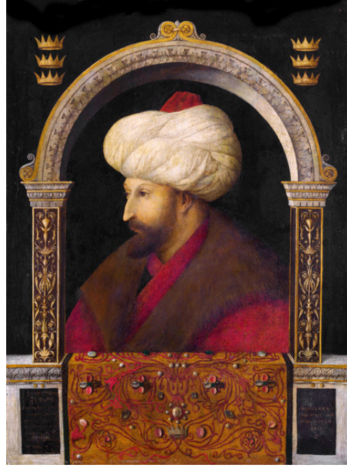
Resim 1: Fatih Sultan Mehmed'in Portresi

Fetihten sonraki erken dönemlerde ressamalar için kentin en önemli yeri kuşkusuz Sarayburnu ve tarihi yarımadadır. Batılı ressamlarca yapılmış ilk İstanbul resimleri de Sarayburnu'nu gösteren panoramik manzaralardır (Çötelioglu, 2009:13).