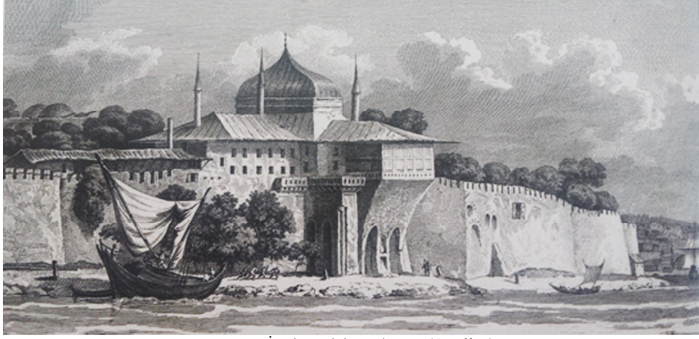
Resim 6: İncili Köşk betimlemesi (Gouffier)