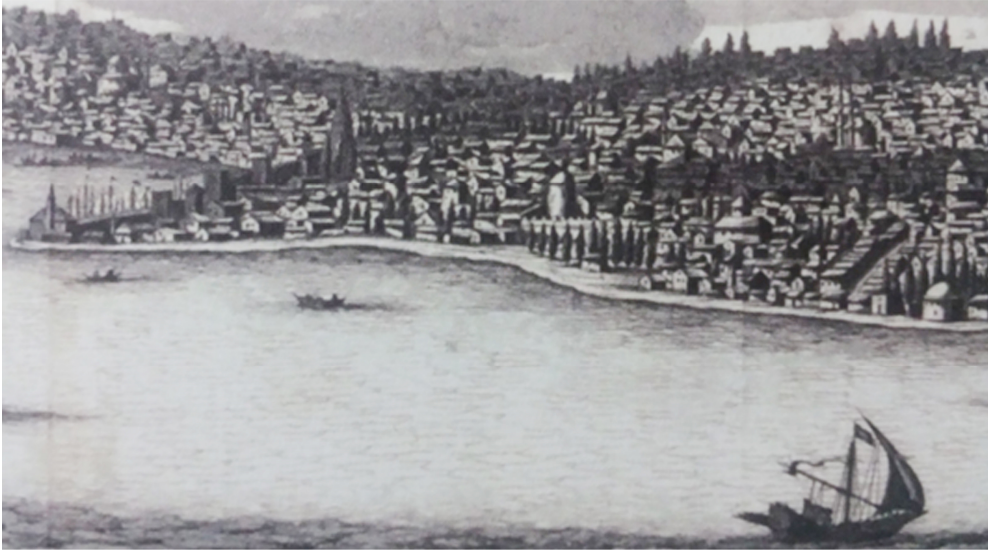
Resim 4: İstanbul Panoraması (Corneille Bruyn)

Melchior Lorichs'den sonra İstanbul'a gelen Corneille Bruyn ise bir yıl burada yaşamıştır. İstanbul panoramaları içeren gravürler yapan ressam Üsküdar tarafından çizilen gravürde Sarayburnu, Haliç ve Galata betimlenmiştir (Resim 4).