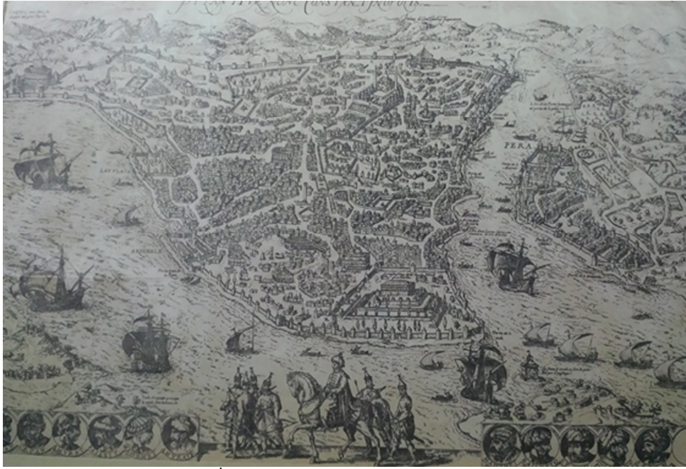
Resim 3: İstanbul Haritası (Giovanni Andrea Vavassore)