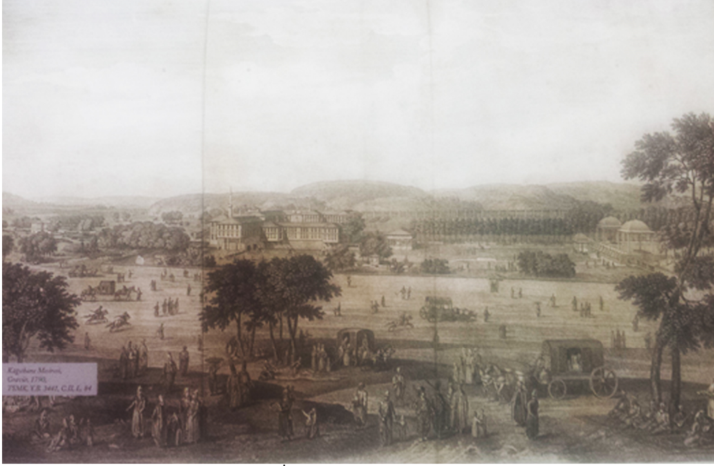
Resim 5: İstanbul Panoraması (L'espinaŝse)

İstanbul seyahatinde yaptığı gravür ile günümüzde Osmanlı kültürünü tanımlayan ve bu yüzden önemli bir belge olarak görülen eserin sahibi L'espinaŝse'dir. Lale Devri'nin (1703-1730) önde gelen eğlence yerlerinden biri olan Kâğıthane mesiresinde hareketli bir günlük yaşam sahnesinin betimlendiği resimde, arka planda S'adabad Sarayı görünür (Resim 5). Sultan III. Ahmet döneminde Sadrazam Damat Paŝa tarafından saray, 1730 yılında Patrona Halil İsyanı'nda yıkılmış, III. Selim (1789-1807) ve II. Mahmud (1808-1839) dönemlerinde yenilenmiştir. Resim sarayın III. Selim dönemindeki görünümünü belgelemektedir (Çöteliöđlu, 2009:34). çizim incelendiğinde günümüzde şehrin merkez ilçelerinden biri olan Kağıthane'ye bađlı semtte S'adabad sarayı dışında başka yapıların olmadığı ve halkın zaman geçirebildiđi geniş mekanların olduđu görölmektedir.