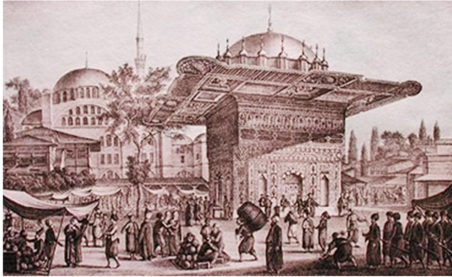
Resim 8: Tophane'de Çeşme. Taşbaskı (A.I.Melling)