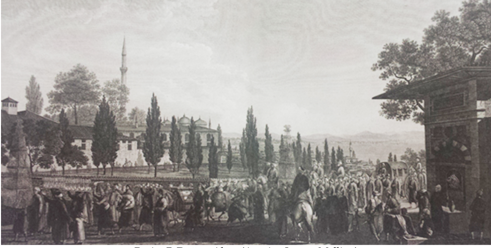
Resim 7: Düğün Alayı (Antoine Ignace Melling)

İstanbul'un betimlemelerinde önemli bir yeri bulunan diğer bir sanatçı ise William Henry Bartlett'tir. Doğu hayranı olan sanatçı İstanbul'da yaşadığı süre içinde (1830) sayısız resim yapmıştır ve bunlardan 83 tanesi daha sonra gravür ile kitaplarda yer almıştır. Bu gravürlerden en bilinenleri Valens Su Kemeru, Kız Kulesi ve Eyüp'ten İstanbul Görüntüsü adlı gravürleridir.