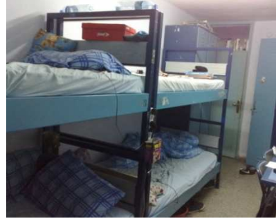
Erkekler için ait yurt odası örneği