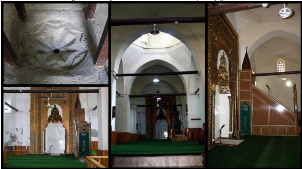
Fotoğraf: 4. Amasya Gök Medrese Camii Harimi, Mihrabı, Minberi ve Sekiz Kollu Yıldız Şeklindeki Tahliye Deliği (F. Koçyiğit 2014)