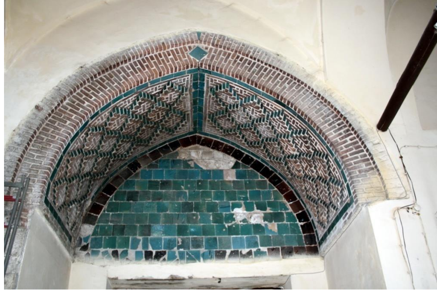
Fotoğraf: 10. Amasya Gök Medrese Doğu Eyvanı Çini Bezemesi

Eserin doğu cephesinde yer alan eyvan, çinilerle bezenmiştir. Bu eyvandan türbeye geçişi sağlayan açıklık orijinal görülmemektedir. A. Gabriel bu mekâna girişin türbenin dışında yer alan kapıdan sağlandığını söylese de buna dair kanıtlar bulunmamaktadır. Günümüzde türbe olarak kullanılan bu mekânın orijinalinde dersane odası olduğu ve sonradan Torumtay'ın yakınlarının defnedilerek türbeye dönüştürüldüğü ileri sürülmektedir (Ünal, 2007: 240). Amasya'nın eski tarihlerine tanıklık eden halktan kişiler de türbenin mumyalığında,