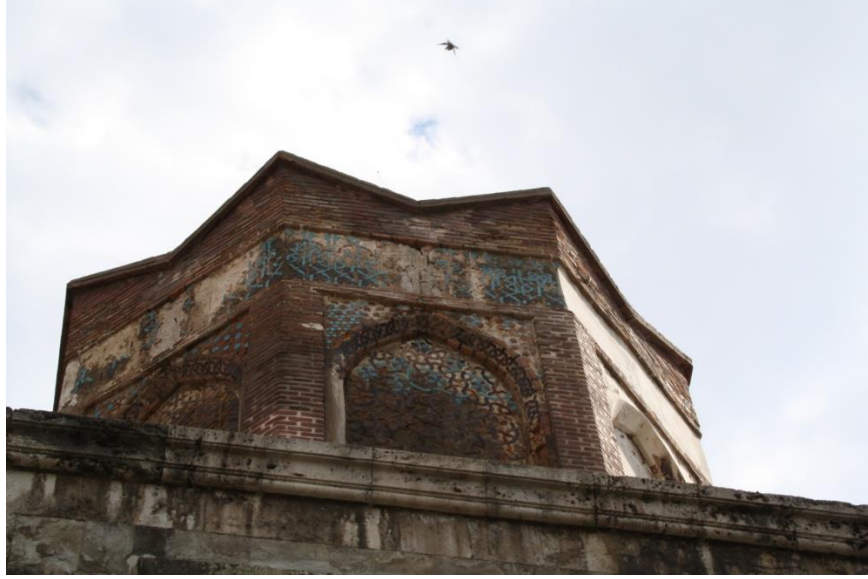
Fotoğraf: 9. Amasya Gök Medrese Külah Kasnağı Çini Bezemeleri

de rasathane olduğu ileri sürülmektedir ancak, bir rasat kuyusunun izine rastlanılmamıştır (Eyice, 1992: 540). A. Gabriel, Gökmedrese Camii'nin giriş eyvanının önünde yer alan kubbesinin bir zamanlar açık olduğunu ve üstünde aydınlık fenerinin bulunduğunu belirtmiştir. Ne yazık ki günümüzde bu iddiayı destekleyecek bir delil bulunmamakta, ayrıca bahsi geçen bu kubbenin altında bir rasat kuyusunun izlerine de rastlanılmamaktadır. Burada sadece sekiz kollu yıldız formunda tasarlanmış bir tahliye deliği vardır. Eserin camii olarak da kullanıldığını göz önüne alırsak burada cemaatin taşıma su ile abdest aldığını düşünebiliriz. Diğer bir iddiaya göre; camiinin güneydoğu cephesinde yer alan türbesinin külahının bulunmadığı ve gözlemlerin buradan yapıldığı ileri sürülse de külahın yüksek kasnağı gözlem yapmaya uygun değildir, ayrıca burada da ne bir havuz ne de bir rasat kuyusunun izlerine rastlanılmaktadır.