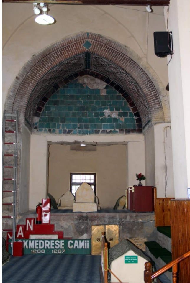
Fotoğraf: 5. Amasya Gök Medrese Türbe Olarak Düzenlenmiş Mekânın İç Kısmı (F. Koçyiğit 2014)

Camii hariminin kuzeyinde, taç kapının iki yanında birer adet sivri kemerli eyvan bulunmaktadır. Bu mekân harimin diğer kısımlarından aşağı bir kotta yer alır. Harimin kuzeydoğu tarafında bulunan türbe iki bölümlü olup, ilk bölümü eyvan şeklinde düzenlenmiştir. Eyvan kemerinin aynası firuze ve mor renkli çinilerle bezenmiştir. Kemer karnı ise çini ve sırsız tuğlalarla yapılmış baklava dilimi motifleriyle bezenmiştir. Bu eyvanın alt katı mummyalık olarak düzenlenmiştir. Üstünde ise sadece bir adet sanduka bulunmaktadır. Eyvanın arka kısmında bulunan kare formundaki açıklık ile türbenin ikinci kısmına geçilir. Burada yer alan yedi adet sandukanın kime ait olduğu bilinmemektedir. Bu mekânın üstü iç kısımda kubbe, dış kısımda ise yüksek sekizgen kasnaklı bir külah ile örtülmüştür. Tuğla malzeme ile inşa edilmiş olan külahın kasnağı, her cephede sivri kemerli nişlerle hareketlendirilmiştir. Bu nişlerden sadece ikisinde küçük birer pencere yer alırken diğerleri sağır (masif) yapılmıştır. Kalıntılardan anlaşıldığı üzere nişlerin kemer köşeleri, kemer karınları ve kemer aynaları sırlı tuğlalarla elde edilmiş geometrik motiflerle bezenmiştir. Bu nişlerin üzerinde yer alan kalın bordürün üzeri de kalıntılardan anlaşıldığı üzere sırlı tuğlalarla bezenmiştir.