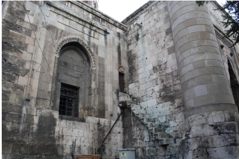
Fotoğraf: 7. Amasya Gök Medrese Türbenin Çatısına Çıkışı Sağlayan Merdivenler (F. Koçyiğit 2014)