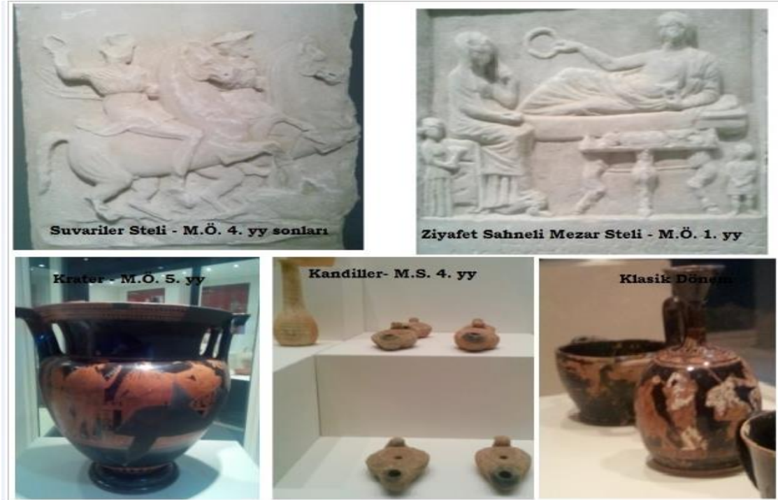
Resim 1: Tekirdağ çevresinde yapılan arkeolojik çalışmalar bu bölgede yerleşmelerin ve medeniyetlerin varlığını gösteren çeşitli dönemlere ait çok sayıda eser bulunmuştur.

Tekirdağ'ın ilçelerinden Malkara'da bulunan taş aletler bu çevrede insanların alt Paleolitik ve Orta Pleistosen dönemlerinde yaşam sürdürdüklerinin kanıtlarını göstermekte ve hayatın günümüzden 500.000 yıl öncesine kadar indiğini ortaya koymaktadır. Yine Tekirdağ-Şarköy bölgesinde bulunmuş olan üç adet taş alet atölyesi, bu çevrede cilalı taş üretilen bir üs olduğunu göstermektedir. Marmara Ereğlisi ilçesinin Toptepe Höyüğündeki buluntular ise Kalkolitik döneme kadar gitmektedir.