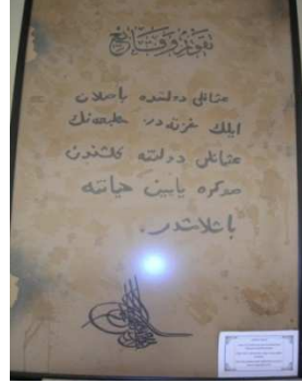
Resim 6. İlk Gazete "Takvim-i Vekayi"