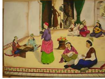
Resim 2. Haremde Bayan Eğitimi