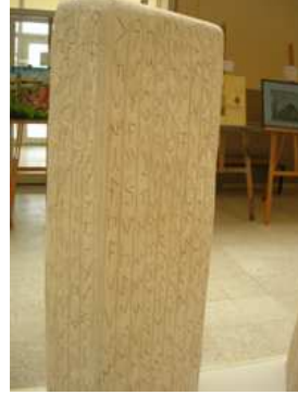
Resim 4. Orhun Kitabeleri Heykeli