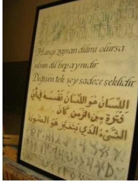
Resim 3. Geçmişten Geleceğe Alfabelerimiz