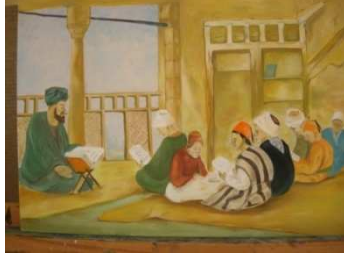
Resim 1. Sibyan Mektepleri

çalışmaya katılmış, 3 kişi ise katılmak istememiştir. Proje tabanlı öğrenmede ürün kadar süreçte önemlidir (Akpınar,2011). Dolayısıyla öğrencilerin çalışacakları konu seçiminde, dersin yürütücüsü ders içeriğini temel alarak öğrencileri yönlendirmiş, seçilen konularla ilgili ayrıntılı bir araştırma yaparak temalarını belirlemelerini istemiştir. Dönem sonunda toplamda 58 adet farklı görsel (resim, baskı, heykel, grafik) ortaya çıkmış, daha sonra bu eserler ile Eğitim fakültesi bünyesinde "Geçmişten Günümüze Türklerin Eğitim Anlayışlarına İlişkin Görsel İpuçları" isimli sergi açılmış, eserler sergide kronolojik bir sıra ile sergilenmiş ve her eserin üzerine kısa bir bilgi kartelası asılmıştır. Söz konusu sergi gerek akademisyenlerden, gerek öğrencilerden beğeni toplamıştır. Aşağıda Proje tabanlı öğretim kapsamında hazırlanan eserlerden bazı örnekler görülmektedir: