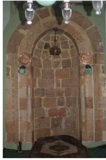
Fotoğraf13 :KayseriHunat Hatun Cami Mihrabı Fotoğraf 14 :K.Maraş Kazancı Cami Mihrabı