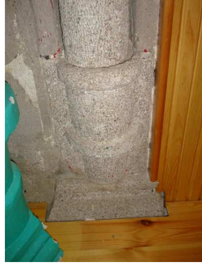
10 : Mihrabı Dış Yanlardan Yanlardan Sınırlayan Sütunce Kaideleri