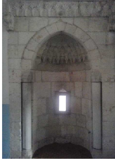
Fotoğraf15 :Kazancı Cami Mihrap Sütuncesi Fotoğraf 16 :Hatay Mahremiye Cami Mihrabı