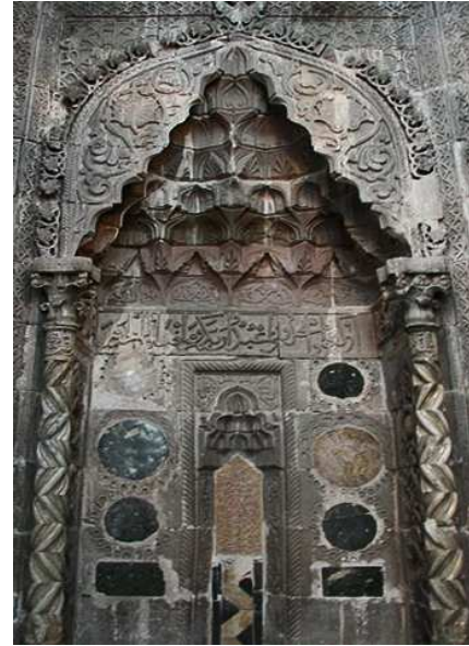
Başlığı Fotoğraf 12 : Develli Ulu Cami Mihrabı