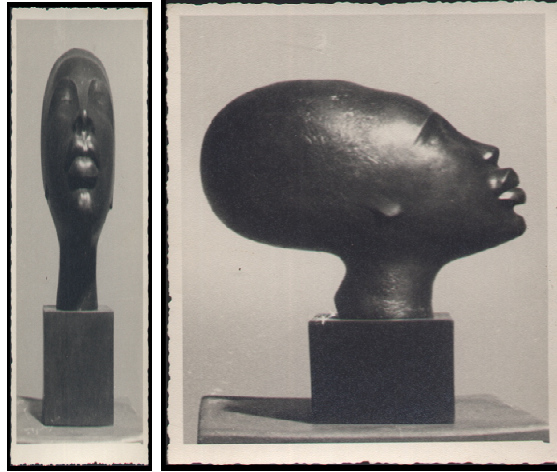
Resim 5: Zenci Başı/ Zerrin Bölükbaşı/MSGŞÜ İstanbul Resim Heykel Müzesi Koleksiyonu