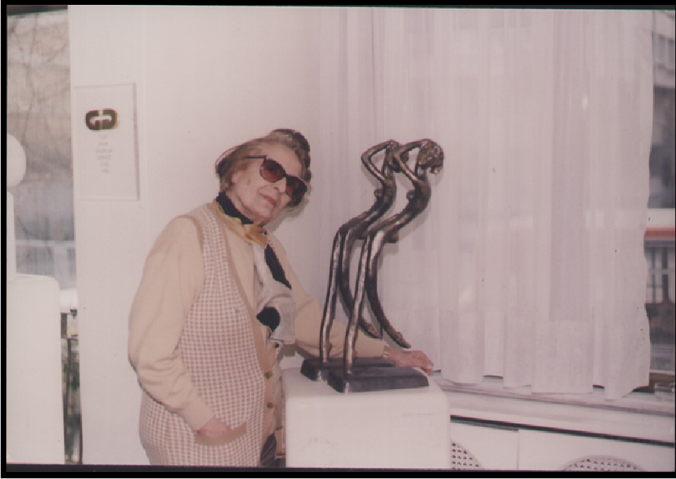
Resim 14: Zerrin Bölükbaşı'nın Heykel Sergisi'nden