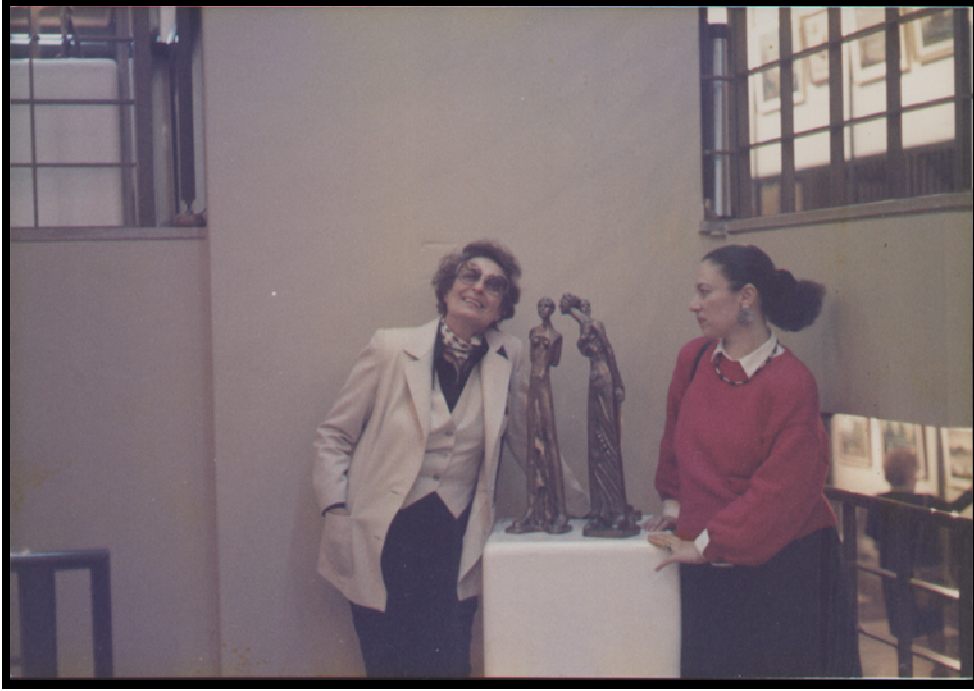
Resim 13: Zerrin Bölükbaşı'nın Heykel Sergisi'nden