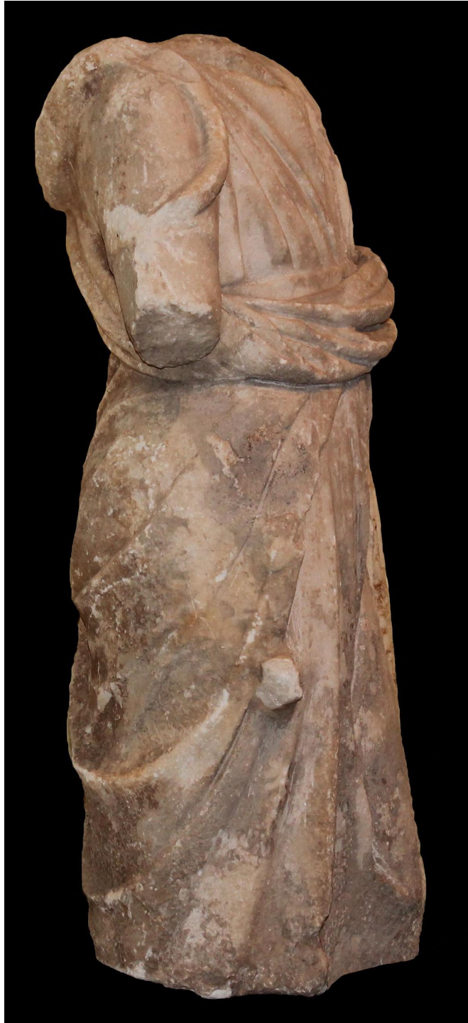
Res. 3 b: Hygieia