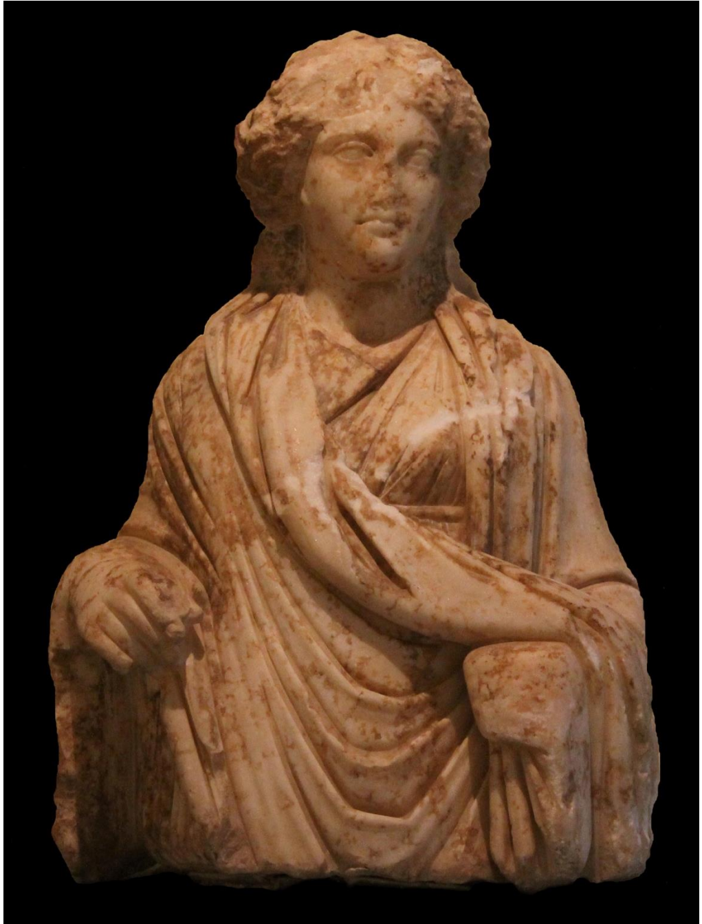
Res. 2 a: Hygieia