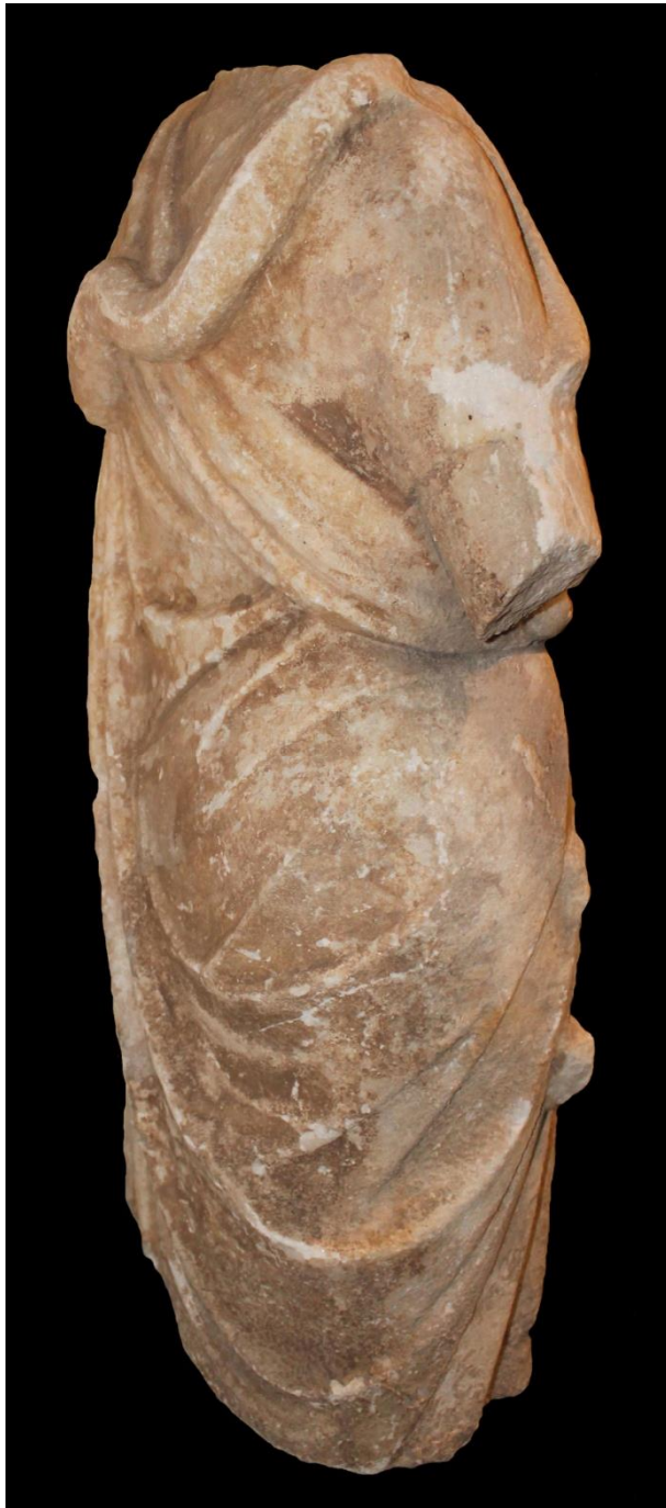
Res. 3 c: Hygieia