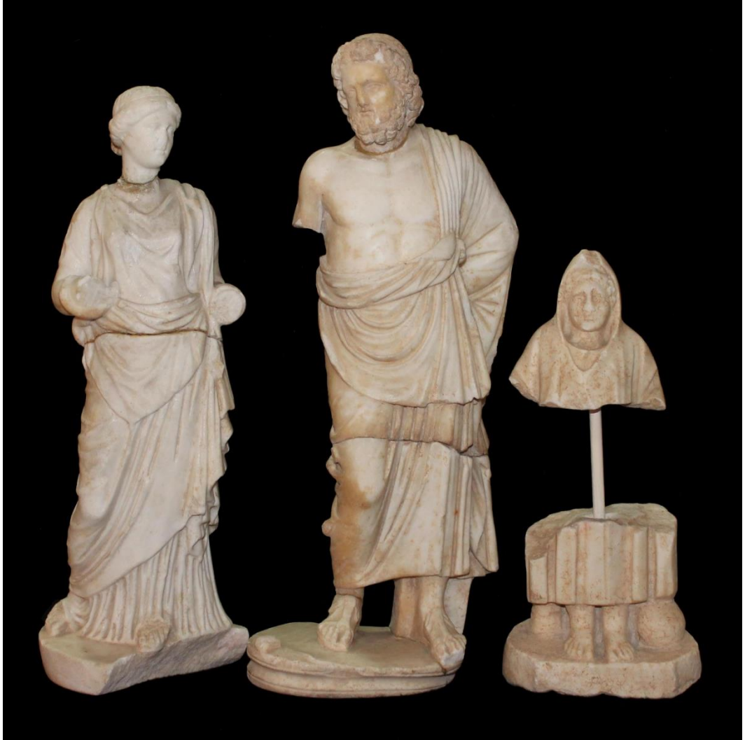
Res. 1: Hygieia, Asklepios ve Telesphoros