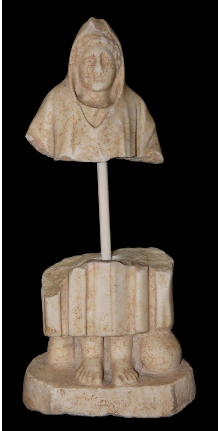
Res. 1 c: Telesphoros