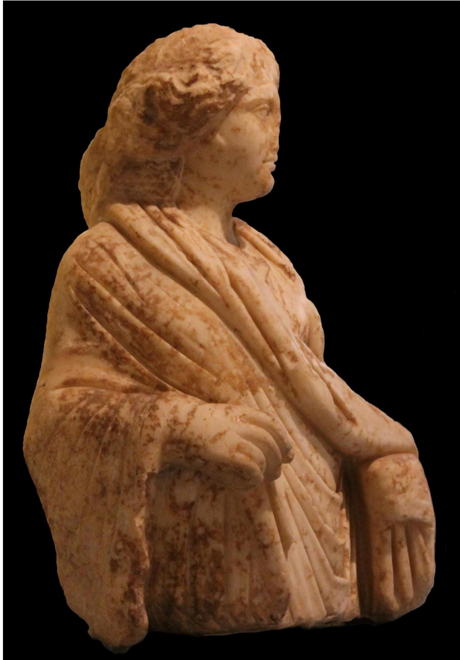
Res. 2 b: Hygieia