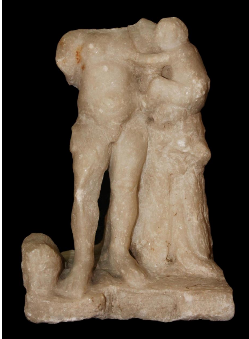
Res. 4: Hermes ve Dionysos ocu u