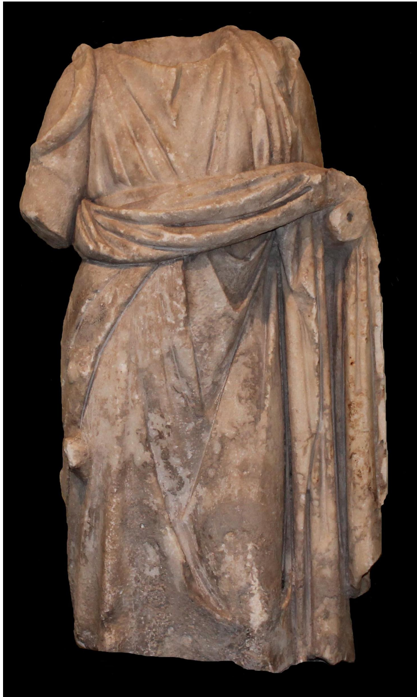
Res. 3 a: Hygieia