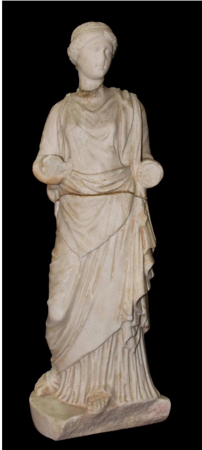
Res. 1 a: Hygieia