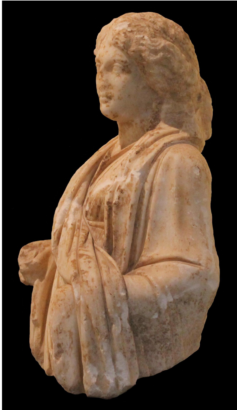
Res. 2 c: Hygieia