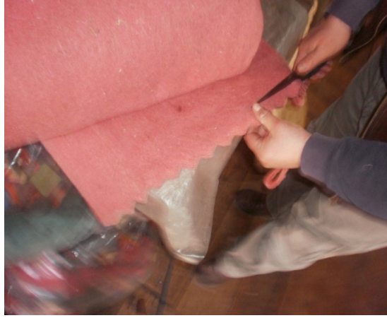
Şekil 16. Bastanın kesilmesi

Ürünün yapımında ilk olarak desene karar verilir ve keçe ustasının daha önce yapmış olduğu, iyice dövülmüş, "basta" ismi verilen renkli keçelerden desene göre düz veya tırtıklı parçalar (fitle) kesilir (Şekil 16).