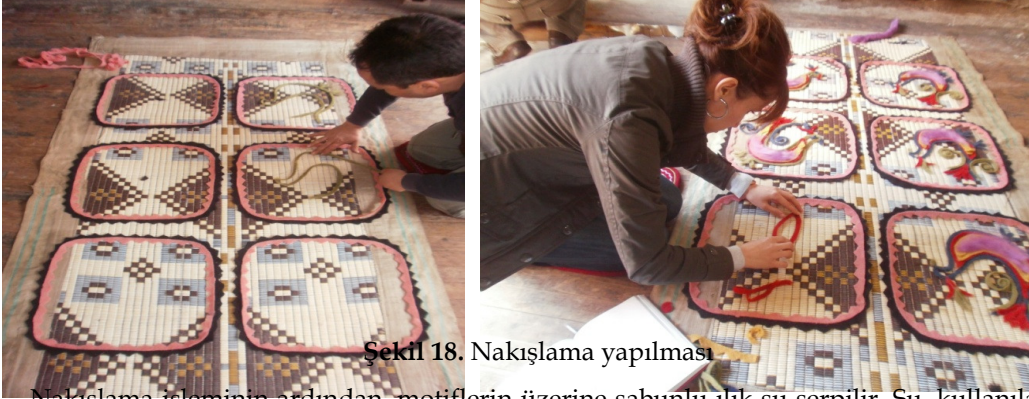
Şekil 18. Nakışlama yapılması

Nakışlama işleminin ardından, motiflerin üzerine sabunlu ılık su serpilir. Su, kullanılan keçe ve yünün kabarıklığını önler, üzerine atılacak yünlerden dolayı altta kalan motiflerin hasır üzerinde kaymasını engeller. Sabun ise motif ile üzerine atılacak yünün birbirine kaynaşmasını sağlar (Şekil 19).