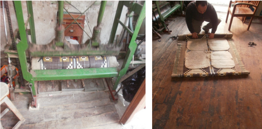
Şekil 30. Hasırın

Tersine çevrilen minderler hasırla birlikte sarılarak tekrar dövülür (Şekil 30).