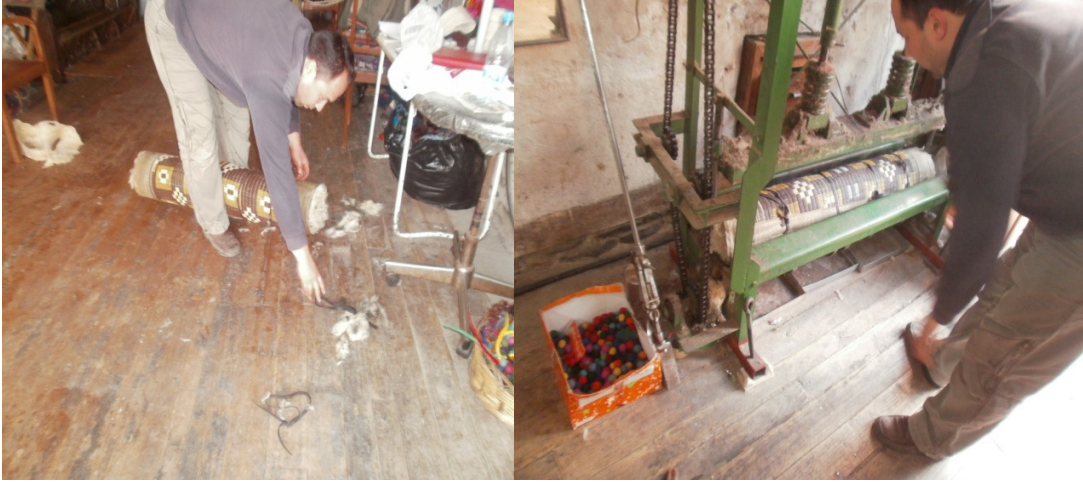
Şekil 26. Rulonun bağlanması ve dövülmesi

Hasır, rulo yapıldıktan sonra sıkıca bağlanır ve tepme makinesinde bir saat kadar dövülür (Şekil 26).