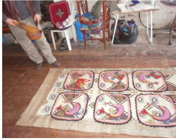
Şekil 19. Motiflerin üzerine su serpilmesi

Nakışlama işleminin ardından, motiflerin üzerine sabunlu ılık su serpilir. Su, kullanılan keçe ve yünün kabarıklığını önler, üzerine atılacak yünlerden dolayı altta kalan motiflerin hasır üzerinde kaymasını engeller. Sabun ise motif ile üzerine atılacak yünün birbirine kaynaşmasını sağlar (Şekil 19).