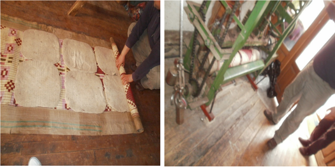
Şekil 33. Hasırın sarılması ve dövülmesi

Tam bir kare elde etmek için minderlerin yönü değiştirilir ve tersine çevrilerek hasıra yerleştirilir. Hasır, rulo şeklinde sarılarak son kez makinede dövülür (Şekil 33).