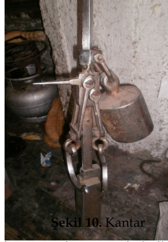
Şekil 10. Kantar

Küvet : Tepme veya boyama işleminden sonra keçenin yıkanmasında kullanılır (Şekil 11). Tepme keçecilikte pişirme işlemi hamamda veya atölye ortamında yapılabilir. Atölye ortamında yapılan pişirme işleminde gerekli olan sıcak suyu ve buharı temin üzere kullanılan kazandır.