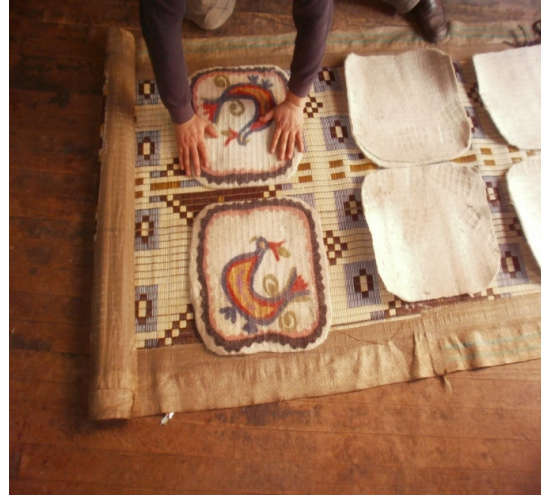
Şekil 31. Minderlerin el ile düzeltilmesi ve sarılması

Dövme esnasında sorun çıkmaması için hasır ara sıra kontrol edilir. Takıldığı yerlerde elle düzeltilerek düzgün dönmesi sağlanır. Hasır makineden alınıp açılarak, minderler tekrar düzeltilir