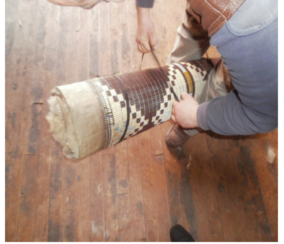
Şekil 21. Hasırın sarılması ve bağlanması

Hasırla birlikte sarılan yün, dövme makinesinde bir saat kadar dövülür. Bu süre hasır üzerine atılan yünün inceliği ya da kalınlığına göre değişebilmektedir. Dövülen yün açılır ve kısmen keçeleştiği görülür (Şekil 22).