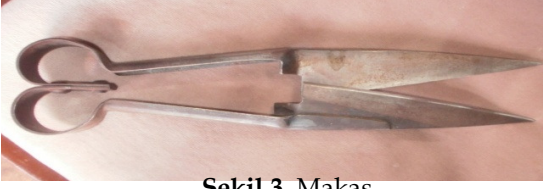
Şekil 3. Makas

Lastik ip: Rulo şeklinde sarılan hasırın tepme esnasında açılmaması için bağlanması amacıyla kullanılır (Şekil 4).