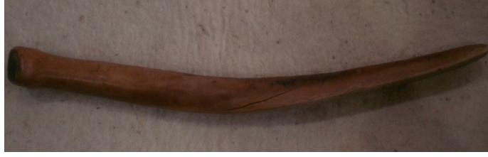
Şekil 8. Düzeltme sopası

Rende : Sabunun suda daha çabuk erimesi için küçük parçalara ayrılmasını sağlar ( Şekil 9 ).