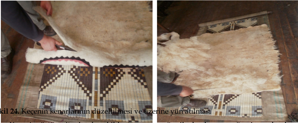
Şekil 24. Keçenin kenarlarının düzeltilmesi ve üzerine yün atılması

Birinci tepme işlemi sonunda dağınık ve saçaklı durumda olan keçenin kenarları kesilerek düzeltilir. Düzeltmesi yapılan keçenin üzerine kalınlık oluşturmak için tekrar yün atılır (Şekil 24).