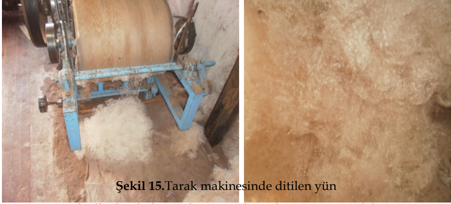
Şekil 15. Tarak makinesinde ditilen yün

Ditme işlemi elle yapıldığı gibi, basit bir ditme makinesi ile de yapılır. Ditilen yün hallaç yayı ya da tarak makinesi ile liflerinden ayrılarak seyretilir (Şekil 15).