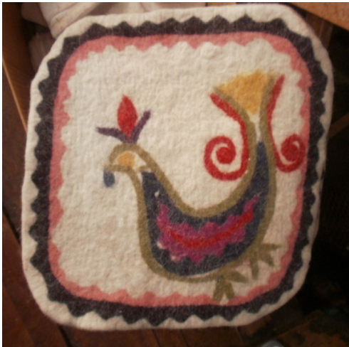
Minderlerin yıkanması ve kurutulması