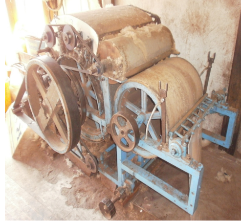
Şekil 13. Yün Tarama Makinesi