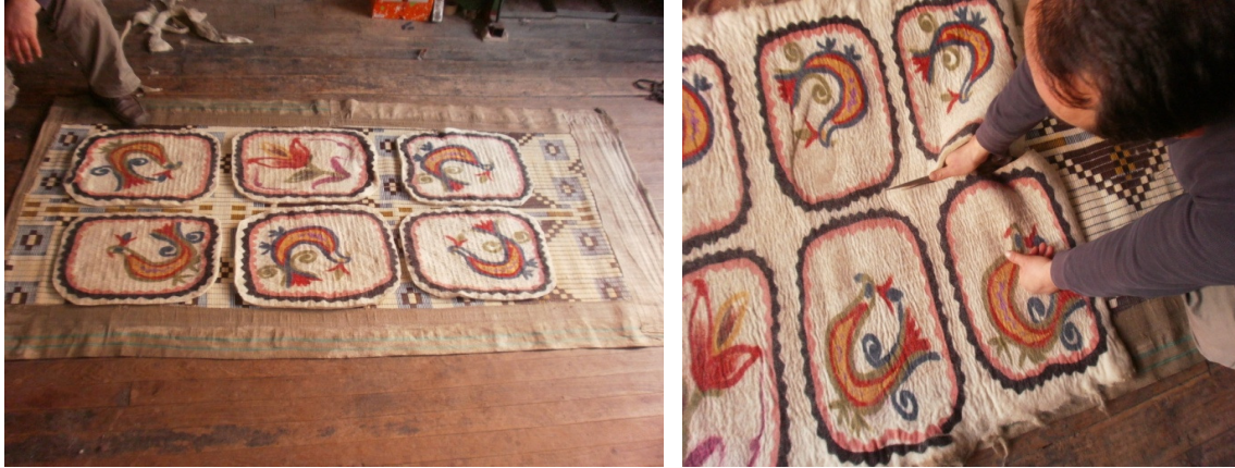
Şekil 27. Motiflerin kesilerek birbirinden ayrılması

Hasır tekrar açılır ve keçe ile üzerine atılan yün birbirine iyice geçmiştir. Motifler kesilerek birbirinden ayrılır ve elle tek tek düzeltilir. Elde edilen parçalar (minderler) tekrar hasırın üzerine yerleştirilir. (Şekil 27).