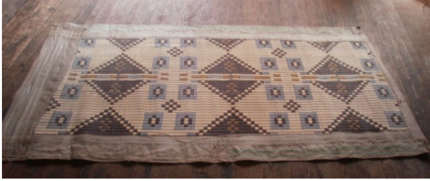
Şekil 1: Hasır Kalıp

Hasır (Kalıp) : Üzerine atılan yünün rulo şeklinde sarılmasında kullanılan plastik halıdır. Boyutu yapılacak keçeye göre değişmektedir ( Şekil 1).