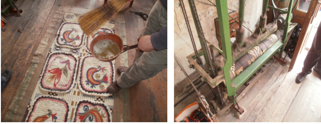
Şekil 28. Sabunlu su serpilmesi ve dövülmesi

Tepme makinesinden alınan hasır açılır. Minderler tersine çevrilir ve tekrar sabunlu su serpilir (Şekil 29).