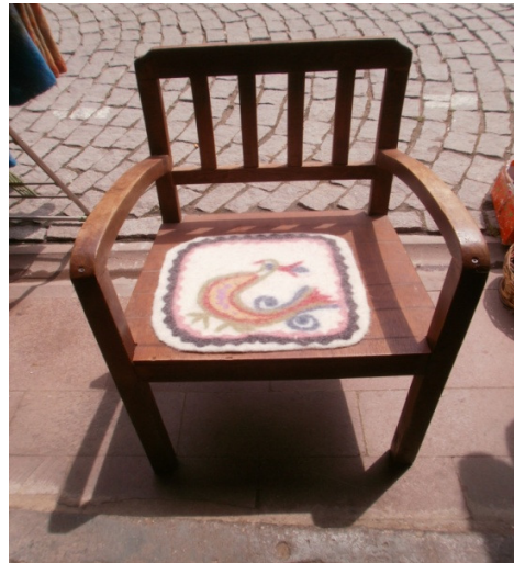
Şekil 36. Bitmiş ürün