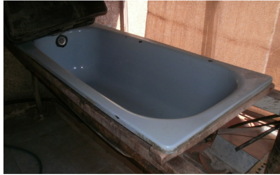
Şekil 11. Küvet

Küvet : Tepme veya boyama işleminden sonra keçenin yıkanmasında kullanılır (Şekil 11). Tepme keçecilikte pişirme işlemi hamamda veya atölye ortamında yapılabilir. Atölye ortamında yapılan pişirme işleminde gerekli olan sıcak suyu ve buharı temin üzere kullanılan kazandır.