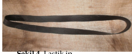
Şekil 4. Lastik ip

Süpürge: Süpürge otundan yapılan ve yünün ıslatılması için kullanılan bir malzemedir.