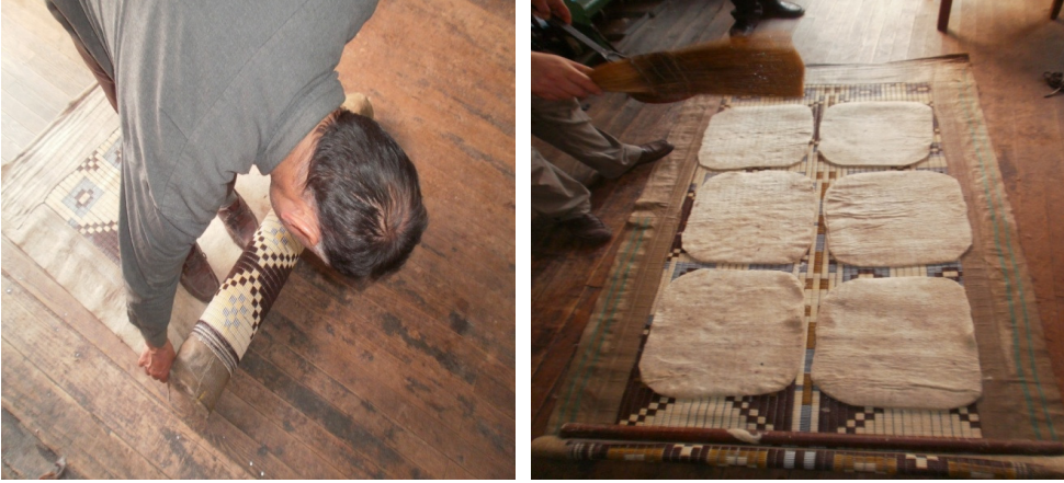
Şekil 29. Hasırın açılması ve minderlerin tersine çevrilerek üzerine sabunlu su serpilmesi

Tepme makinesinden alınan hasır açılır. Minderler tersine çevrilir ve tekrar sabunlu su serpilir (Şekil 29).