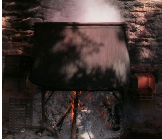
Şekil 2. Kazanlar

Makas: Keçenin kesiminde kullanılan özel bir araçtır ( Şekil 3).