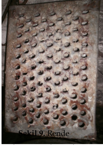
Şekil 9. Rende

Kantar : Yünün tartılmasında kullanılmaktadır ( Şekil 10 ).