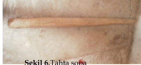
Şekil 6. Tahta sopa

Şablon: Hasırın üzerine yapılan nakışlamanın simetrik olmasını sağlayan, motife göre değişik biçimleri bulunan, kontrplaktan yapılmış bir araçtır (Şekil 7).