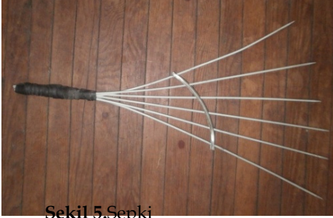
Şekil 5. Sepki

Tahta Sopa: Üzerinde yün olan hasırın rulo şeklinde, düzgün bir biçimde sarılması için kullanılan, ağaçtan yapılmış oklavaya benzer bir malzemedir (Şekil 6).