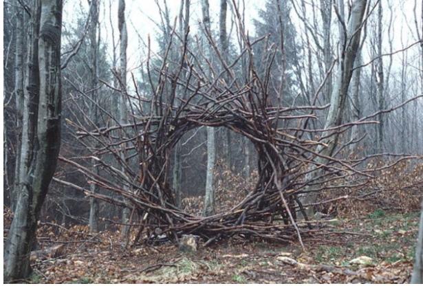
Resim 5: Woven Branch Circular Arch, 1986, Dumfrireshire