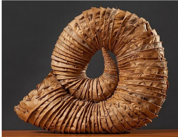
Resim 3: Leaf Horn, 1996