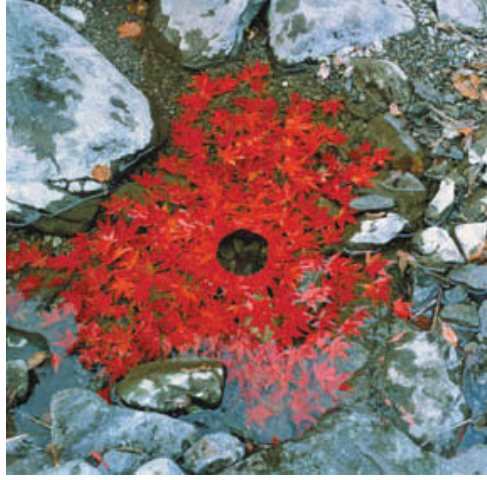
Resim 8: Japanese Maple Leaves, 1987, Ouchiyama-Mura, Japan

Sanatçının pekçok çalışmasında karşılaşılan bir diğer form ise dairedir. Sonsuzluk, ebedilik, döngü, zaman, yeniden doğum gibi çağrışımları hatırlatan ve ilkel bir form olan daireyi, Land Art sanatçıları çalışmalarının genelinde kullanmışlardır. Andy Goldsworthy'nin de daireden çıkış yaparak oluşturduğu pekçok çalışması vardır. Daire; organik formları, zamanı, değişimi, döngüyü, mevsimleri, yıldızları, astronomiyi, kökeni, başlangıcı ve bazı dinlerde kadınsılığı ve tanrıçayı çağrıştırmaktadır. Bu yüzden heykeltraşlar ve yeryüzü sanatçıları için çalışmalarında yer verdikleri oldukça önemli bir formdur.