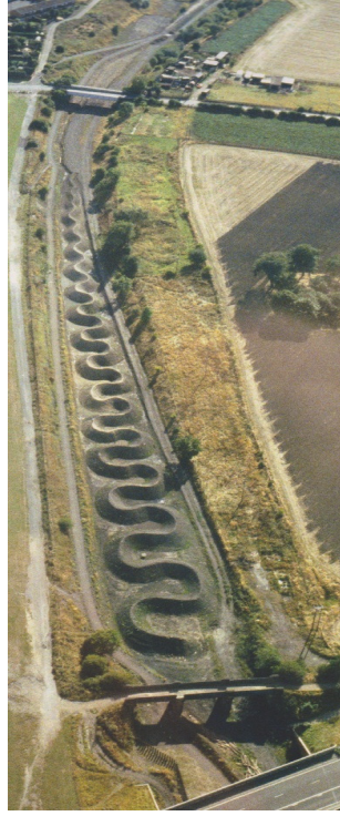
Resim 6: Lambton Earthwork, 1988, İngiltere

Bölgesi'nin ortaçağ efsanesinin bir yorumu gibi görülmüştür. Bu efsaneye göre Lambton'un veliahtı tarafından öldürülene kadar dev yılan ya da ejderha bu bölgedeki insanları ve hayvanları yemiştir. Sanatçının eserinin bu efsaneye yakın biçimde gerçekleşmesi, geçmiş izlerin gösterimi gibi yorumlansa da sanatçı bunu kabul etmez. Goldsworthy, "Brancusi'nin kuş ya da balık yapmadığı gibi aynı şekilde bende yılan yapmıyorum" demektedir (Friedman, 2000: 10).