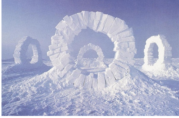
Resim 4: Touching North, 1989, North Pole

üreteceği çalışmalarının ana kaynağıdır. Aynı zamanda bu kaynağı keşfederken bulunduğu yeri ve kendini yeniden tanır. Goldsworthy'in pekçok çalışması form ve malzeme olarak birbiri ile ilişkilidir. "Touching North"ta (1989) (Resim 4) buz ve karla oluşturduğu biçimi, çeşitli malzemelerle örneğin taşlarla, dallarla yeniden oluşturur (Resim 5). Ancak buzlarla, taşlarla ve dallarla bir biçimi oluştururken yaşanan deneyimler ve endişeler farklıdır. Zaman ve iklim koşulları çalışmaların sürecini etkileyecektir. Yer, zaman ve değişim; bu üçlü sanatçının değişmezleridir ve Goldsworthy'nin sanatının yapı taşlarıdır.