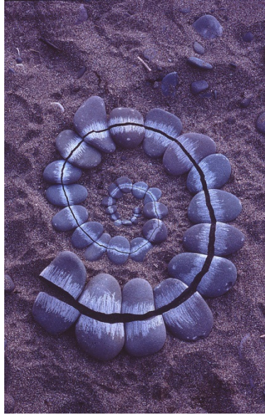
Resim 1: Cracked Rock Spiral, 1985, Scotland

Sanatçının ilgilendiği konular form ve malzeme olarak kategorize edildiği zaman, form olarak; kemerler, toplar, kutular, taş yığınları, daireler, sütunlar, koniler, çatlaklar, eğriler, kenarlar, boşluklar, delikler, boynuzlar, çizgiler, yamalar, kazıklar, kıvrımlar, gölgeler, küreler, spiraller, helezonlar, sıçramalar, kareler, yığınlar, izler, hendekler, yollar ve malzeme olarak ise; ağaç kabukları, çim, eğreltiotları, dallar, çiçekler, tüyler, yapraklar, toprak, yer tezeği, kil, çamur, kayalar, kum, deniz yosunu, buz, don, buz sarkıtları, yağmur, gökkuşağı, yansımalar, ışık, renkler, beden izleri şeklinde oluşturduğu görülmektedir.