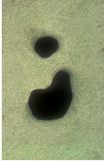
Resim 10: First Hole, 1977, Southport, Cheshire

Siyah delik ya da boşluğun bu maskülen korkusu Andy Goldsworthy'nin ifadelerinde de görülebilir. "Derin bir deliğin içine bakmak benim sınırlarımı bozar, cesaretimi kırar" diye yazan sanatçının heykellerinin siyah delikleri; doğanın içindeki güvenilmezliğe, kırılğan ve utangaç enerjiye açılmaktadır. Goldsworthy'nin delikleri büyüleyicidir. Sanatçı, "Deliklerin baştan çıkarıcılığından hoşlanırım" diye söyler. Goldsworthy, ayrıca doğanın gücünden hem korktuğunu hem de ona hayran kaldığını ekler (Malpas, 2007: 213).