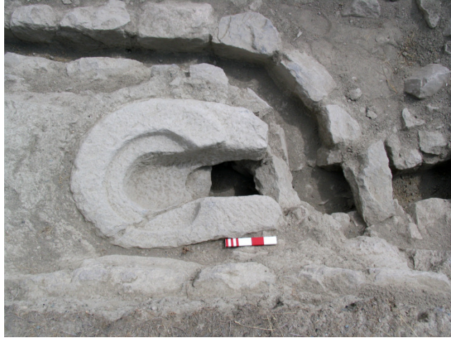
Resim 6- Altıntepe Kalesindeki Urartu Dönemine ait Tuvalet