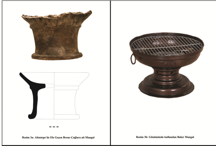
Resim 3 a-b