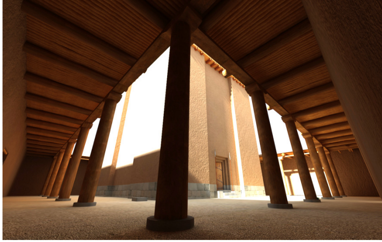
Resim 11- Tapınak avlusundaki revaklı bölüm yeniden kurma denemesi