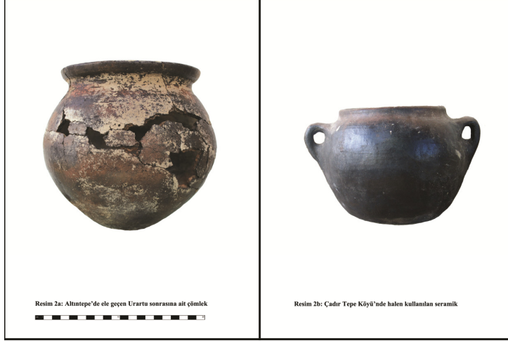
Resim 2 a-b