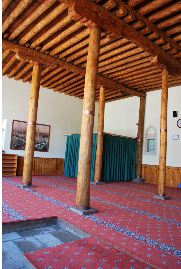
Resim 12- Kemah Gülabi bey camii son cemaat yeri