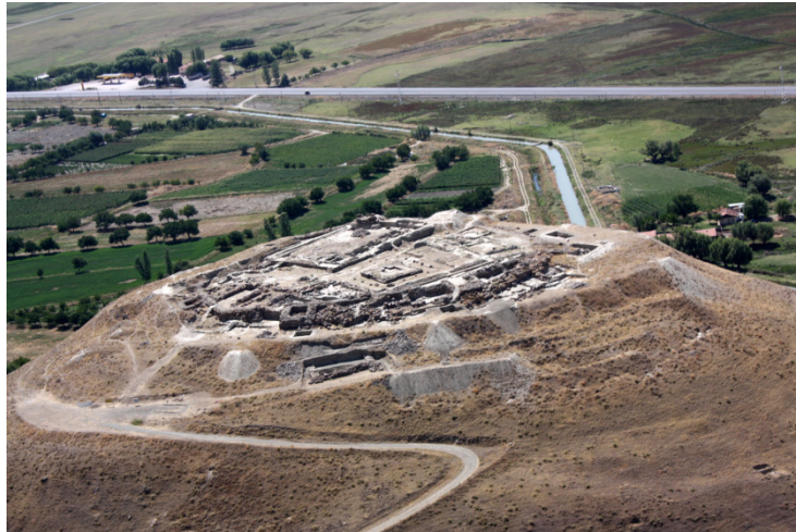
Resim 1-Altintepe Hava Fotoğrafi