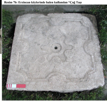
Resim 7b: Erzincan köylerinde halen kullanılan "Çağ Taşı"