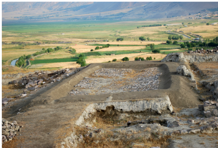
Resim 4- Altıntepe Urartu Döenmine Ait Havuz