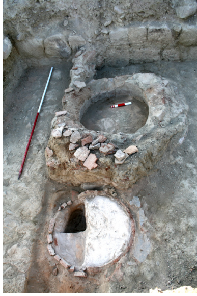
Resim 9- Altıntepe Kalesindeki Urartu Dönemine ait Tandırlar