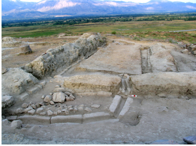
Resim 8- Altıntepe Urartu dönemine ait 4 Nolu oda ve niş içindeki lavabo-pisuvar