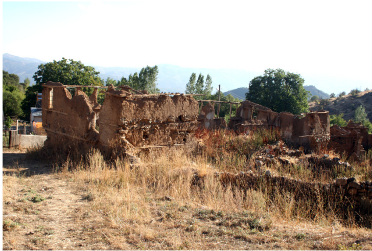
Resim 10- Erzincan Köylerinde yakın zamana kadar kullanılan kerpiç evler