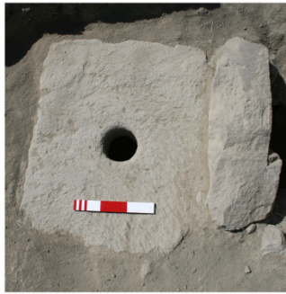
Resim 7a: Altıntepe'deki Urartu Dönemine ait "Çağ/Banyo Taşı"