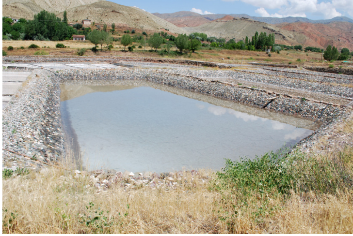
Resim 5- Kemah'daki Tuzla havuzu