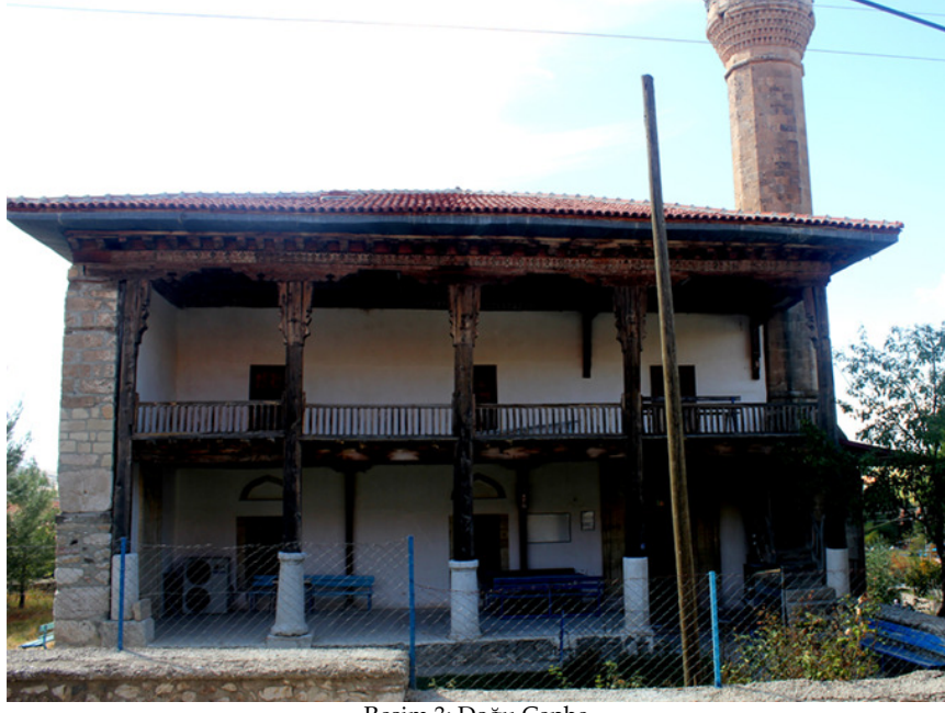
Resim 3: Doğu Cephe