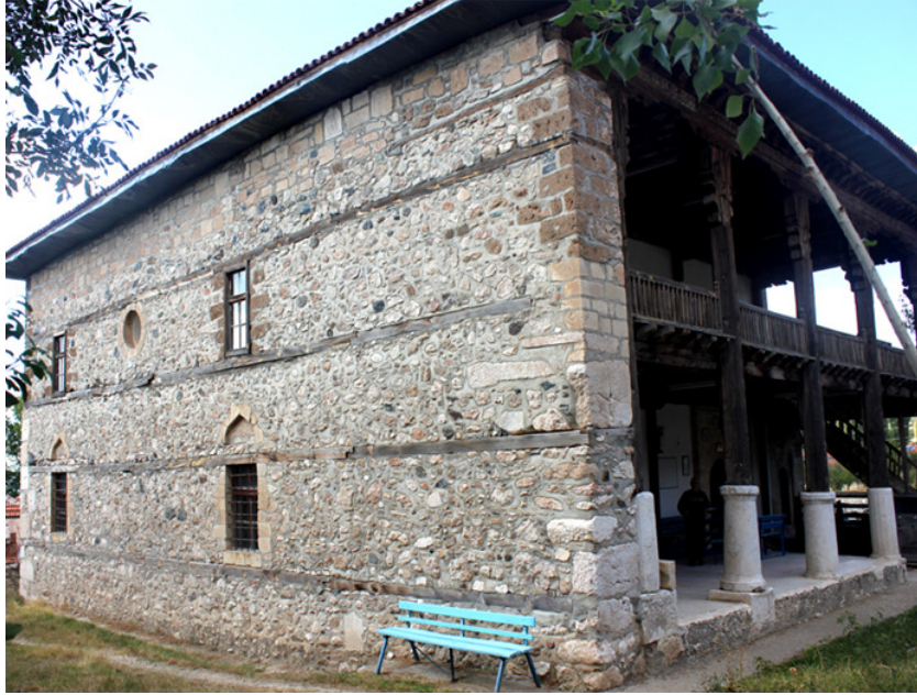
Resim 6: Güneydoğu Cephe