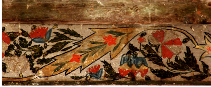
Resim 21: Kadınlar Mahfili 2 Numaralı Bordür