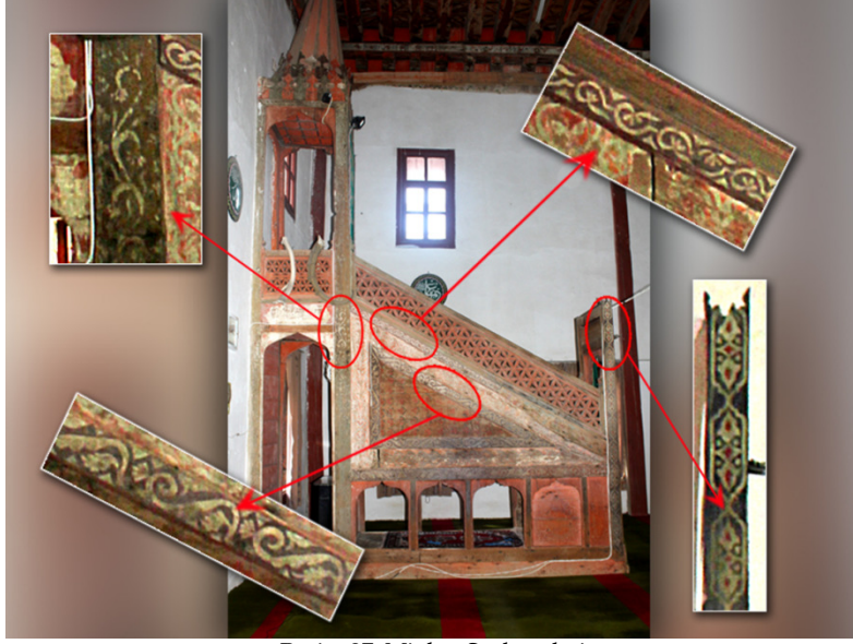
Resim 27: Minber Süslemeleri