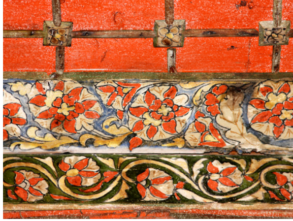
Resim 22:Kadınlar Mahfili 3 ve 4 Numaralı Bordür