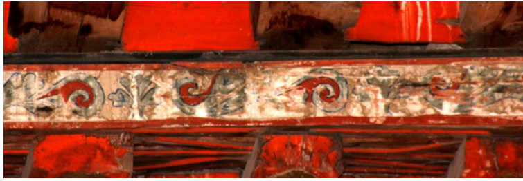
Resim 17: Batı Sahın 2 Numaralı Bordür