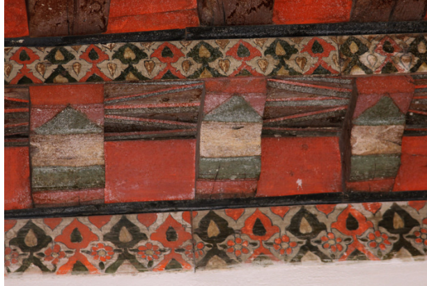
Resim 18: Doğu Sahın 1 ve 2 Numaralı Bordür