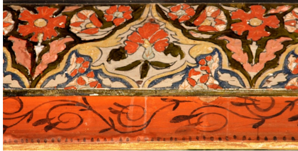
Resim 13: Orta Sahın 1 ve 2 Numaralı Bordür