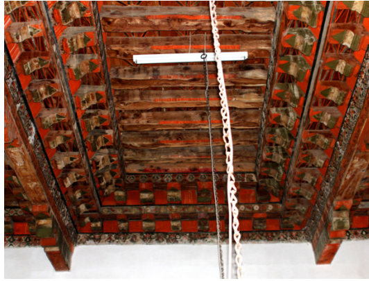
Resim 12: Orta Sahın