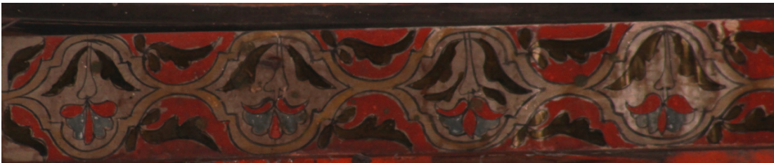
Resim 15: Orta Sahın 4 Numaralı Bordür