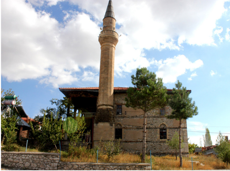
Resim 4: Kuzey Cephe