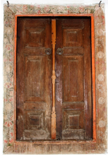
Resim 25: Pencere Süslemesi