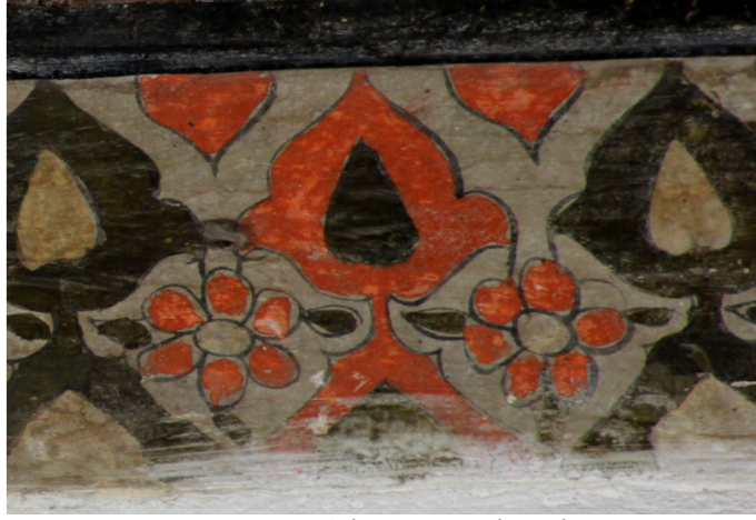
Resim 16: Batı Sahın 1 Numaralı Bordür