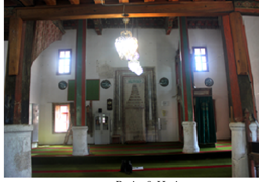
Resim 8: Harim