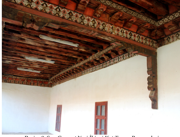
Resim 9: Son Cemaat Yeri İkinci Kat Tavan Bezemeleri