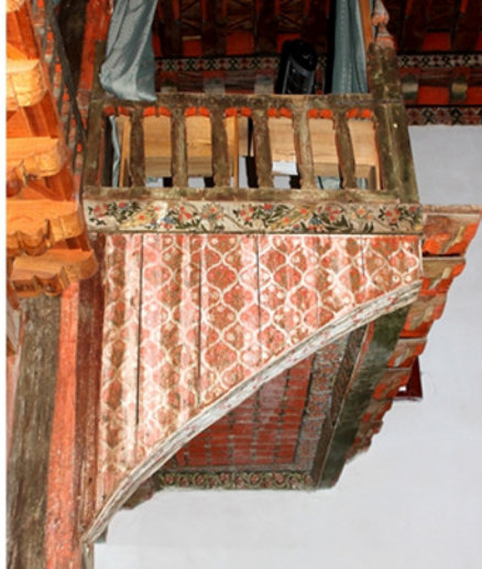
Resim 23:Kadınlar Mahfili-Konsolun Batı Yan Yüzeyi