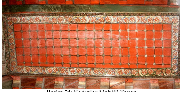
Resim 24: Kadınlar Mahfili Tavan