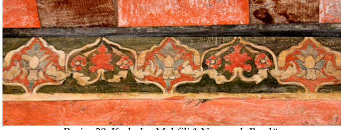
Resim 20: Kadınlar Mahfili 1 Numaralı Bordür