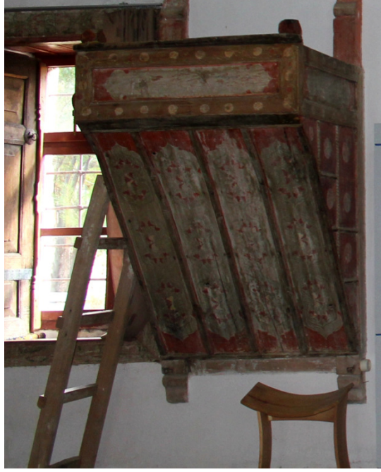
Resim 28: Vaiz Kürsüsü