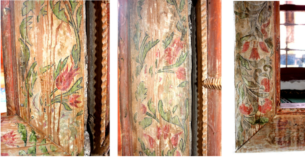
Resim 26: Pencere Süsleme Detayları