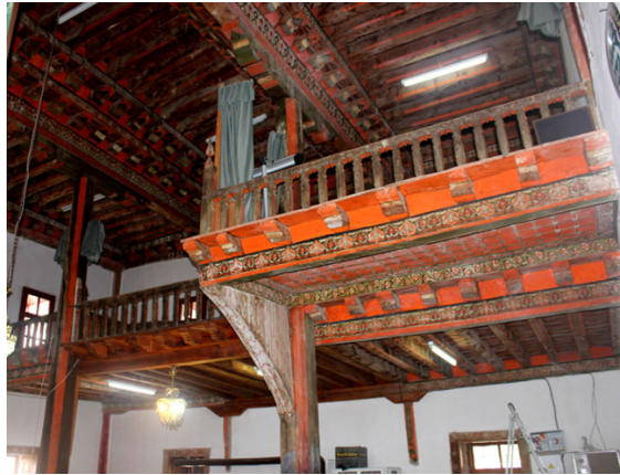
Resim 19: Kadınlar Mahfili