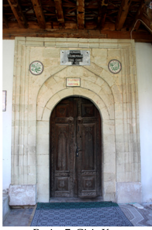
Resim 7: Giriş Kapısı