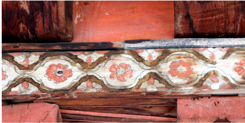
Resim 10: Son Cemaat Yeri 1 Numaralı Bordür