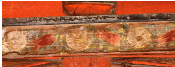
Resim 14: Orta Sahın 3 Numaralı Bordür