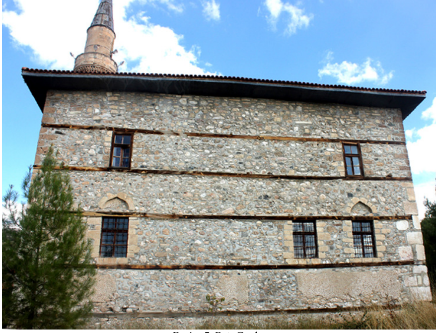
Resim 5: Batı Cephe