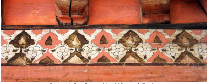
Resim 11: Son Cemaat Yeri 2 Numaralı Bordür