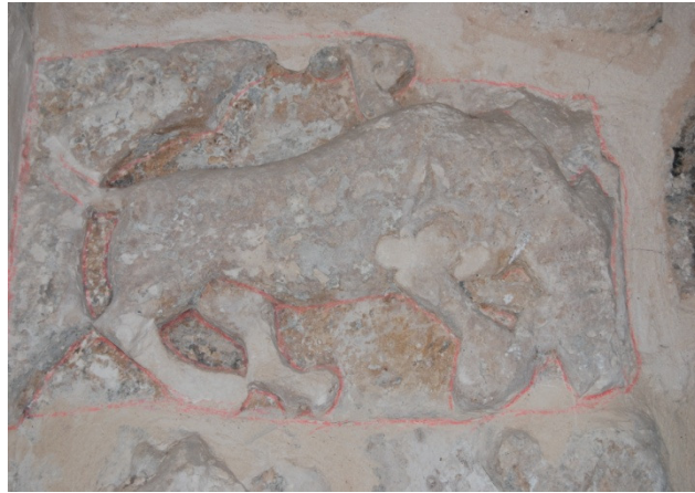
Resim 4. Soyunmalık bölümüne geçit veren kapının solunda yer alan aslan figürü