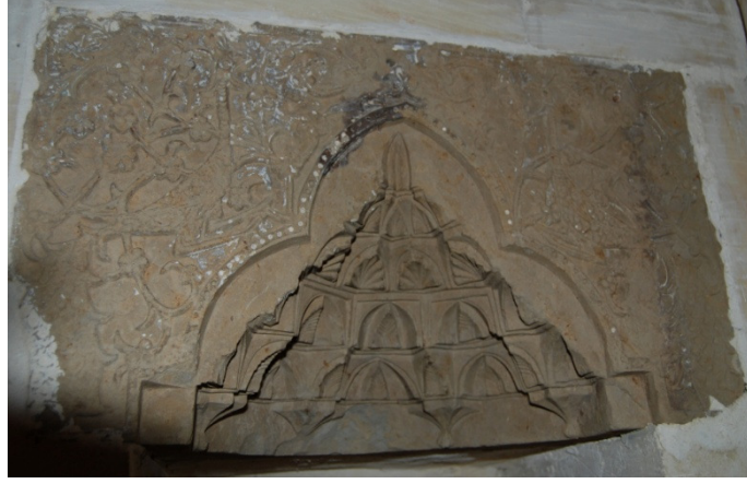
Resim 11. Mardin Müzesi'nde bulunan tavus kuşu figürlü mukarnash niş