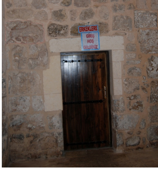
Resim 3. Soyunmalık bölümüne geçit veren giriş kapısı ve kapının sol üst köşesinde yer alan taş plastik aslan figürler