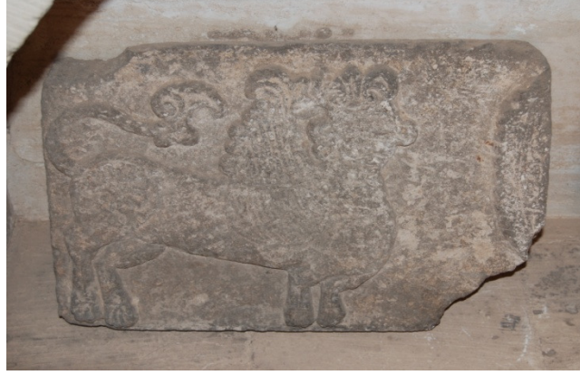
Resim 7. Mardin Müzesi'nde bulunan aslan kabartması