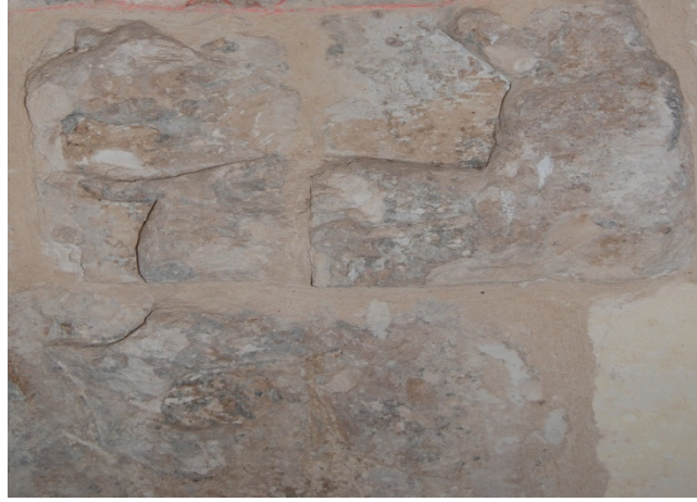
Resim 6. Soyunmalık bölümüne geçit veren girişin solunda ve alt kısımda yer alan aslan figürü