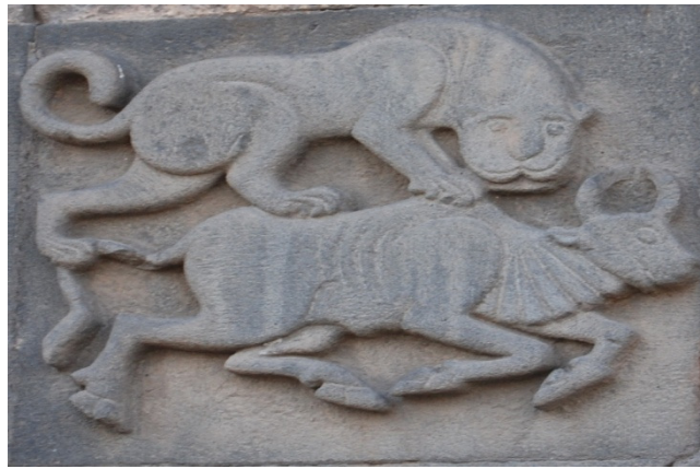
Resim 5. Diyarbakır Ulu Camii doğu girişinde yer alan aslan-boğa mücadelesi