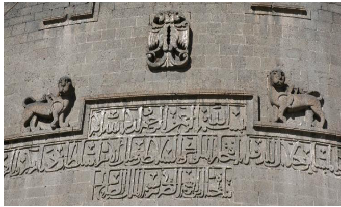
Resim 8. Diyarbakır dışkale Yedikardeşler Burcu'nda yer alan aslan figürleri