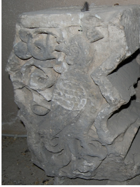
Resim 9. Hamamın külhan bölümünde yer alan üzerinde tavus kuşu figürünün yer aldığı 1. taş