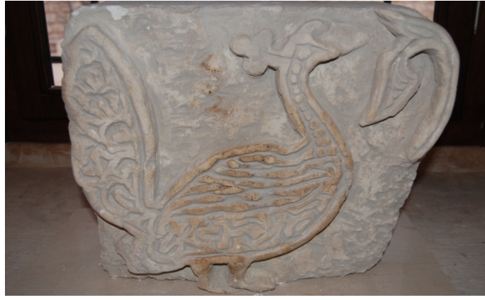
Resim 12. Mardin Sabancı Müzesi'nde bulunan tavus kuşu bezemeli taş