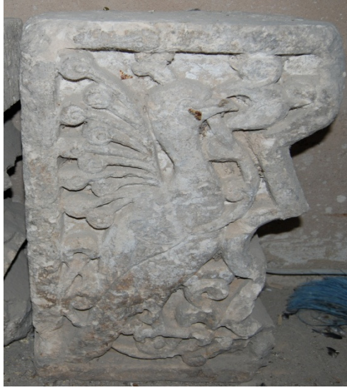
Resim 10. Hamamın külhan bölümünde yer alan üzerinde tavus kuşu figürünün yer aldığı 2. taş