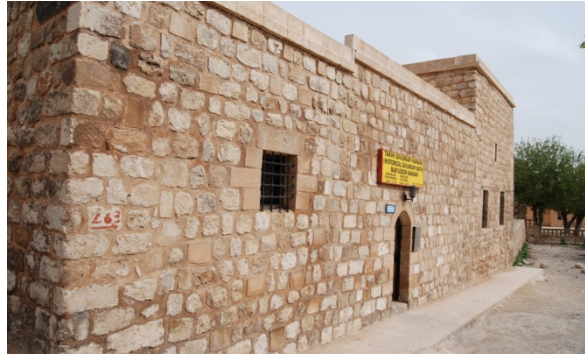
Resim 1. Mardin Savurkapı (Sitti Radviye) Hamamı'nın güney cepheden görünümü