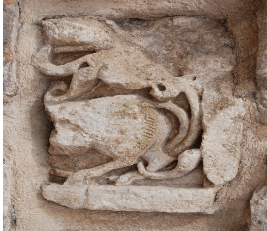
Resim 2. Hamamın kuşatma duvarında aslan figürü