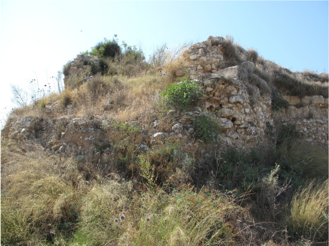
Resim 12: 5. Kısım Güneydoğudan Görünüm.