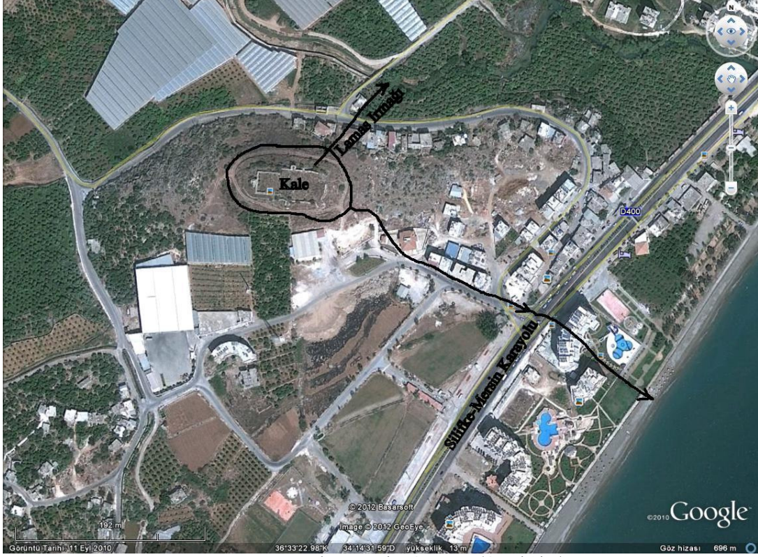
Resim 1:Lamas Kalesi Havadan Görünüm