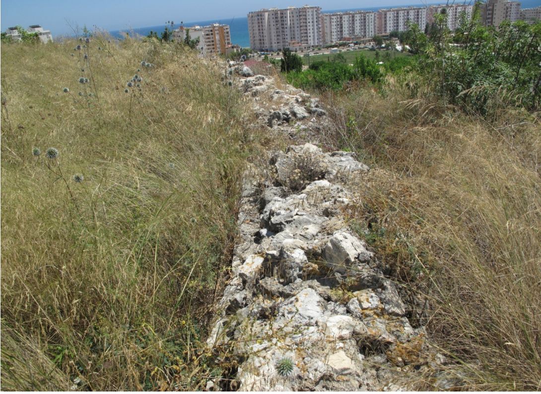
Resim 7: 2. Kısım Sur Duvarı.