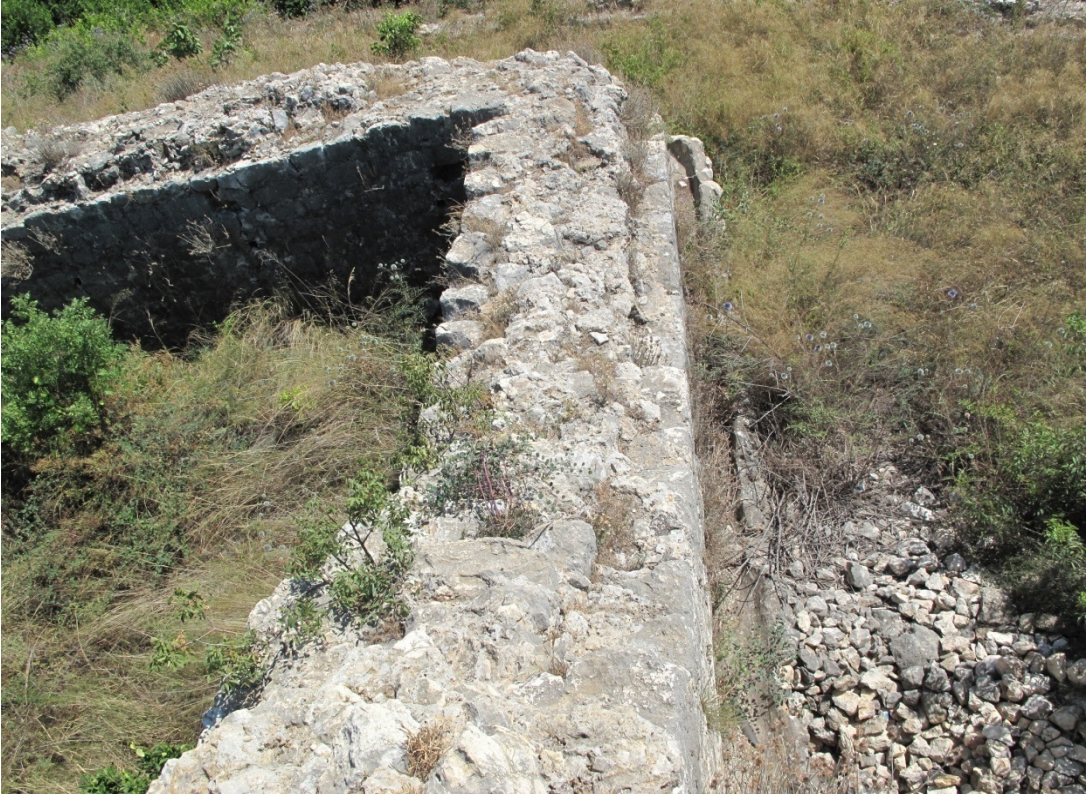
Resim 5: Batı Surları ve Dış Tarafındaki Su Kanalı.