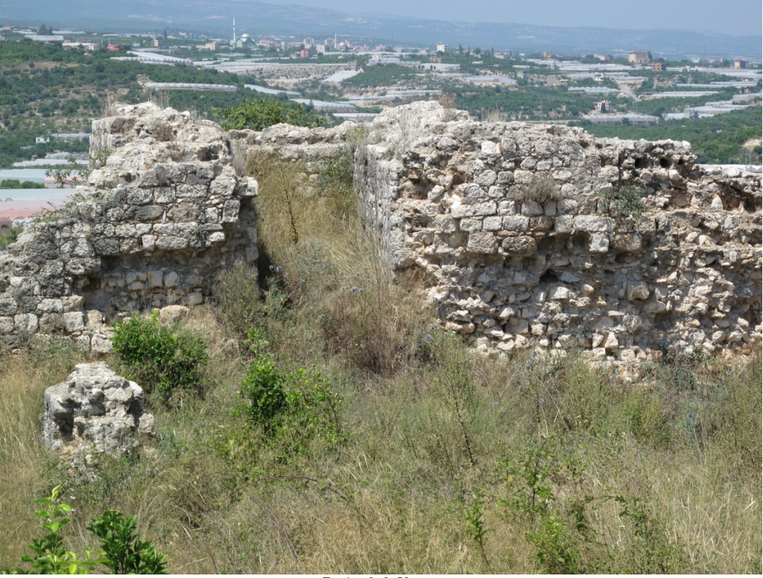
Resim 9: 3. Kısım.