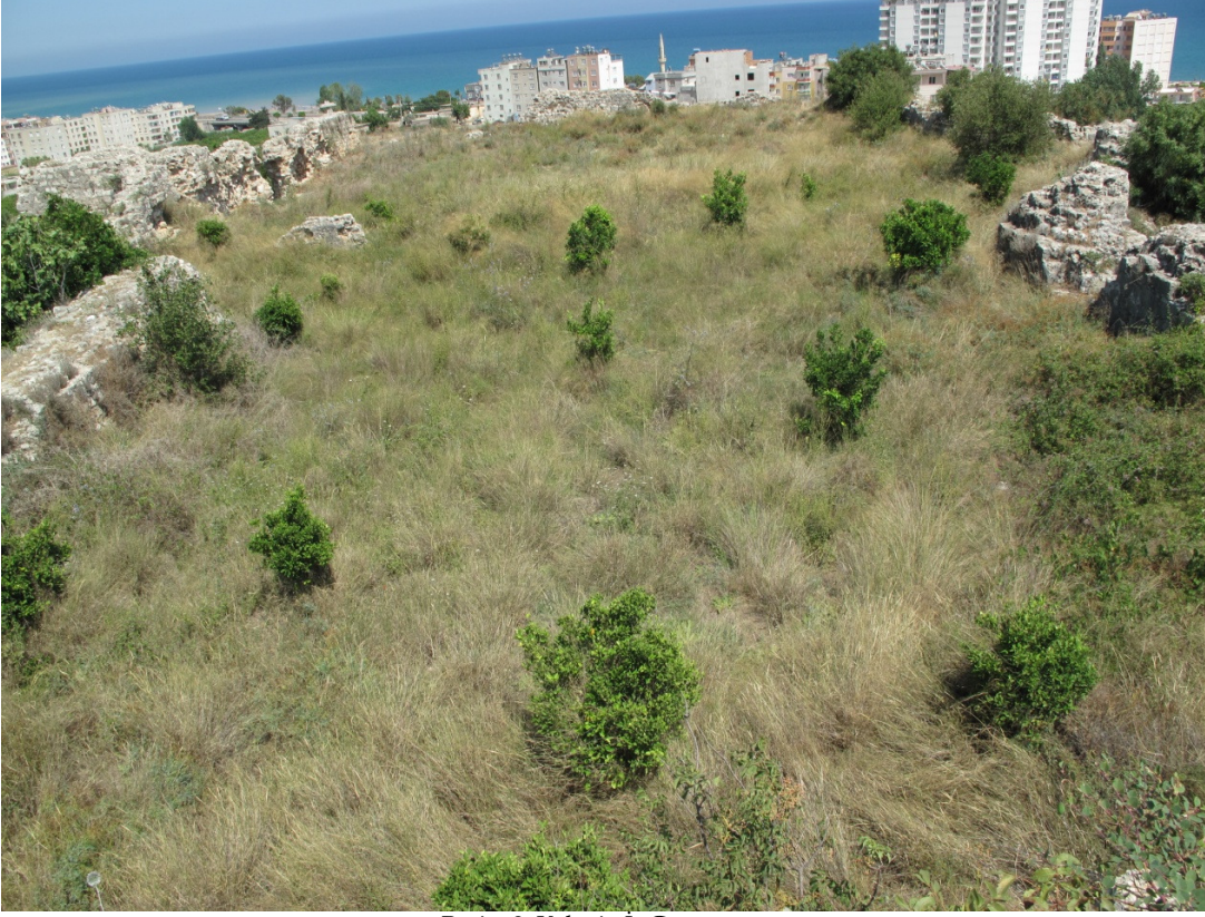
Resim 3: Kalenin İ Görünümü