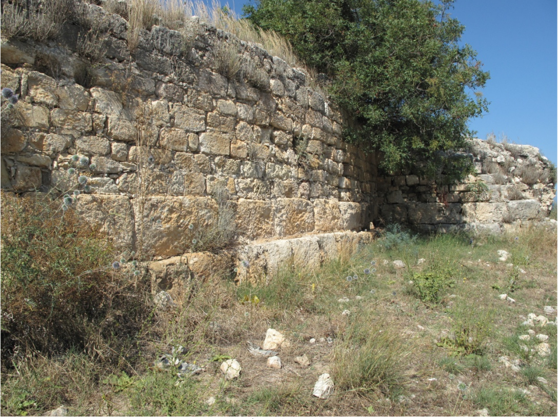
Resim 13: Kalenin Güney Sur Duvarı.