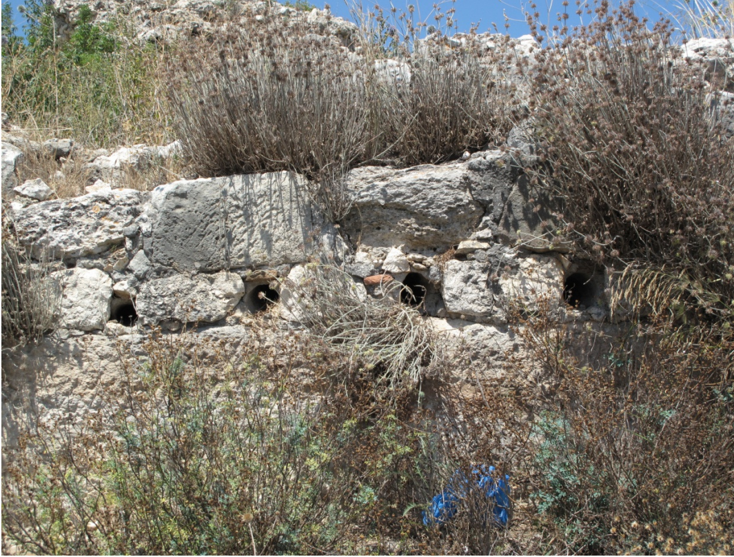
Resim 8:Güney Duvarda Bulunan Künkler.