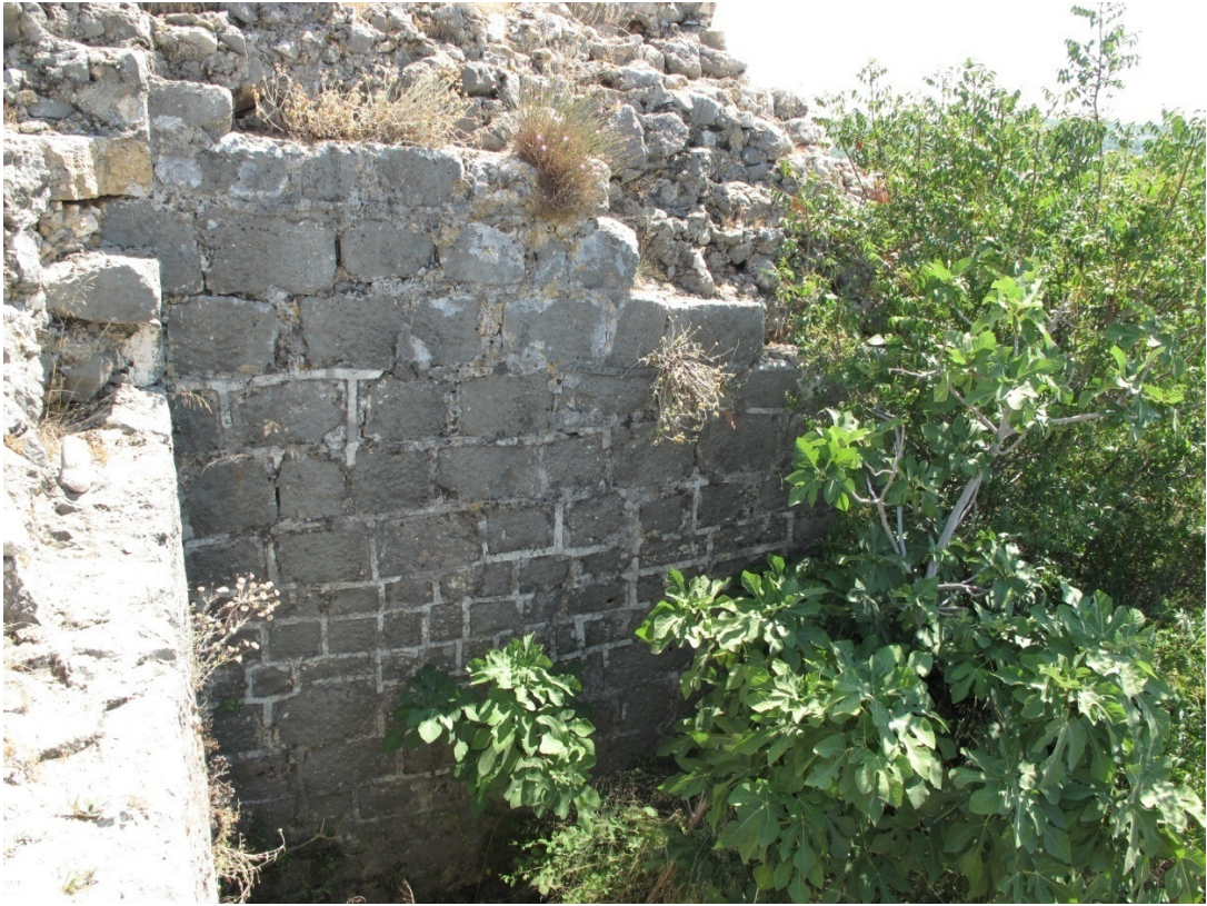
Resim 6: 1. Kısım.