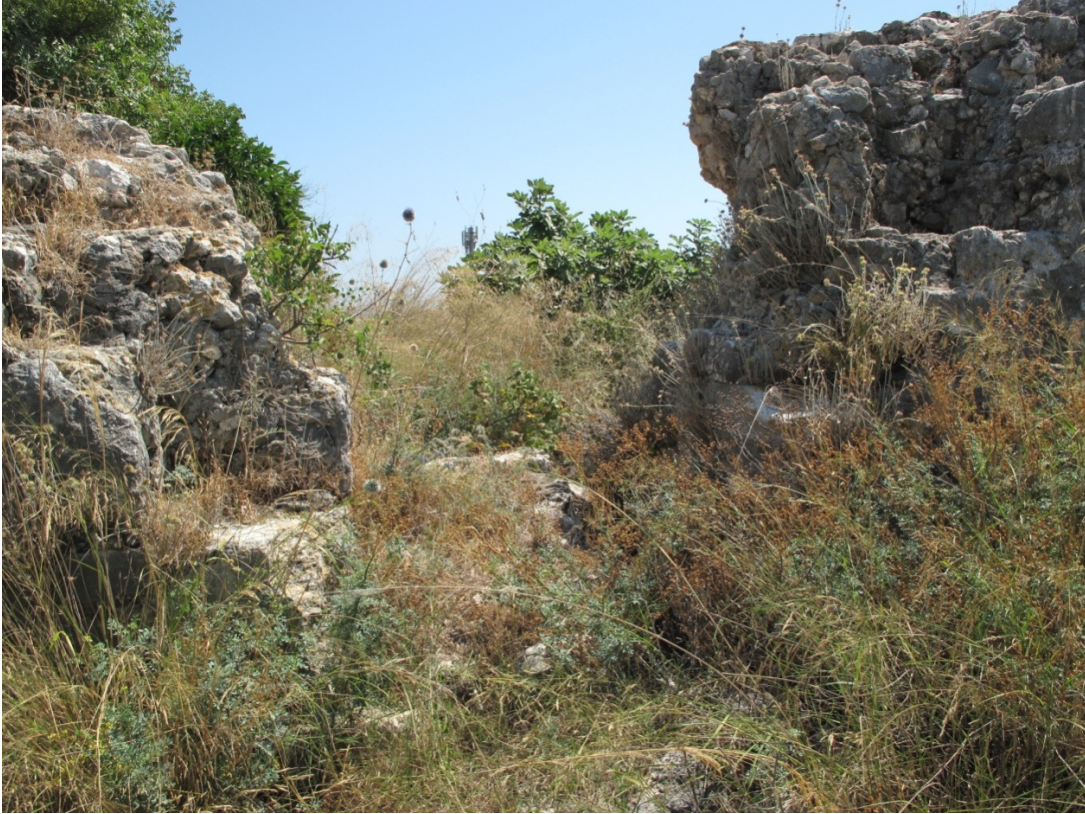
Resim 4: Giriş Kapısı.