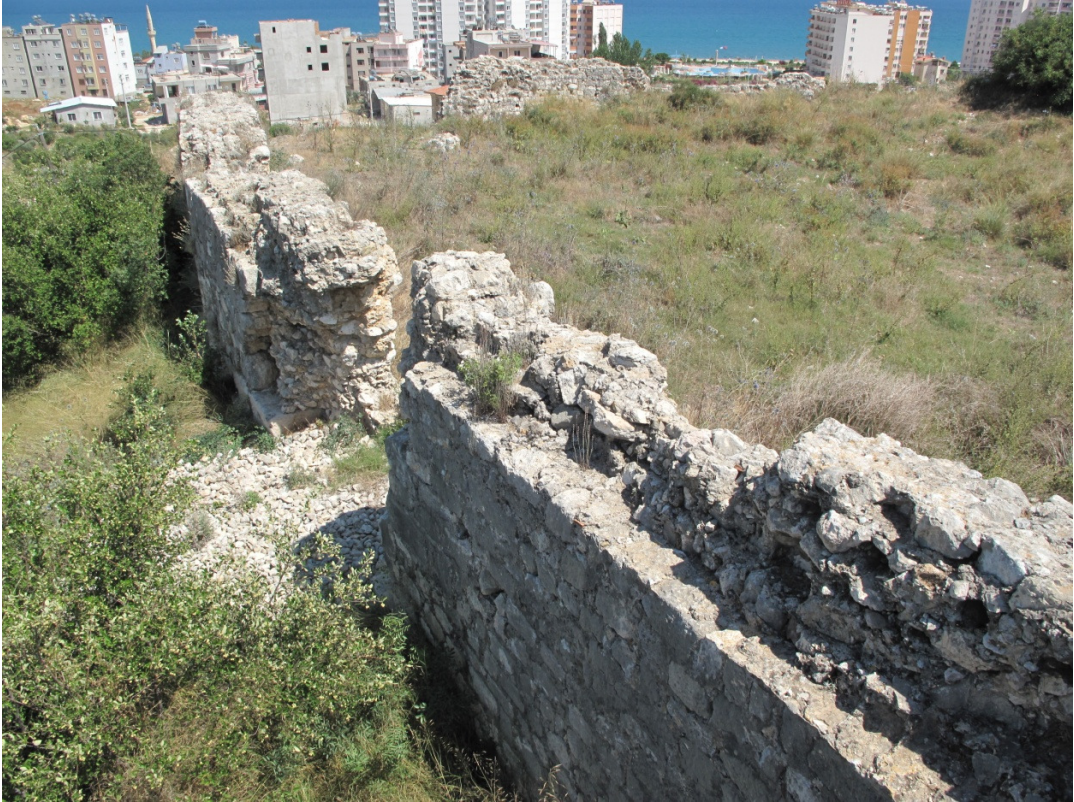
Resim 10: Kalenin Güney Sur Duvarı.