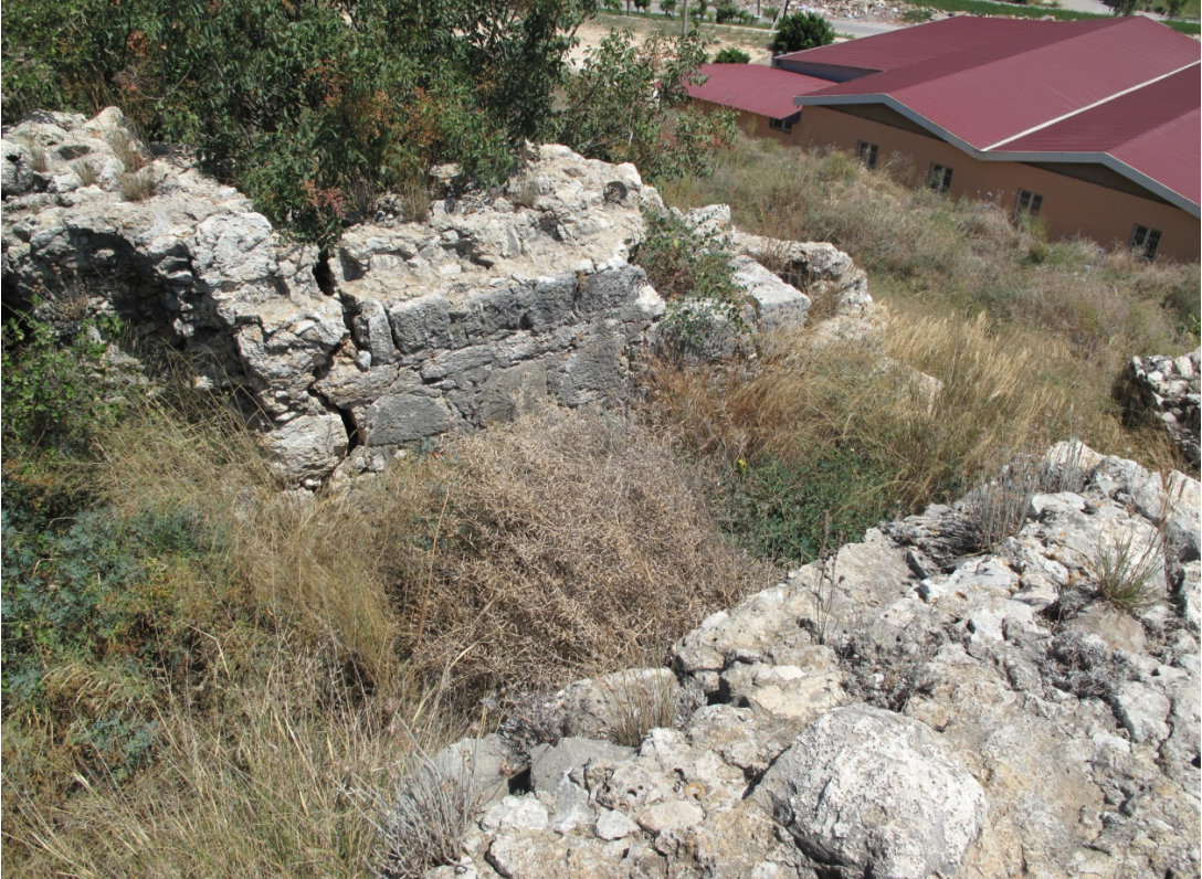
Resim 14: 6. Kısım Üstten Görünüm