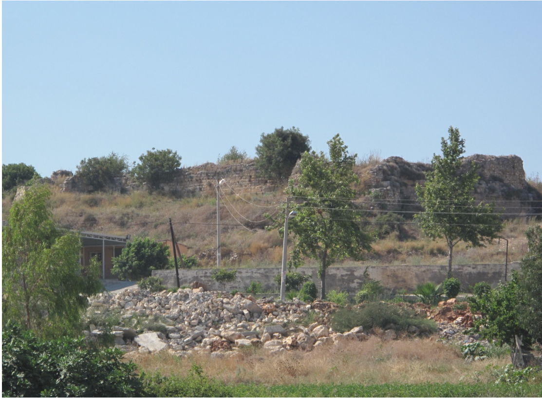
Resim 2: Kalenin Güneydoğudan Görünümü.