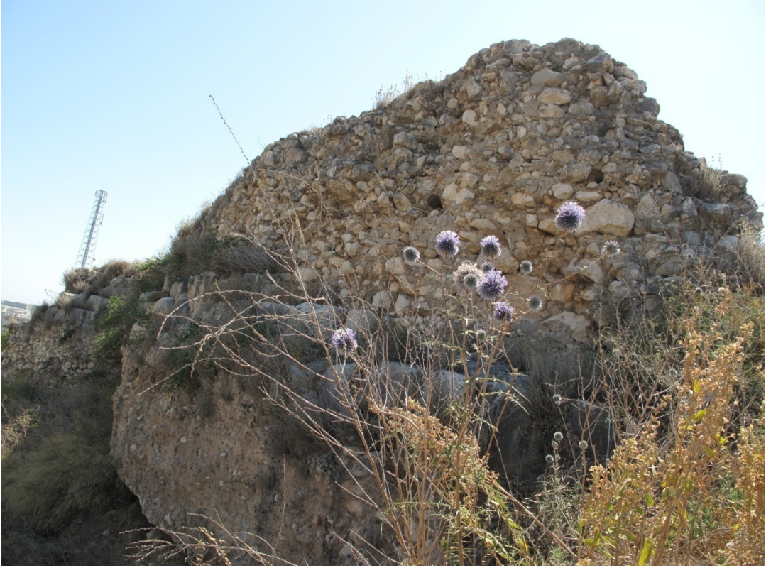
Resim 11: 4. Kısım Duvar Dolgusu.