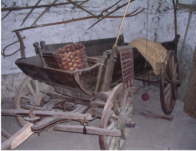
Resim 15: Ahşap at arabası.