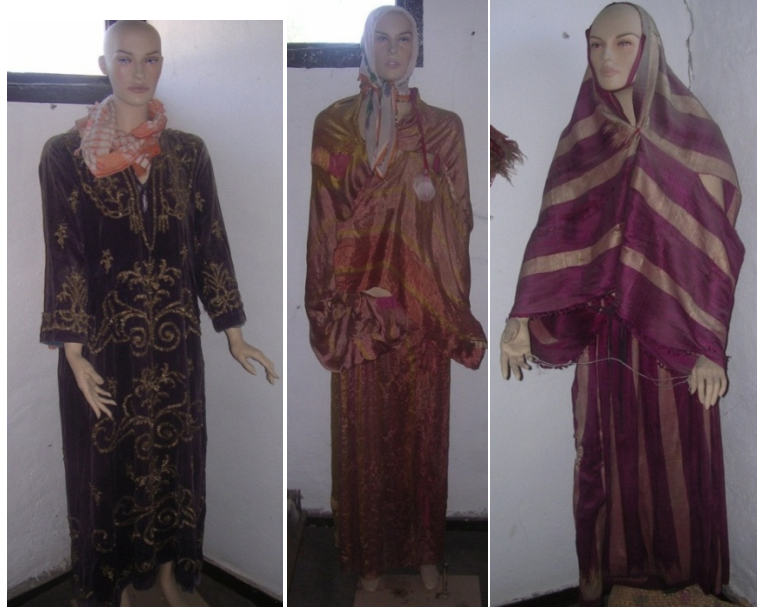
Resim 4: Bindallı giysi. Resim 5: Turuncu renkli ferace. Resim 6: Mor-krem çizgili ferace.

yıpranmış olan kıyafet tahminen yüz yıllık bir tarihe sahiptir. Bindallı kıyafetin iç kısmı beyaz renkli pamuklu astarlık kumaşla kaplanmıştır. Manşet ağzları ise içten mavi renkli bir kumaş parçasıyla desteklenmiştir. Bu mekândaki iki feraceden (çarşaf) birincisi ipek iplikle dokunmuş, turuncu ve kırmızı renkli çizgilerden oluşan bir çarşaftır. Bu kıyafetler, kadınlar evden dışarı çıktıkları zaman üzerlerinin ve kıyafetlerinin belli olmaması için kullandıkları giysilerdendir (Res. 5). İki parça halinde kullanılan kıyafetin üst kısmı omuzlardan atılarak kollarla sarılır ve ön taraftan kapatılarak kullanılır. Alt kısmı ise etek tarzında olup belden bir uçkurla büzülerek toplanır. Çarşafın iç kısmı pembe renkli pamuklu kumaştan yapılmış bir astarla kaplanmıştır. Boyun kısmında, başa veya boyuna sarmak için kullanılan pembe renkli iki uçlu bir kaytan kullanılmıştır.