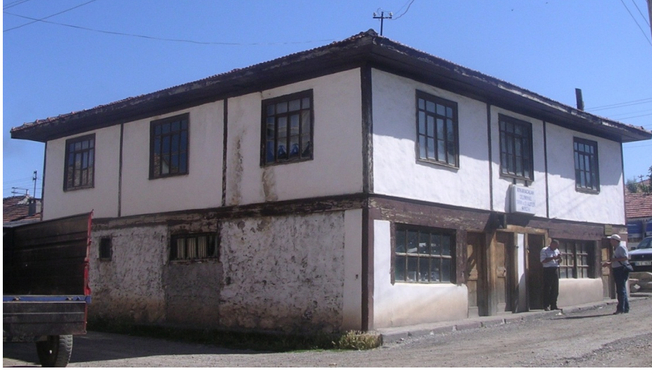
Resim 1: Atkaracalar Geleneksel Tarım ve El Aletleri Müzesi'nden genel bir görüntü.

Müzenin zemin katında, güneye bakan tarafta iki dükkân, kuzey tarafında da genişçe bir ahır bölümü bulunmaktadır. Üst katta ise bir hole açılan üç oda ve bir mutfak bulunmaktadır. Alttaki ahır bölümü temizlenip düzenlendikten sonra tarım aletlerinin ve çeşitli mutfak eşyalarının bulunduğu bir bölüm olarak değerlendirilmiştir. Üstteki odalar ise çeşitli kıyafetlerin, mutfak eşyalarının ve pek çok etnografik yerel malzeme ile araç gereçlerin sergilendiği bir bölüm olarak ele alınmıştır.