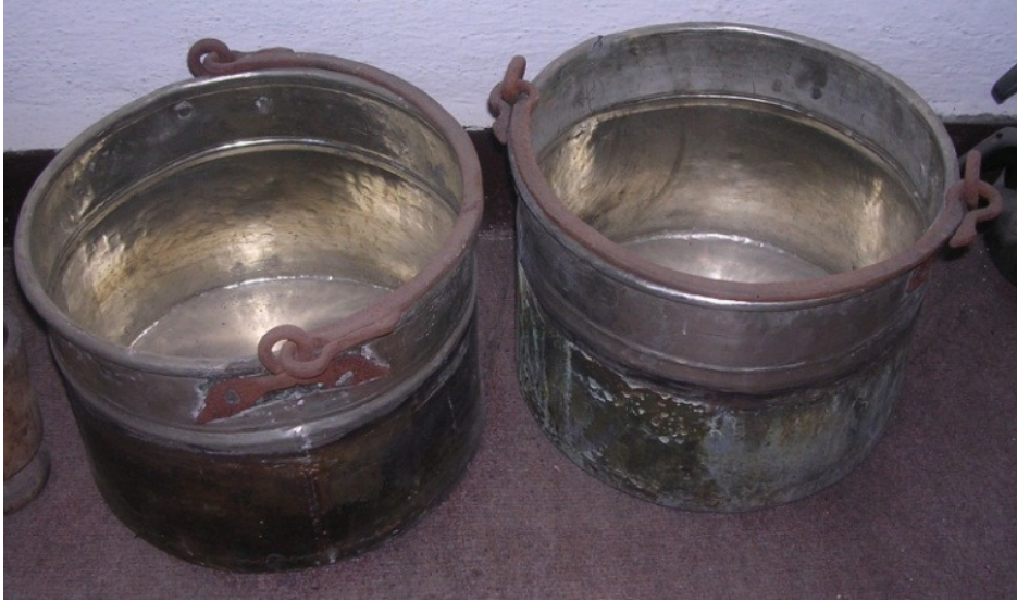
Resim 18: Su veya süt taşımada kullanılan bakır bakraçlar.