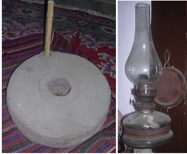
Resim 21: El değirmeni. Res. 22: Gaz lambası.