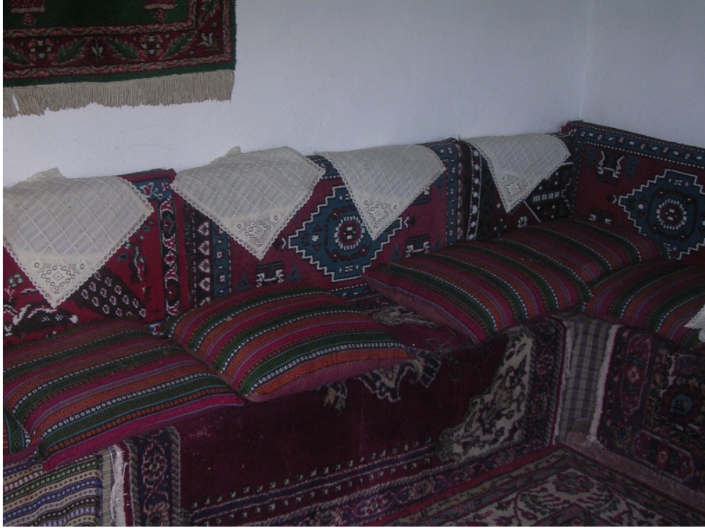
Resim 11: Atkaracalar Belediye Müzesi'nde şark köşesi.