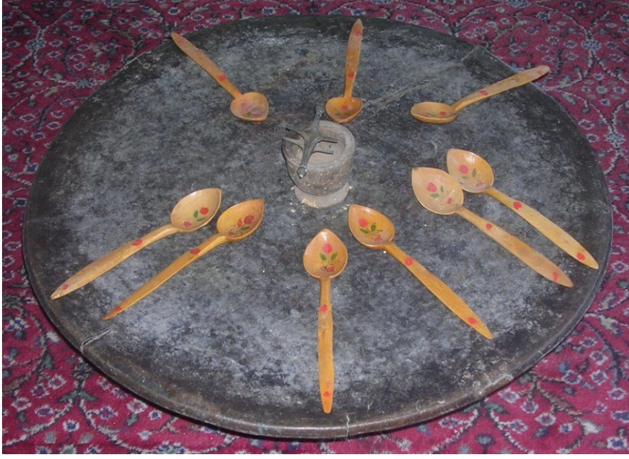
Resim 17: Sofra olarak kullanılan bir sini ve ahşap kaşıklar.