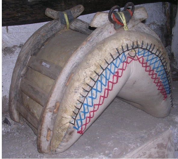
Resim. 26: Deri, ahşap ve bez ile yapılmış bir semer.

Atkaracalar Belediye Etnografya Müzesi'nin eserleri arasında özellikle tarımcılığın da olması sebebiyle at arabalarında ve hayvancılıkta kullanılan ya da tarımda kullanılan bazı deri ürünü etnografik eserler mevcuttur (Res. 26-27). Bu eserler arasında çeşitli eyer ve semerler , koşum takımları , boyunduruk halkaları , kalbur , gözer ve elekler ile atlarda, koyunlarda, koçlarda ve kuzularda kullanılan boncuklu ziller vardır.