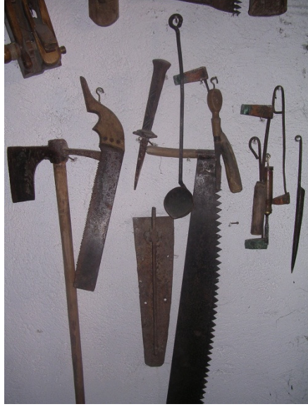
Resim 14: Marangozluk aletlerinden bir bölüm.