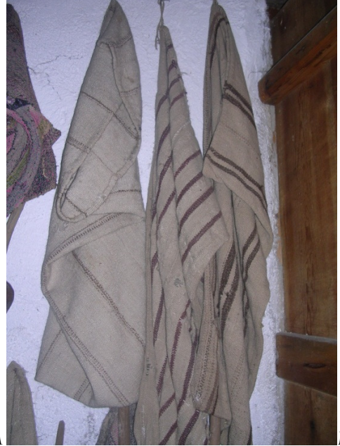
Resim 9A/B: Heybe ve alaca çuvallar.