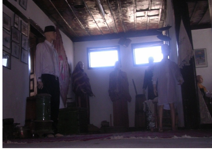
Resim 2: Antrede bulunan kıyafetlerin genel görüntüsü.

Müzedeki en göz alıcı eserler arasında bulunan kıyafetler, Çankırı ve Atkaracalar civarında görülen giysilerin özelliklerini taşımaktadırlar. Bu giysiler arasında bayan kıyafetleri , erkek kıyafetleri ve çocuk kıyafetleri bulunmaktadır. Kıyafetlerin çoğunluğu antrede sergilenirken (Res. 2) iki adet bayan kıyafeti bir oturma odasında yer almaktadır.