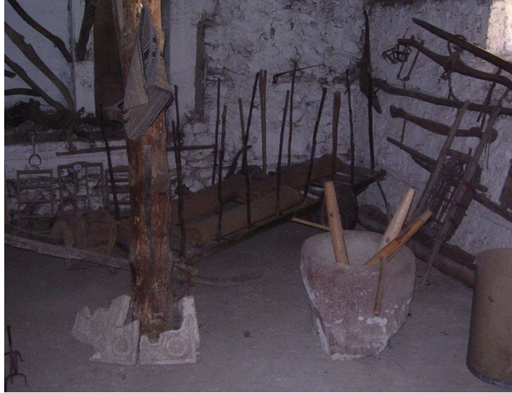
Resim 13: Çeşitli tarım aletleri ve bulgur sokusu.