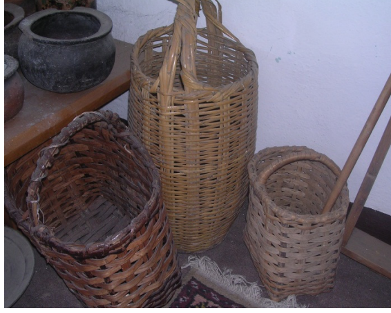
Resim 23: Çeşitli boylardaki el örgüsü sepetler.

(Res. 23), damacana veya şişe kılıfları, pazar çantası, saman taşımada kullanılan saman selesi (Res. 24) ve yer yaygısı olarak kullanılan hasırlar müzede görülebilir.