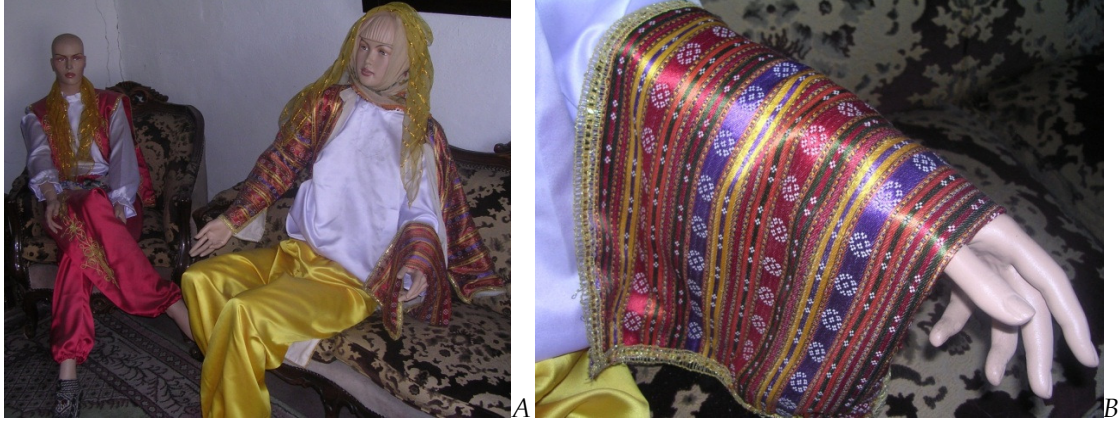
Resim 3A/B: Oturma odasında bulunan iki adet bayan kıyafeti ve üçetek kıyafetten ayrıntı.

Oturma odasında yer alan bayan kıyafetlerinin beyaz renkli bir poplin gömlek ve şalvardan oluştuğunu görürüz. Kıyafetlerden biri yanları işlemeli kırmızı renkli bir saten şalvar ve aynı kumaştan yapılmış saten yelek ile tamamlanmıştır. Diğer kıyafet ise beyaz poplin gömlek ile birlikte sarı renkli saten şalvar ve kutnu kumaştan dokunmuş üçetek entariden oluşmuştur (Res. 3A/B). Yöre kıyafetlerinde kutnu kumaş kullanımı oldukça sık karşılaştığımız bir durumdur. 1