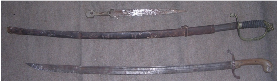
Resim 19: Kılıçlar ve kama.