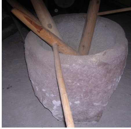
Resim 20: Bulgur sokusu ve tokmaklar.

Cam eserler olarak da karşımıza bir dönemin aydınlatma aracı olan gaz lambaları (Res. 22) ve nargileler çıkar.