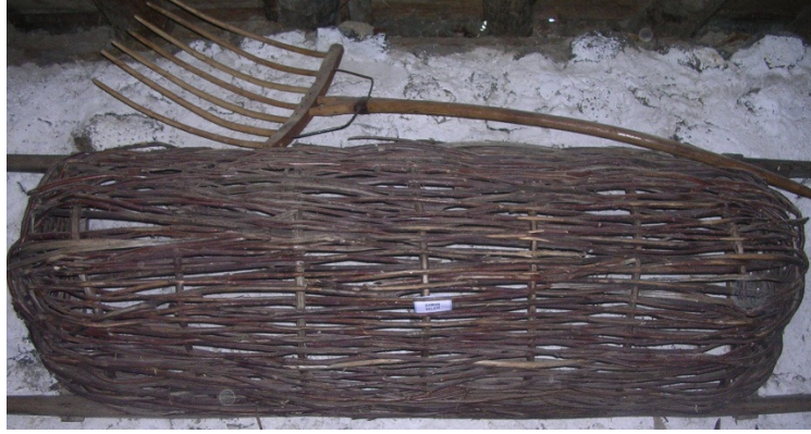
Resim 24: Söğüt dalıyla örülmüş olan saman selesi ve yaba.