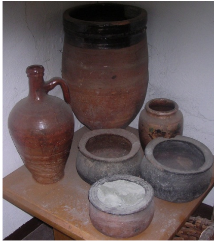
Resim 25: Çeşitli boylarda güveçler, su testisi ve küpler.