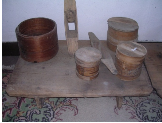
Resim 12: Atkaracalar'da kullanılan çeşitli mutfak eşyalarından bir bölüm.

Tarım aletleri arasında kağnı ve at arabaları (Res. 15), harman makinesi , yabalar , harman savurma kürekleri , dirgenler , anadutlar , tırmıklar , hayvanlara yük yüklemeye kullanılan dayamak çubukları , düvenler , değişik çaplardaki ölçek ve şinikler , bulgur tokmakları , karasabanlar , yekpare yalaklar , boyunduruklar , kırbaçlar , mazılar ve karasabanlar bulunur (Res. 13). Tarım aletlerinin dışında gündelik yaşamın bir parçası olan marangozluk aletleri de müzenin zengin eserleri arasında görülür. Bu eserler arasında testere ler, rendeler , baltalar , keser ve nacaklar en çok dikkati çeken eserlerdir (Res. 14).