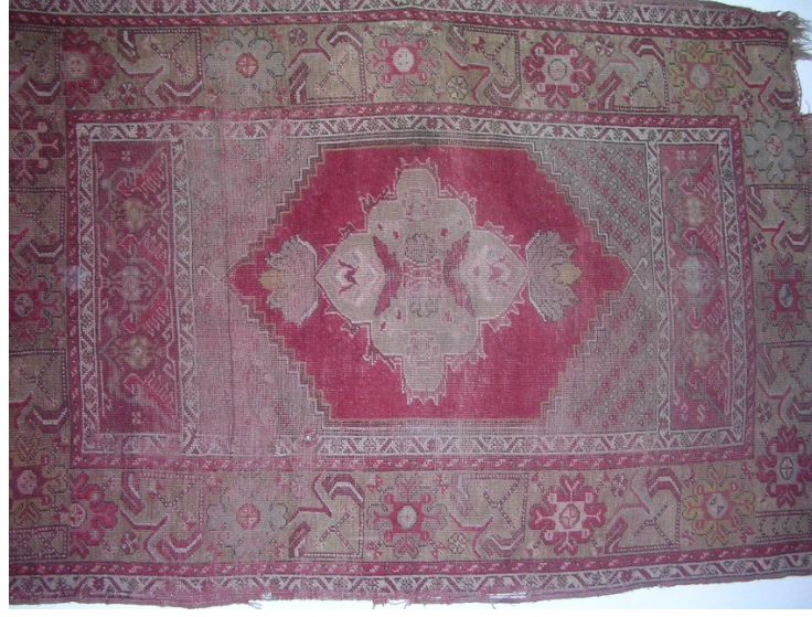
Resim 10: Atkaracalar Belediye Müzesi'nde bulunan bir seccade.