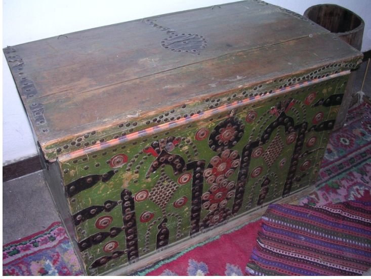
Resim 16: Ahşap çeyiz sandığı.

Gündelik yaşamın diğer eşyaları arasında yer alan ahşap eserlerin bir kısmını da çeşitli çeyiz sandıkları (Res. 16), iplik eğirmede kullanılan kirmanlar , yün ve tiftik liflerinin tarandığı çeşitli taraklar , iplik dolapları , ahşap beşikler , çocukların kışın kaymak için kullandıkları kızaklar oluşturmaktadır. Bunlardan başka ahşap pencere kapakları , ajurlu şebekelikler ve tavan süslemeleri diğer eserler olarak zikredilebilir.