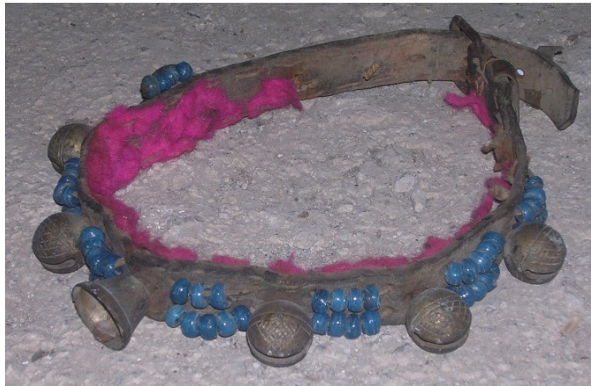
Resim 27: Deri kuşak üzerine takılan zillerden ve boncuklardan oluşmuş at süsü.