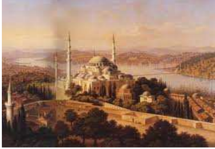
Resim 3: Süleymaniye ve Çevresi

ve medrese yapılarını görkemli bir caminin çevresine toplayan, ancak esasen çeşitli bilim dallarının bir arada okutulduğu geniş kapsamlı bir yüksek öğretim sitesi olarak tasarlanan Süleymaniye Külliyesi, çok işlevli külliye modelinin ileri bir aşamasını yaratmıştır. Osmanlı Devleti'nin en parlak döneminin, en güçlü hükümdarının ve en iyi mimarının ortaya koyduğu bir simge yapıdır." ( http://www.mimarlikmuzesi.org/Collection/Detail_suleymaniye-kulliyesi_10014.html )