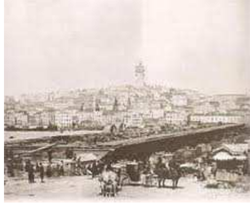
Resim 1: Galata Köprüsü

Sanat ve iktidar arasındaki ilişki daima insan zihnini meşgul etmiştir. Hemen her sanat dalını kapsayan bu hakikatin en somut ve göz alıcı sonuçlarını mimaride görmek mümkündür. Goethe, mimariyi dondurulmuş müziğe benzetirken iktidar ile mimari arasındaki ilişkiye de açıklama getiriyor bir bakıma. Bazı eserleri bir devrin, şahsın ya da zihniyetin sembolü olarak görmemize sebep olan mimari ile iktidar arasındaki bu ilişki, Akif'in de dikkatinden kaçmamıştır. Zira Süleymaniye Kürsüsünde'ki Galata Köprüsü'nün hangi dönemin, şahsın ya da zihniyetin temsilcisi olduğu sorusunun cevabı, sözü edilen metnin niyetini bulabilmek adına son derece önemlidir.