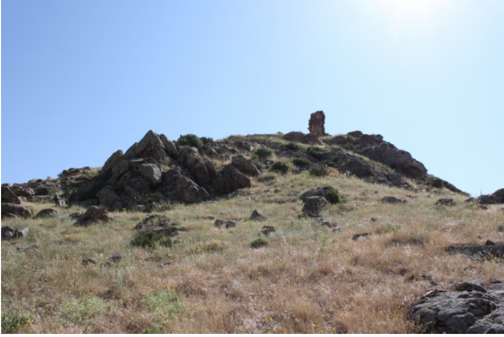
Figür 1: Çaya ğzı (Cemele) Kalesi Genel Görünüm