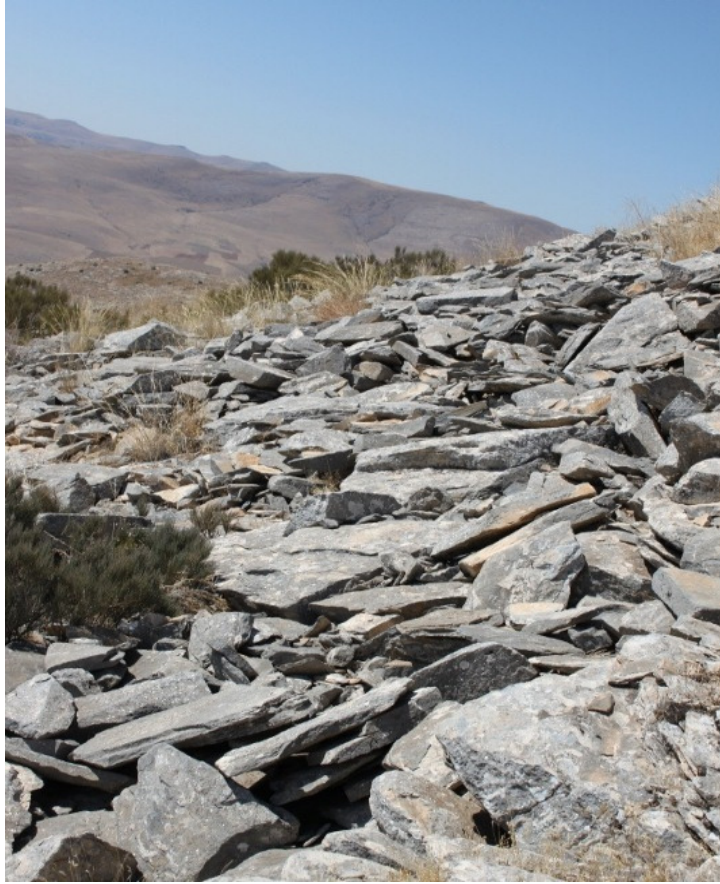
Figür 8: Kızılcaköy (Keçi) Kalesi Duvar Yapıları