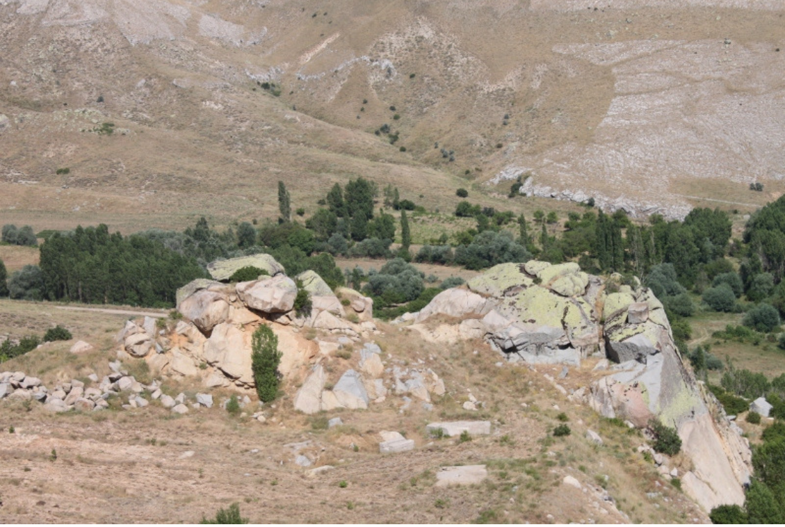
Figür 23: Yıkık Kale Genel Görünüm