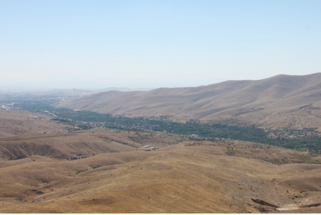
Figür 7: Kızılcaköy (Keçi) Kalesi, Yollar