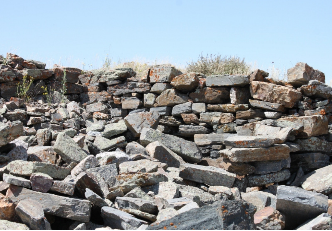
Figür 11: Yağmurlu kale (Gavurkale) Duvar Yapısı