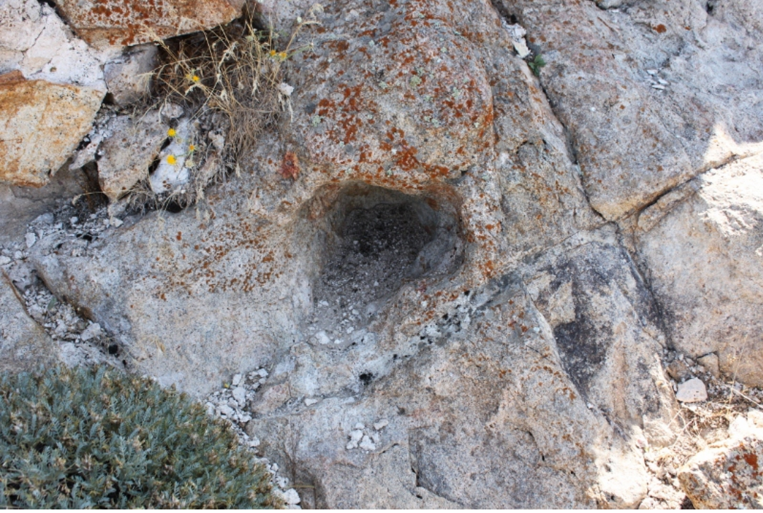
Figür 5: Çaya ğzı (Cemele) Kalesi Soku