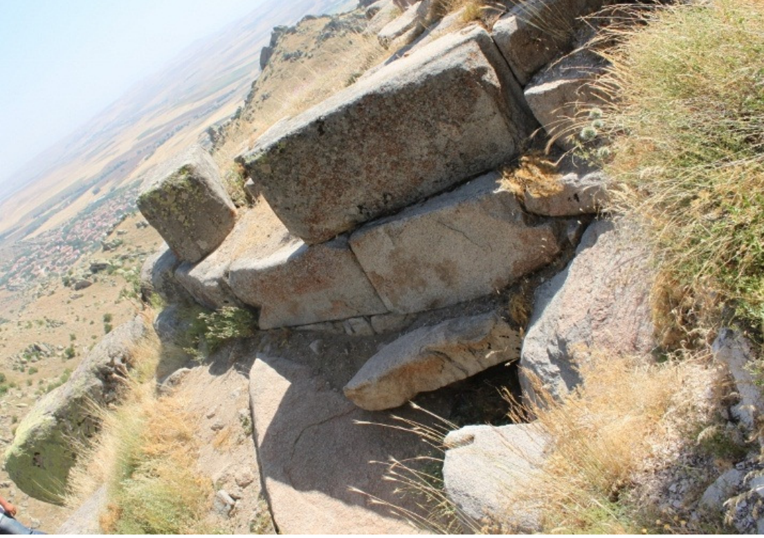
Figür 17: Ömerhacılı (Kuş) Kalesi Duvar Yapısı