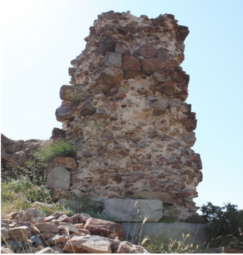
Figür 3: aya ğzı (Cemele) Kalesi Duvar Yapıları