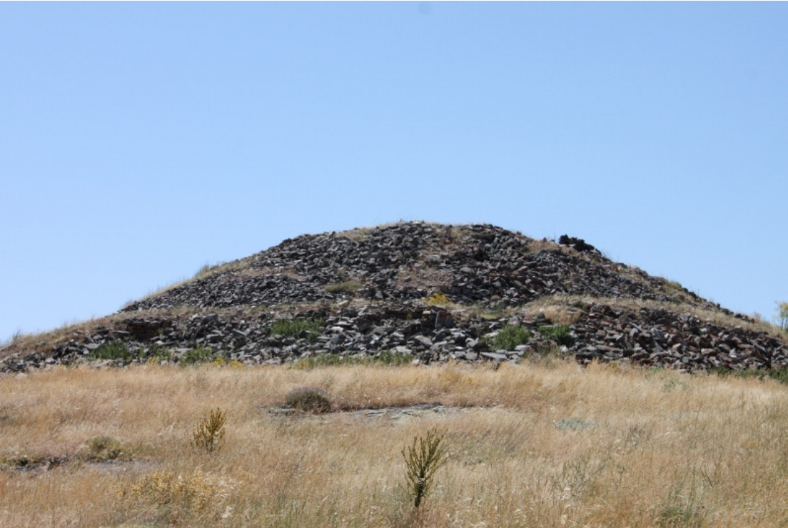
Figür 12: Yağmurlu kale (Gavurkale), Tümülüs