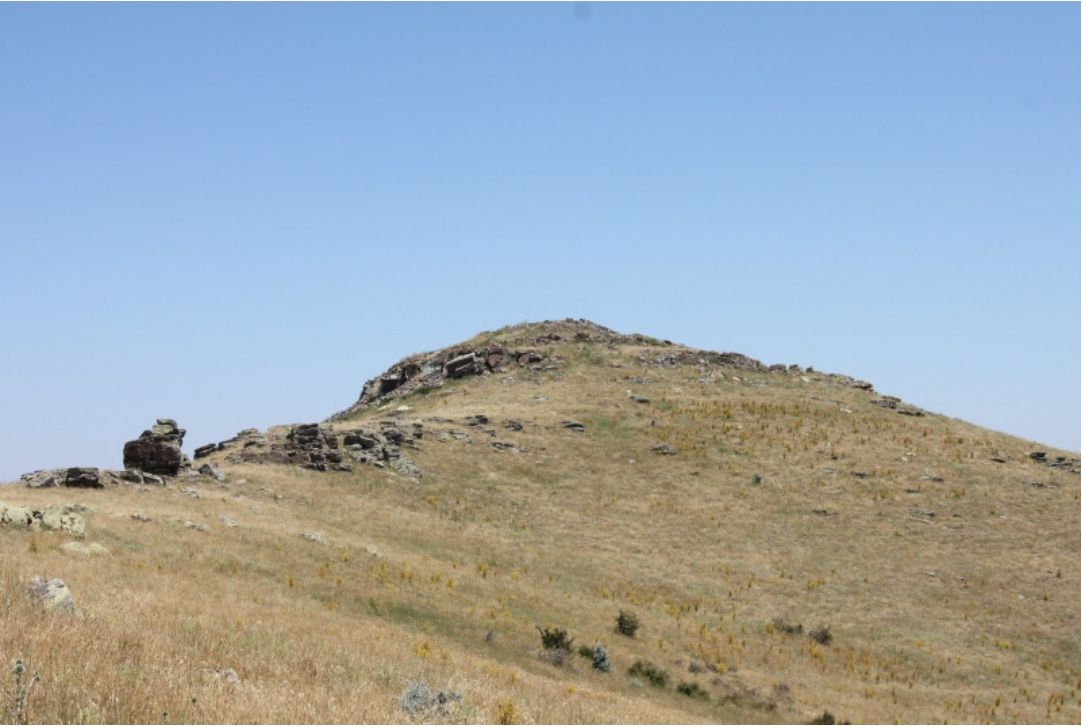
Figür 10: Yağmurlu kale (Gavurkale) Genel Görünüm