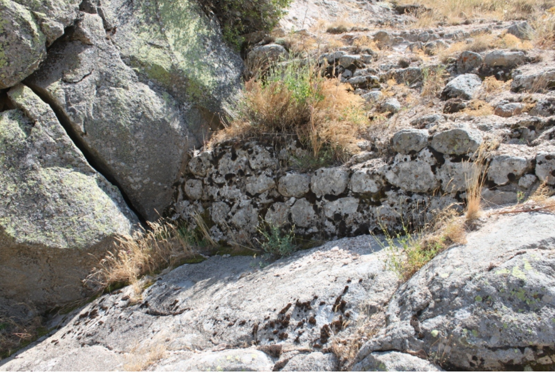
Figür 16: Ömerhacılı (Kuş) Kalesi Duvar Yapısı