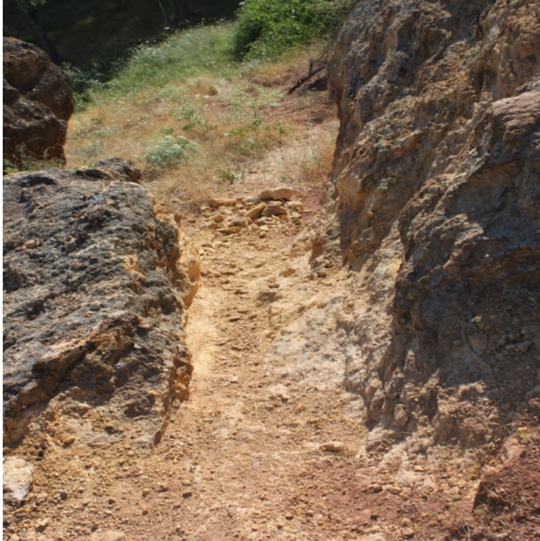
Figür 26: Sıdıklı (Kulpak) Kalesi