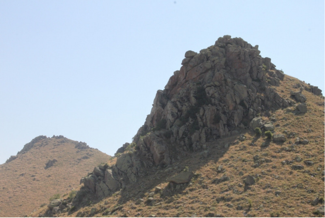
Figür 22: Doğru Kale Genel Görünüm