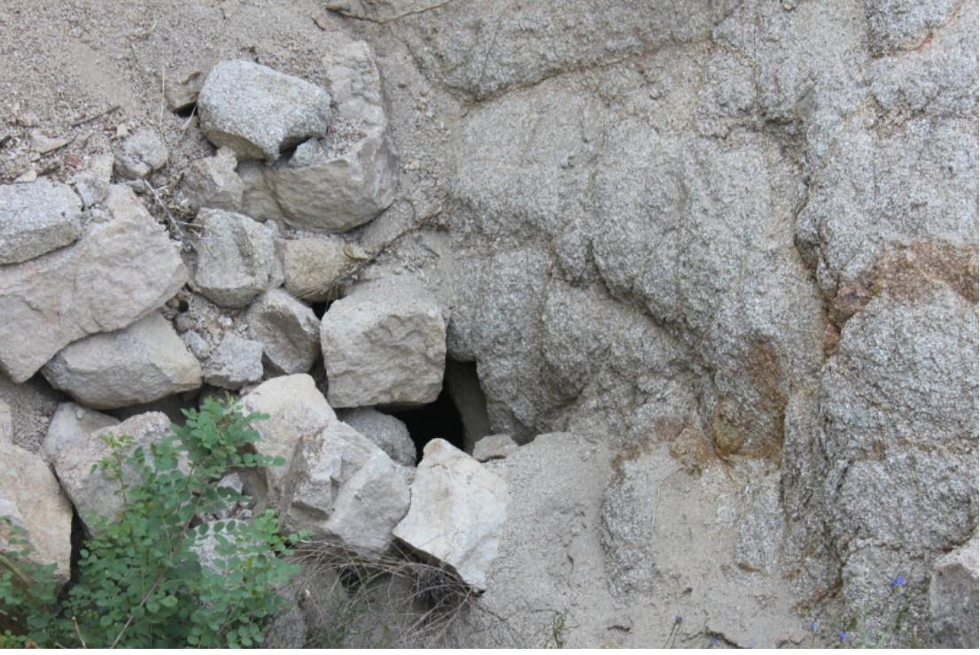
Figür 21: Eğri Kale Su Tüneli