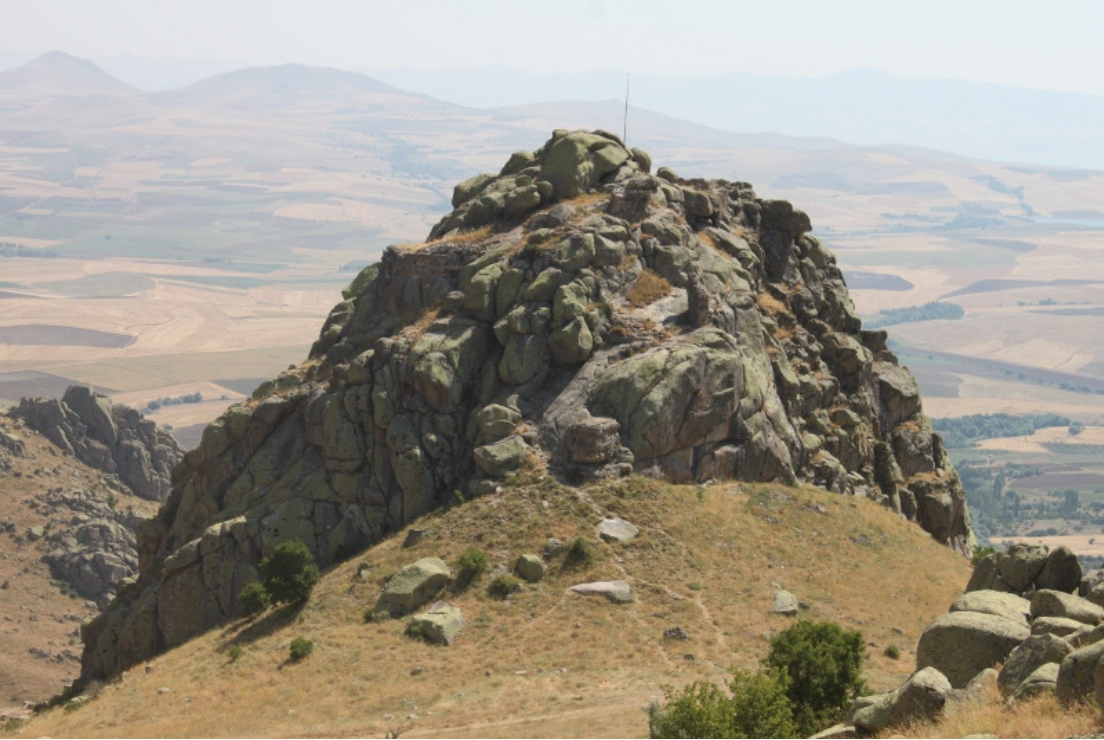
Figür 14: Ömerhacılı (Kuş) Kalesi Genel Görünüm