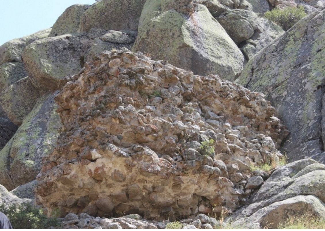
Figür 15: Ömerhacılı (Kuş) Kalesi Duvar Yapısı