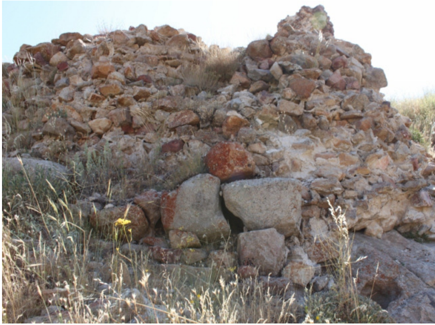
Figür 2: Çaya ğzı (Cemele) Kalesi Duvar Yapıları