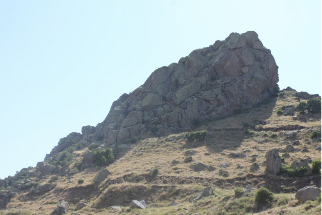
Figür 20: Eği Kale Genel Görünüm