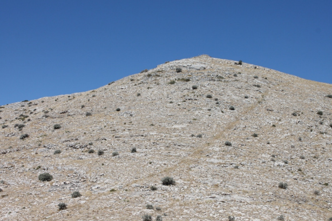
Figür 6: Kızılcaköy (Keçi) Kalesi Genel Görünüm