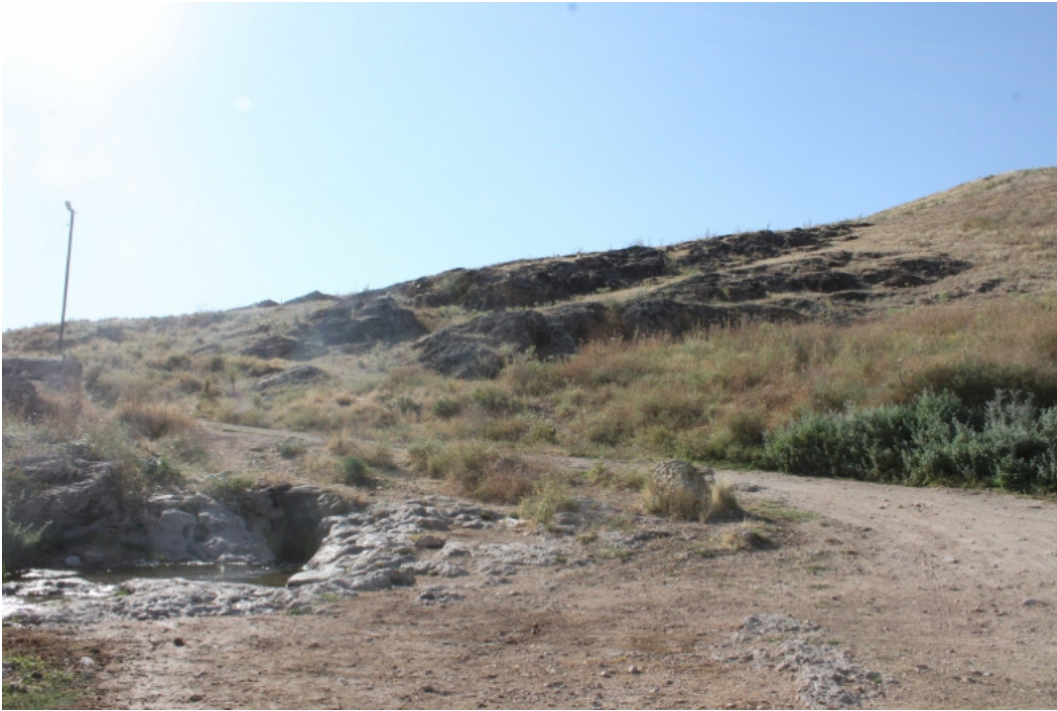
Figür 24: Sıdklı (Kulpak) Kalesi Genel Görünüm