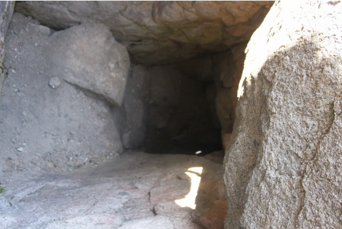
Figür 18: Ömerhacılı (Kuş) Kalesi Su Tüneli