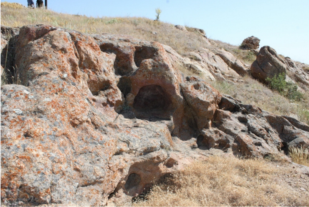
Figür 4: aya ğzı (Cemele) Kalesi Kaya Oyukları