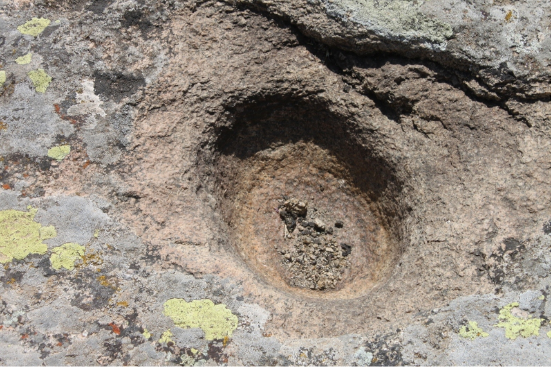
Figür 19: Ömerhacılı (Kuş) Kalesi Soku