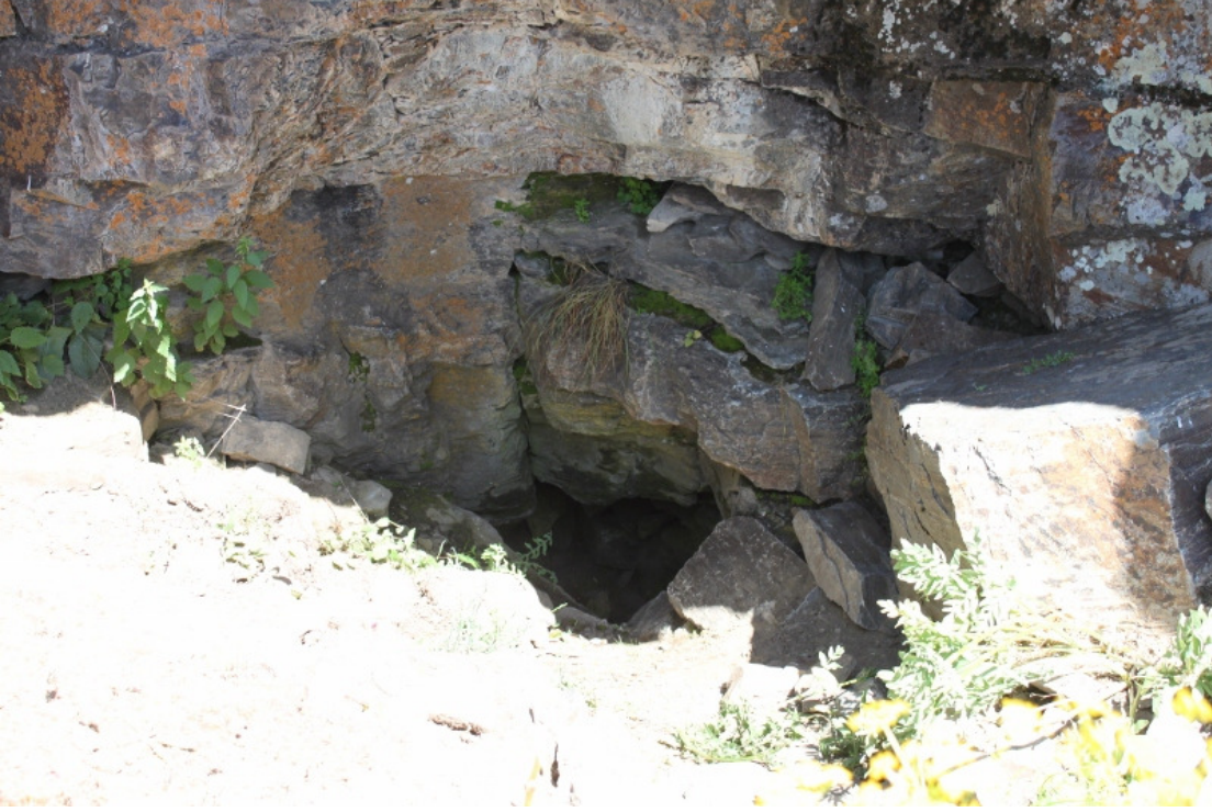
Figür 13: Yağmurlu kale (Gavurkale) Su Tüneli