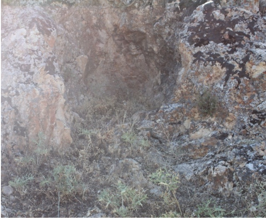
Figür 25: Sıdıklı (Kulpak) Kalesi Kaya Oyukları