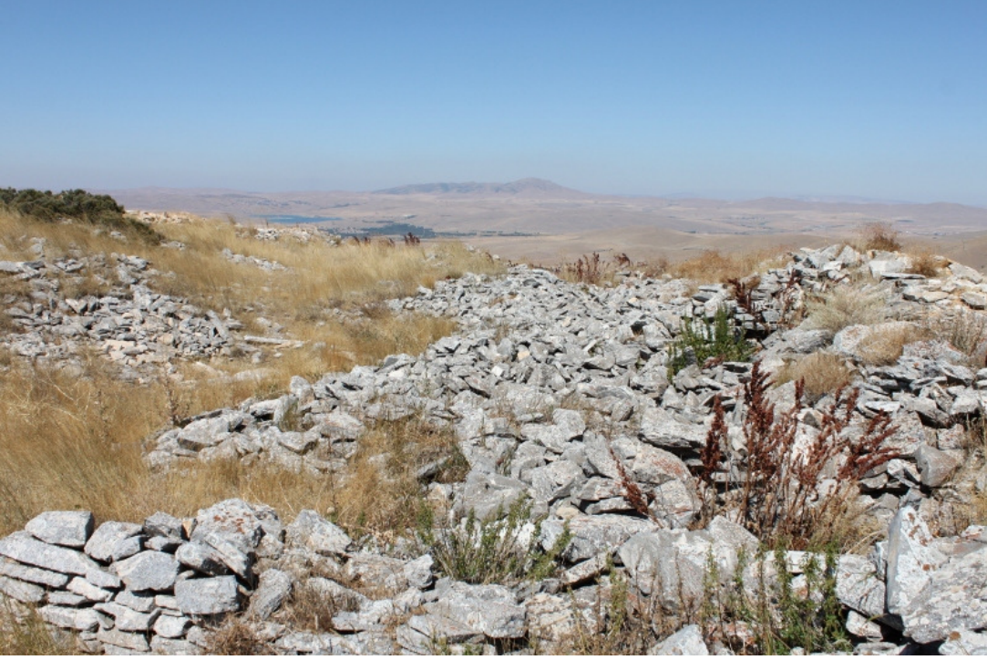
Figür 9: Kızılcaköy (Keçi) Kalesi Mekan İzleri