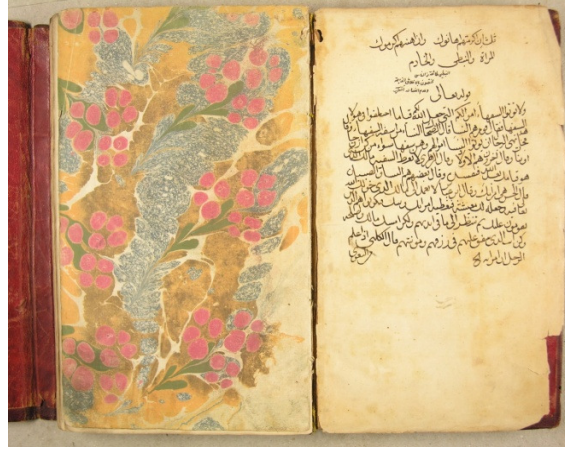
Fotoğraf 11: Çiçekli Ebrû/Kır Çiçekleri (Envanter Numarası: 424-001)

2 risaleden oluşan 250x155 mm ölçülerinde Mecmûatür Resâil isimli Arapça eser, Hunat Kütüphanesi'nden H.1.8.1333/M.14 Haziran 1915 tarihinde devredilmiştir. (Kütüphane Envanter Defteri: Envanter No: 424-001). Çiçekli Ebrû (Kır Çiçekleri) örneği eserde yan kâğıt olarak yer almaktadır. Ebrûda renk olarak neftli lahor, kahverengi, portakal rengi, yeşil ve pembe kullanılmıştır. Zeminde renkler verev bir şekilde belirli bir sıra ile atılmıştır. Verev olarak bir sıra neftli lahor bir sıra da ebrûlü bir görünümde kahverengi ile portakal rengi birlikte atılarak zemin oluşturulmuştur. Bu zemin üzerine yeşil damlalara bizle sap ve yaprak şekli verilmiştir. Yapraklar üzerine dörtlü küçük pembe damlalarla üç çiçek halinde buketler oluşturulmuştur. Eserde yer alan ebrû sağlamdır.