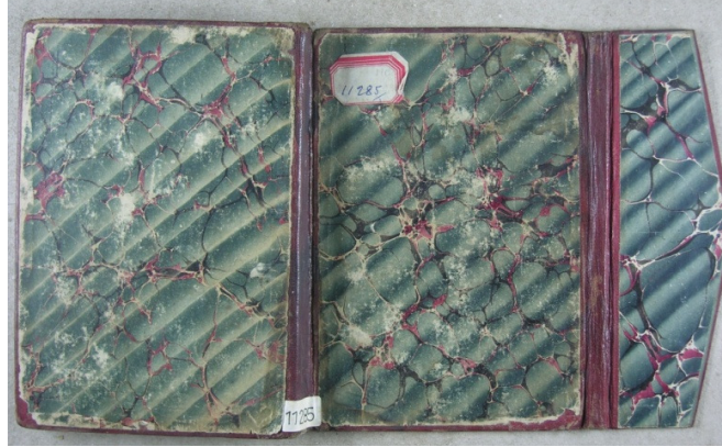
Fotoğraf 14: Dalgalı Ebrû (Envanter Numarası: 11285-000)