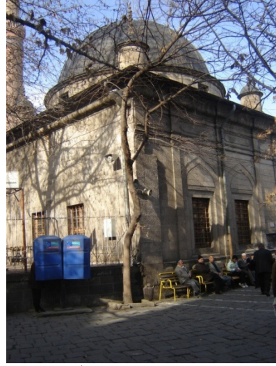
Kütüphanenin Dış Görünümü