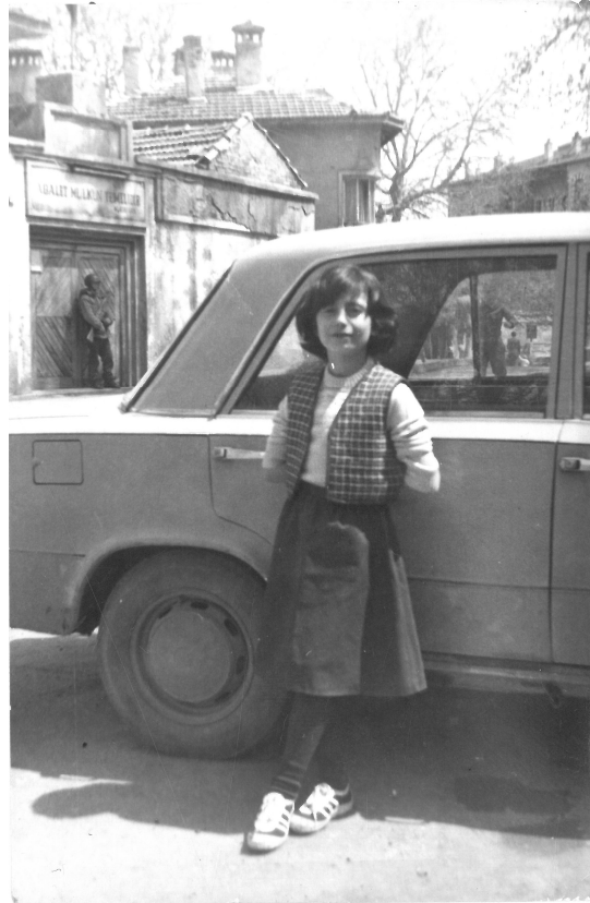
Ek 3: Kütahya Hapishanesi Giriş Kapısı

http://www.kutahya.gov.tr/galeri/viewphoto.asp?i=y10.jpg&f=eski+kutahya&sh=1080&sw=1920