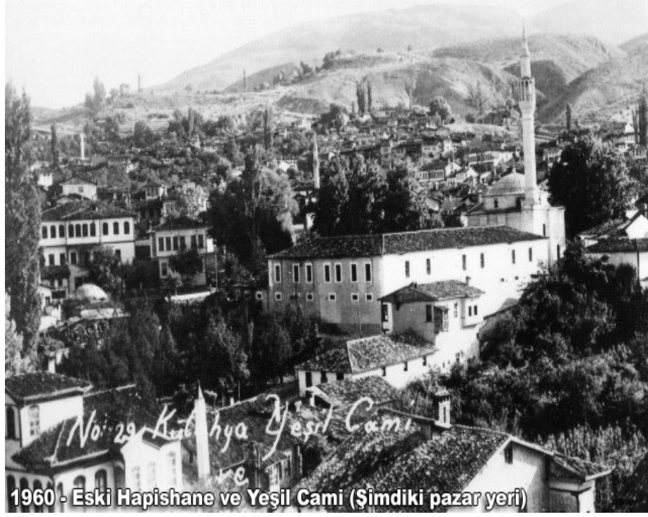
Ek 2 : Kütahya Hapishanesi Genel Görünümü

http://www.kutahya.gov.tr/galeri/viewphoto.asp?i=y10.jpg&f=eski+kutahya&sh=1080&sw=1920