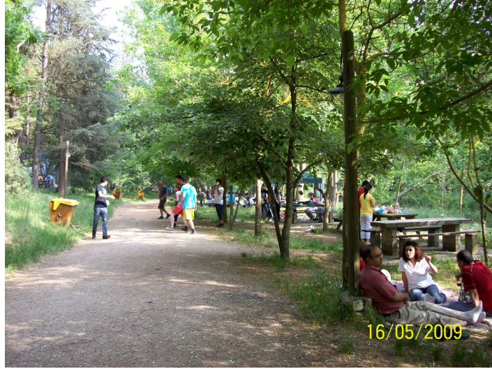
Foto 6: Şehrin Stresli Ortamından Kaçan İnsanlar Değirmen Boğazı'nda Çeşitli Aktivitelerle Dinlenme Fırsatı Bulmaktadır

Değirmen Boğazı'na gelenlerin %87'si piknik yapmak, %6'sı dinlenmek, %2'i spor yapmak ve %4'ü de diğer faaliyetleri gerçekleştirmek istemektedir. Alana gelenlerin yaklaşık yarısı sabahın erken saatlerinde gelip, hem kahvaltılarını burada yaparlar hem de alanın kendilerine göre güzel yerlerini kapmaktadır. Ziyaretçilerin bir bölümü öğle saatlerinden sonra gelir ve pikniklerini yaparlar. Bu saatte gelenler, özellikle hafta sonlarında yer bulmakta zorlanır, bazıları ise yer bulamadıkları için geri dönmek zorunda kalırlar. Akşamüstü gelen ziyaretçilerin amacı ise piknik yapmak değil; gezmek, dinlenmek ve temiz hava almaktır.