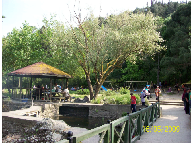
Foto 4: Yağıştan ve Güneşten Korunmak Amacı ile Düzenlenen Kapalı Alan

Değirmen Boğazı'nın eğim açısından uygun yerleri havaların ısınmasıyla beraber, halk tarafından piknik amacıyla kullanılır. Alanda sportif amaçlı koşunun yanı sıra kermes, sergi ve veda yemekleri gibi, çeşitli kurum ve kuruluşlarca gerçekleştirilen sosyal faaliyetler için de oldukça uygun bir alandır. Bu alanda Balıkesir Dağcılık İhtisas Kulübü ve Balıkesir Üniversitesi ve Kış Sporları Kulübü üyeleri tarafından, alanın kuzeyindeki Akkaya'da temel kaya tırmanışı öğrenme ve eğitim çalışmaları yapılmaktadır. Tırmanma eğitimi için buranın seçilmesinin nedeni; ulaşımın kolay olması, temel kaya tırmanışını öğrenmek için uygun bir kayalığın bulunması, su kaynaklarının ve temel ihtiyaç tesislerinin bulunması gibi avantajlara sahip olmasıdır.