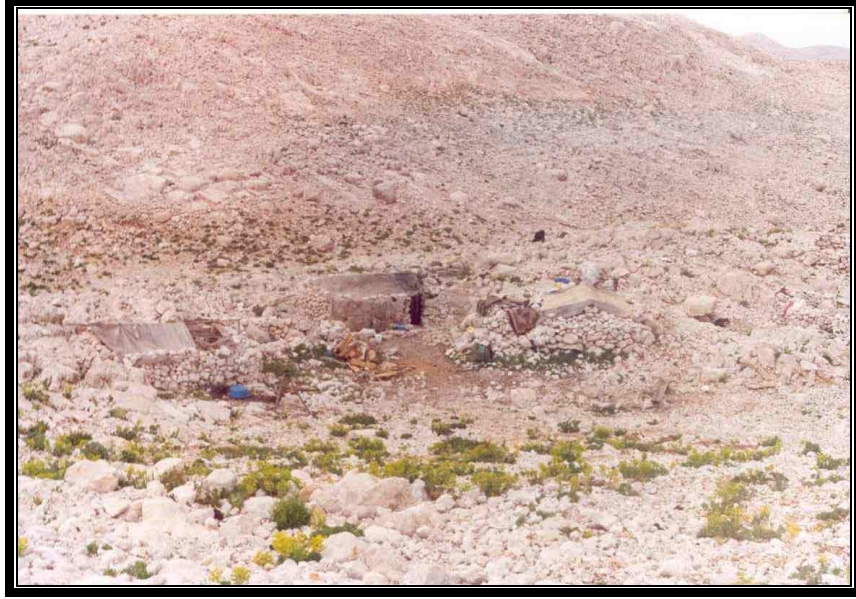
Fotoğraf 3. Yaklaşık 2500 m’de Bulunan Bozloğan Yaylasındaki Yörük Obası

Akseki İlçesinde kendilerine has yaşam şekilleri ile dikkat çeken dağ göçebelerinin en büyük problemi, tabii ki su teminidir. Her türlü ihtiyaç için suyun oldukça zor şartlarda elde eden insanlar, bazen hayvanları ile aynı kaptan su içmekte, bazen de bir kap su ile birkaç defa bulaşık yıkayabilmektedirler. Hayvansal ürünlerin salamura şeklinde saklandığı Bozloğan yaylasında, yaklaşık 2000 küçükbaş hayvan bulunmaktadır. Hayvanların su ihtiyacı ise yine kar eritilerek karşılanmaktadır. Bunun için ağıllara yakın konumlardaki düdenlerden balta kullanılarak kesilen karlar, erimeleri ve hayvanlar tarafından içilmeleri için leğenler içinde arazinin uygun yerlerine bırakılmaktadır (Fotoğraf 4)