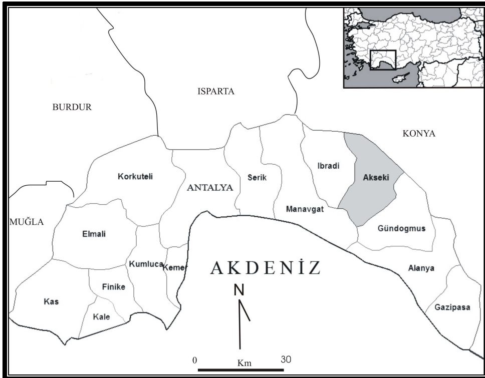
Şekil 1. Araştırma Sahasının Lokasyon Haritası

Akseki İlçesinde iyi şekilde gelişmiş bir orman örtüsü vardır. Dünya Doğal Hayatı Koruma Vakfı tarafından, Avrupa kıtasında acil olarak korunması gereken 100 sıcak bölge arasında anılan Akseki-İbradi ormanları, yurdumuzun ender orman alanlarından birini oluşturmaktadır. Bölgenin bitki örtüsü özelliklerinin ortaya çıkmasında da Toros Dağları, belirleyici olmuştur. Akseki İlçesinin büyük bölümü bitki örtüsü katı olarak, Toros Dağlarının 1000-2000 m yükseltileri arasındaki Akdeniz Dağ Kuşağında yer alır 2 . Ayrıca sahanın güneyinde Akdeniz Alt Kuşağı, kuzey-kuzeydoğu-doğu ve güneydoğusunda ise Akdeniz Dağ-Çayır alanlarında kalan bölümleri de vardır. Saha endemikler yanında, 4. zamanın iklim değişikliklerinin eseri olan relik türler barındırması bakımından da önem taşır. Toros göknarı ve sedir yörede iyi gelişmiş ağaç türlerini meydana getirirken, özellikle Galanthus (Kardelen) ile temsil edilen soğansı ve otsu türlerin varlığından da bahsetmek gerekir. Bu türler yörenin göçebe topluluklar tarafından tercih edilmesinin de sebepleri arasındadır.