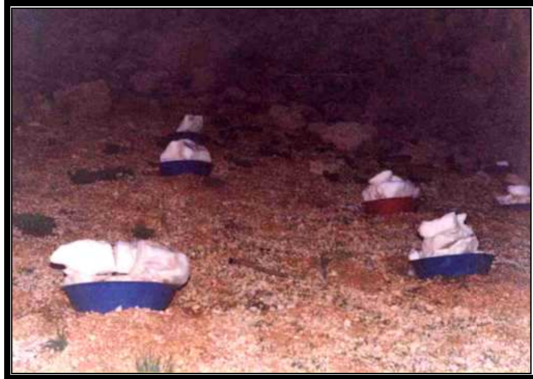
Fotoğraf 4. Düdenlerden Çıkarılan Karlar, Küçükbaş Hayvanların Su İhtiyacı İçin Arazinin Uygun Yerlerine Leğenler İçerisinde Bırakılır.

Akseki İlçesinin güneydoğusundaki bu dağ göçebelerinden başka, yine Manavgat’a bağlı Gençler köyünden bu defa Akseki Kasabasından kuzeydeki Gidengelmez Dağlarına gelen dağ göçebeleri de vardır. Bunlar yarı göçebeler gibi kuzeye doğru hareket eden “Kürtler” aşiretidir. 1930’lu yılların başlarında Diyarbakır civarından getirilerek Gençler köyüne yerleştirilen aile, yöredeki Yörüklerle aynı yaşam tarzlarına sahip olmuşlardır. Bugün bu aşiretten 4 hane yaklaşık 27 nüfus, dağ göçebesi şeklinde otlaktan otlığa dolaşmaktadır.