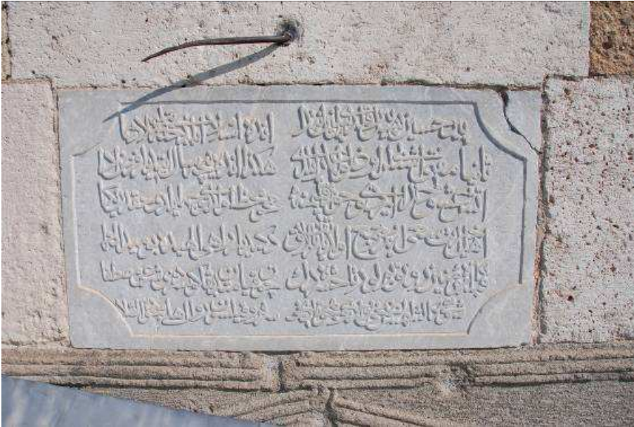
2. Fotoğraf: Batı girişte yer alan Ebcad hesabı ile 1300 tarihini veren kitabe.