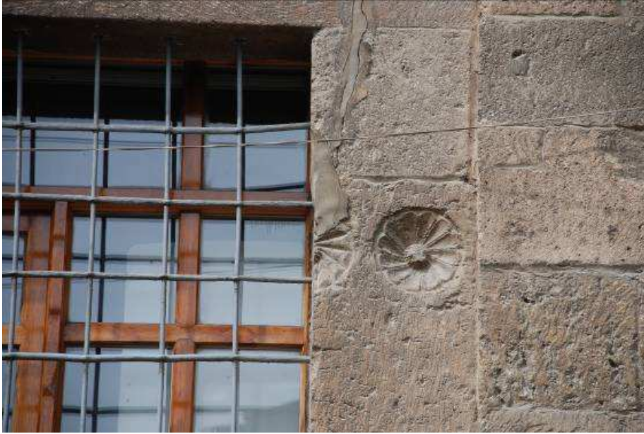
14. Fotoğraf: Doğu cephede pencere lentosundaki devşirme malzeme.