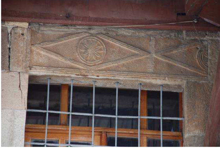
15. Fotoğraf: Doğu cephede pencere lentosu olarak kullanılan devşirme parça.