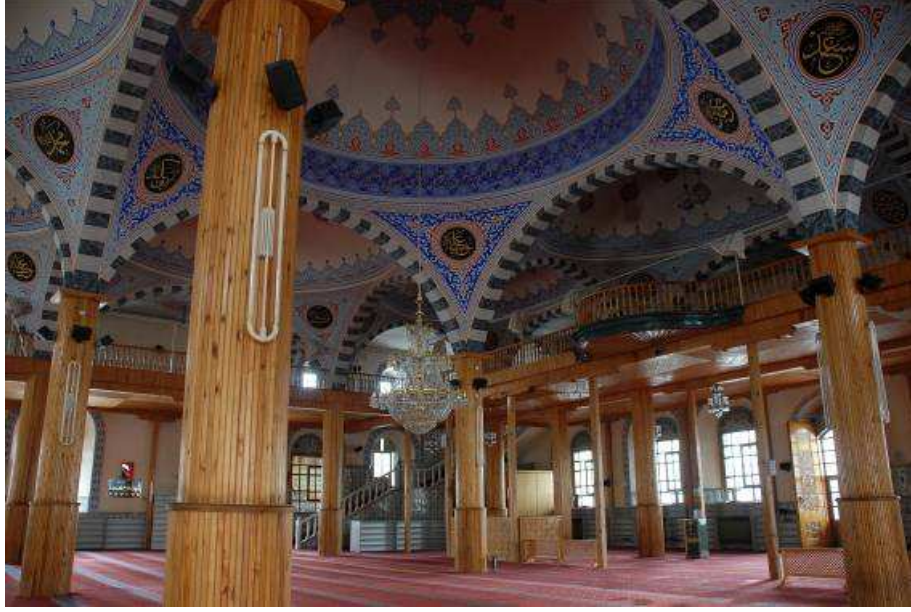
27. Fotoğraf: Mahfilin görünüşü.