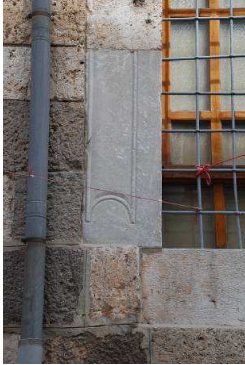
10. Fotoğraf: Güney cephede devşirme malzeme kullanımı.