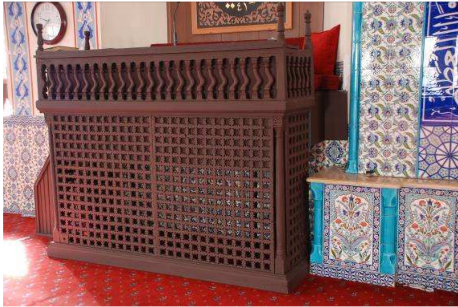
26. Fotoğraf: Kürsü, genel görünüm.