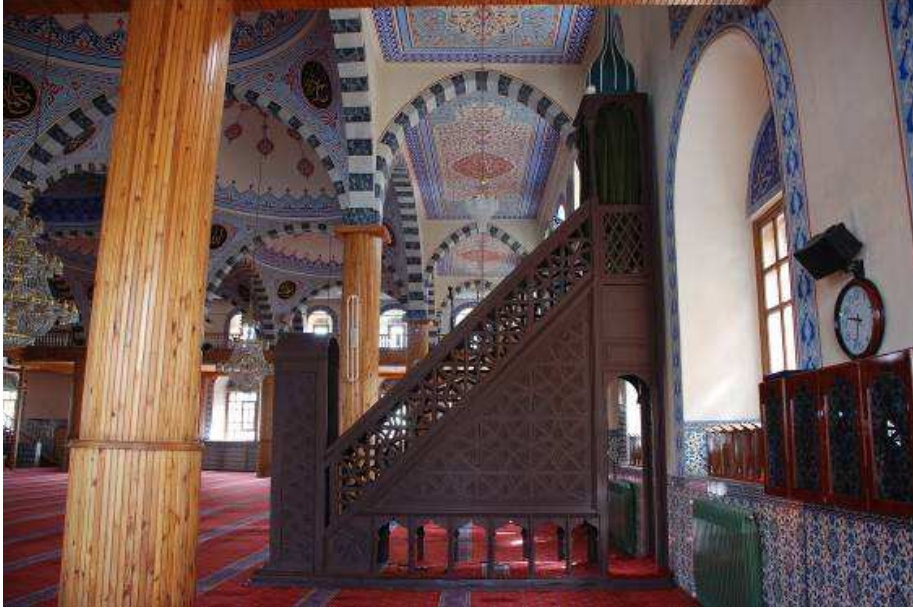
25. Fotoğraf: Minber, genel görünüm.