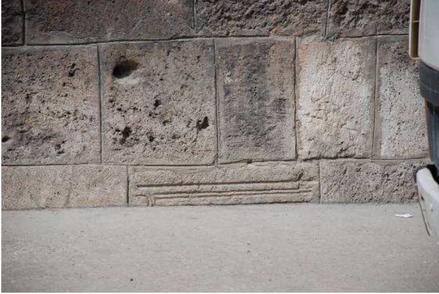
13. Fotoğraf: Günümüz zemin kotunda yer alan devşirme malzeme.