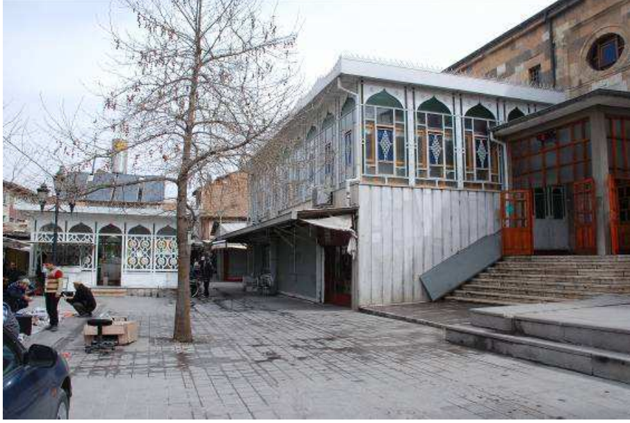
3. Fotoğraf: Yapının kuzeybatı köşesindeki eklenti ve şadırvanın genel görünümü.