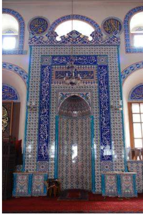
24. Fotoğraf: Caminin mihrabı.