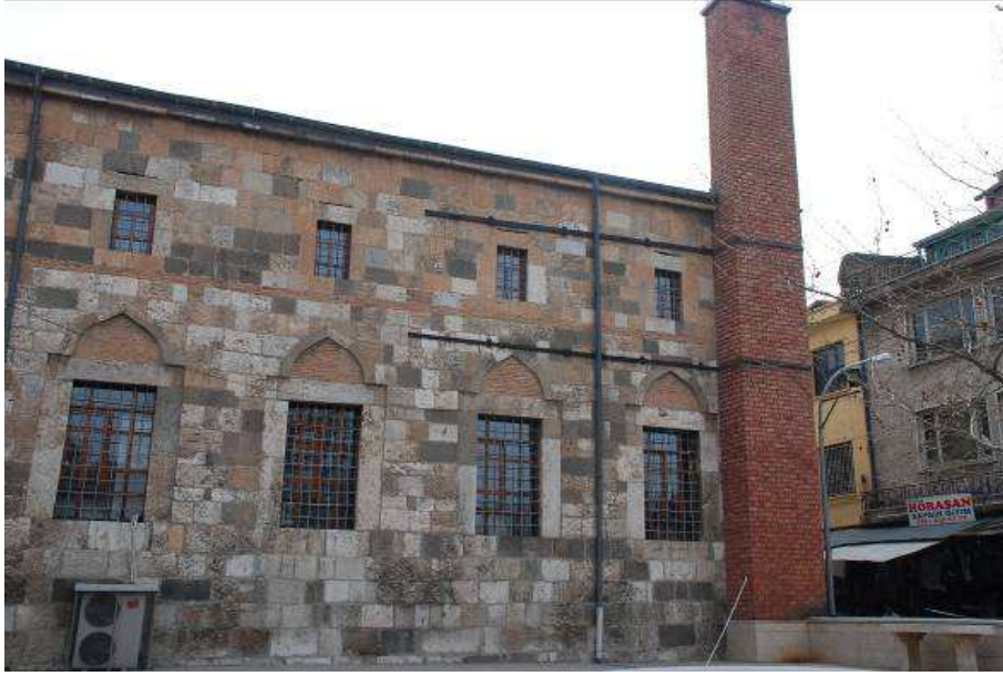
8. Fotoğraf: Batı cephede tuğla kullanımı ve metal kuşaklar.