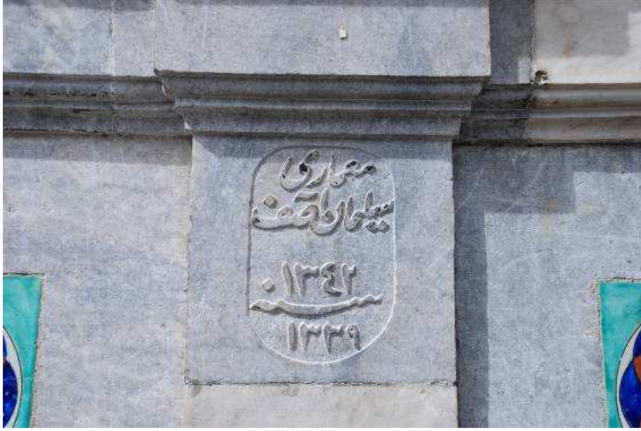
7. Fotoğraf: Abdest muslukları üzerinde yer alan inşa kitabesi.