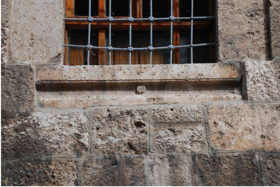
11. Fotoğraf: Güney cephede devşirme malzeme kullanımı.