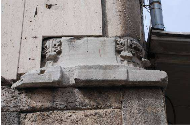
19. Fotoğraf: Son cemaat yeri kuzeybatı köşede yer alan korint başlık.