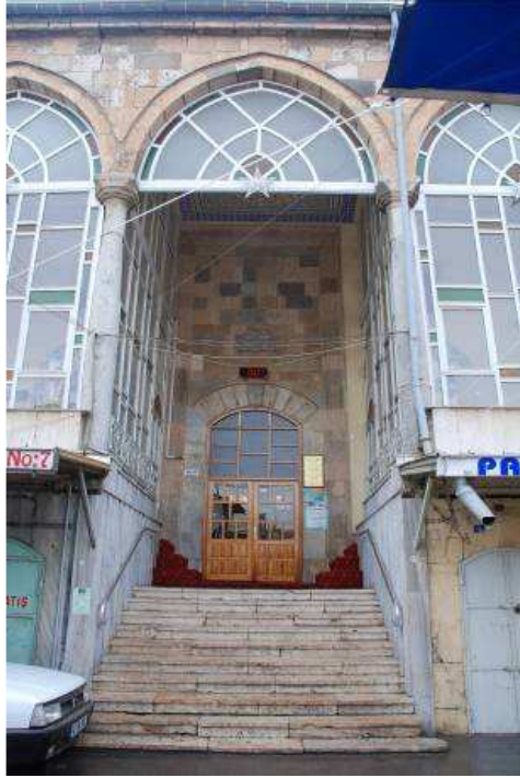
18. Fotoğraf: Kuzey giriş, genel görünümü.