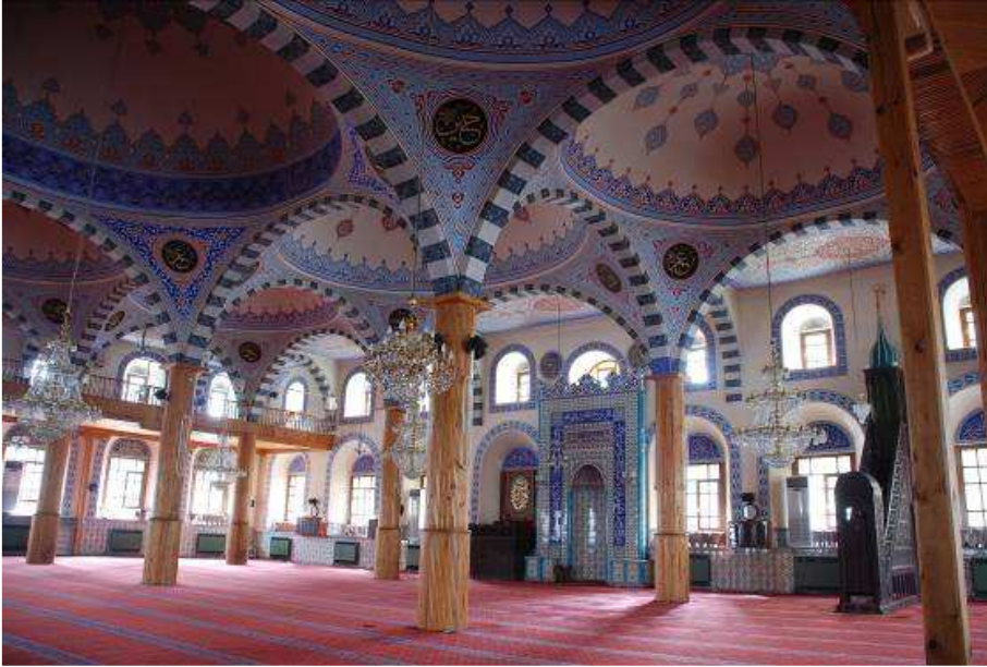
22. Fotoğraf: Harimden görünüş