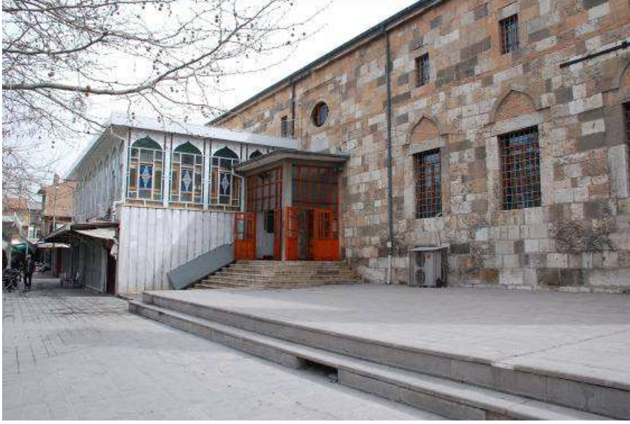
1. Fotoğraf: Kapı Camii, batı cephesi genel görünüm.