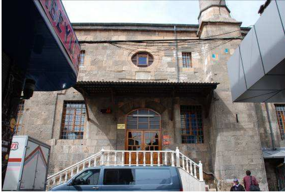
4. Fotoğraf: Kapı Camii, doğu girişi ve minare kaidesinin genel görünümü.