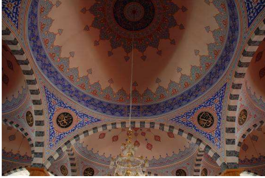
23. Fotoğraf: Kubbe kasağında yer alan yazı kuşağı.