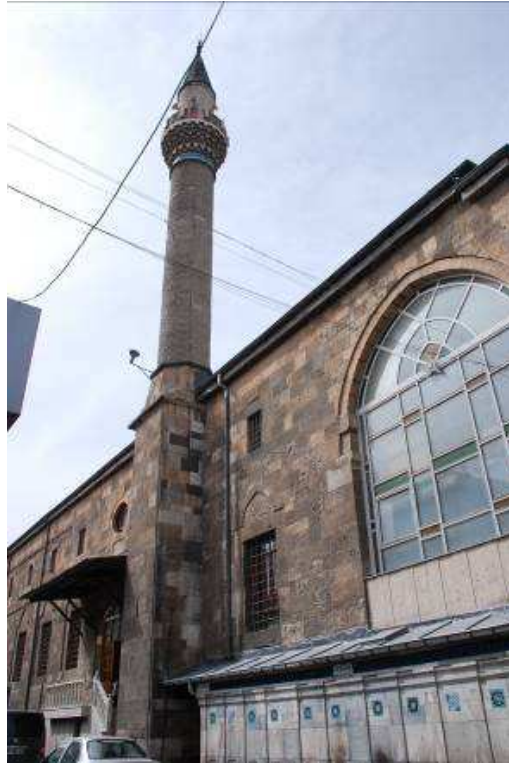
6. Fotoğraf: Minare ve abdest musluklarının genel görünümü.