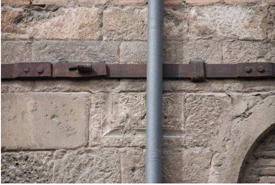
17. Fotoğraf: Doğu cephede yer alan haç motifinin işlendiği devşirme malzeme.