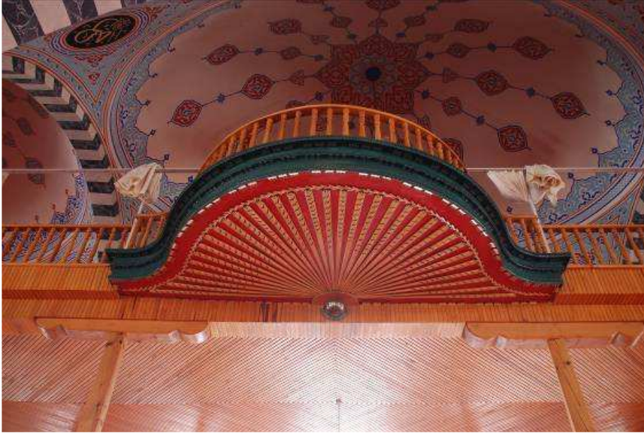
28. Fotoğraf: Mahfilin çıkması.