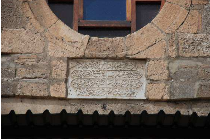
5. Fotoğraf: Doğu girişte yer alan kitabe.