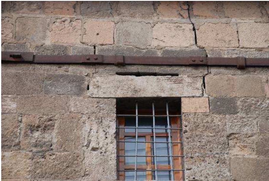
12. Fotoğraf: Doğu cephede devşirme malzeme kullanımı.