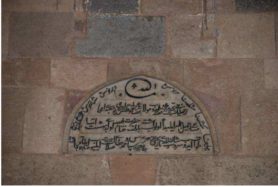
21. Fotoğraf: Kuzey girişte yer alan kitabe.