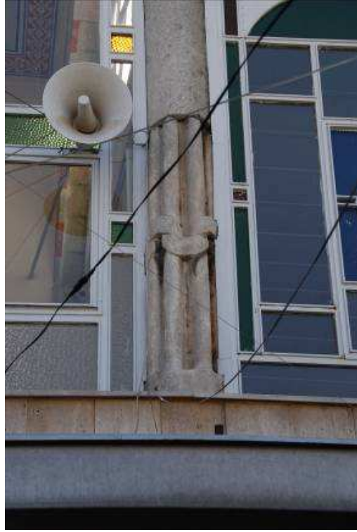
20. Fotoğraf: Son cemaat yerinde yer alan Bizans Düğümlü sütunu.