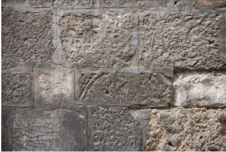
16. Fotoğraf: Doğu cephede yer alan devşirme malzeme.