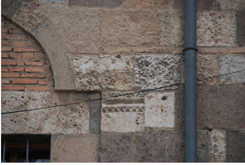
9. Fotoğraf: Batı cephede yer alan devşirme malzeme örneği.