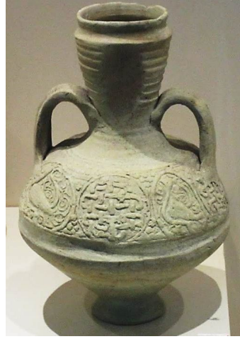
Şekil 4. Çift Kulplu Sürahi

Form ve Bezeme: Boyun, ağızdan gövdeye doğru daraltılarak, sadece bir yüzeyine çizgi motifleri uygulanmıştır. Sürehinin her iki yanında, boynun en dar yerinden çıkarak, karın kısmından sonra yukarıya doğru daralan gövdeye birleşen kulplar bulunmaktadır. Omuz kısmında kuşak halinde zencerek motifi vardır. Sürahinin gövdesinde içerisinde kaz veya kuğu resimleri bulunan sekiz adet madalyon mevcut olup, bu madalyonlar arasındaki alan ise tırtıklı kabarıklar ile bezenmiştir.