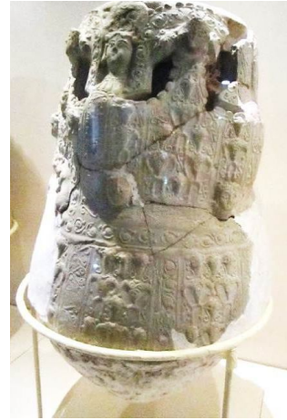
Şekil 2-3. Taht Kompozisyonlu Sırsız Küp, Ön ve Arka Görünümü