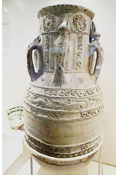
Şekil 1. Hayvan Figürlü Sırsız Küp

Gövdenin alt bölümünde yine üç sıra süsleme yapılmıştır. Alt ve üstteki şeritte helezonik şekiller, ortada ise 1,5 cm. çapında kabartma motifi sıralanmıştır. Kabartmaların üzerinde merkeze doğru kazımlar bulunmaktadır.