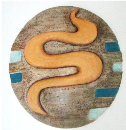
Şekil 5 . Çalışma 1 (R: 43 cm)

Seramiklerin bisküvi pişirimleri 950°C'de yapıldıktan sonra, sırlama aşamasına geçilmiştir. Seçilen sırların renkleri belirlenmiş, 1020°C'de ikinci pişirim gerçekleştirilerek çalışmalar tamamlanmıştır.