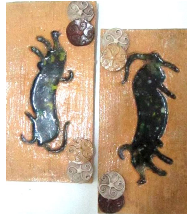
Şekil 6. Çalışma 2 (36X18 cm)