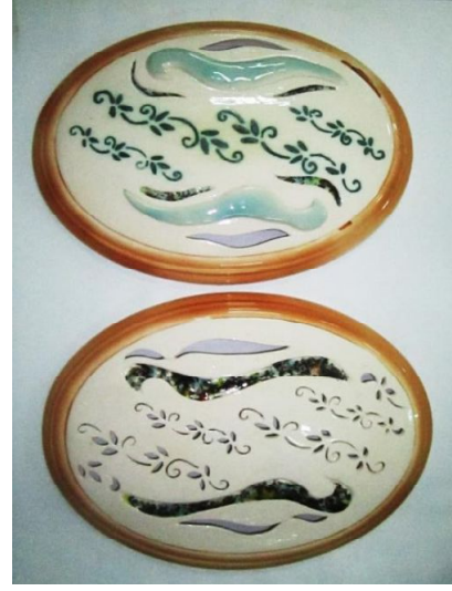
Şekil 10. Çalışma 5 (32x40 cm)