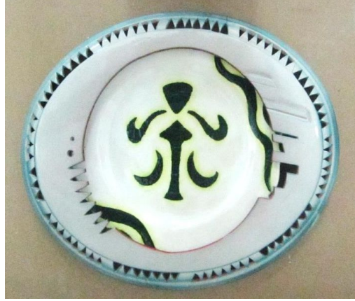
Şekil 11. Çalışma 6 (32x40 cm)

Döküm tekniği kullanılan çalışmanın ortası kesilerek çıkarılmış ve çini tabak yerleştirilmiştir (Şekil 11). Zıt yönlerdeki üçgenlerin sıralanmasıyla oluşan bordürde ajur tekniği uygulanmıştır. Üstteki tabakanın iç kenarları dikdörtgen ve üçgen şekillerinde kesilmiştir. Çini tabağın içerisine taht kompozisyonlu figür stilize edilerek çizilmiştir. Merkezde yer alan bu motifle uyumlu olarak, yanlarına asimetrik yerleştirilen hareketli şeritlerle kompozisyon tamamlanmıştır.