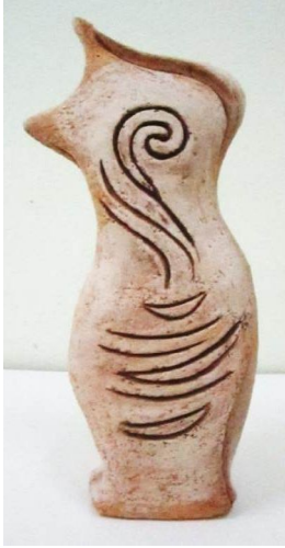
Şekil 14. Çalışma 8 (34x12 cm)

Arka yüzde, stilize edilmiş hayvan motifinden bir parça rölyef olarak çalışılmıştır (Şekil 15). Şekillendirme işleminin ardından, yüzeye kısmi olarak beyaz çamurdan astar uygulanmış, siyah eskitme yapılarak çizgiler derinleştirilmiştir.