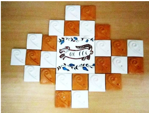
Şekil 12. Çalışma 7 (70x55 cm)

Bu çalışmada, hayvan figürlü sırsız küp üzerindeki hayvan figürü ile kenarlarında yer alan dekoratif motif kullanılmıştır (Şekil 12-13). Seramik pano olarak tasarlanan çalışmada merkezde 20x20 cm. boyutunda çini fayans bulunmaktadır. Fayans üzerinde yer alan kırmızı çini boya ile çizgisel çalışılan stilize edilmiş hayvan figüründe siyah kontur kullanılmıştır. Figürün alt ve üst kısımlarına çini motiflerden desenler çizilip, kırmızı mavi ve siyah çini boya ile renklendirilmiştir. Fayans, alçı üzerine çizilen motiflerin kalıbı alınan, baskı kalıp tekniği ile çoğaltılan kırmızı ve şamotlu çamur kullanılarak tasarlanan kare formundaki parçaların ortasında yer almaktadır. Kare parçalarda şeffaf sır kullanılmıştır.