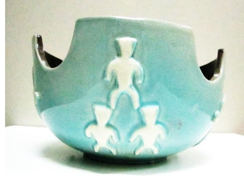
Şekil 8. Çalışma 3

Çalışmanın dökümü kalıp tekniğiyle alınmıştır. Alçı ile kalıbı alınarak, barbutin tekniğiyle yapıştırılan yüzündeki çiçek motifi, taht kompozisyonlu sırsız küpten alınmıştır (Şekil 7). Diğer yüzünde üç figür de aynı teknikle biri üste, ikisi alta gelecek şekilde yerleştirilmiştir (Şekil 8). Kasenin üst kısımları, sırsız küpün biçimiyle benzerlik göstermesi için yarım ay şeklinde kesilerek çıkarılmıştır. Çalışmanın içi derinlik kazandırmak amacıyla siyah, dışı ise Selçuklu döneminde kullanımıyla ilişkilendirilerek turkuaz sır ile sırlanmıştır. Kabartmalarda turkuaz sır silinerek beyaz kalması sağlanmış ve motifler ön plana çıkarılmıştır.