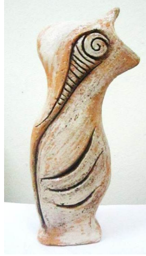
Şekil 15. Çalışma 8 (Arka Yüzü)