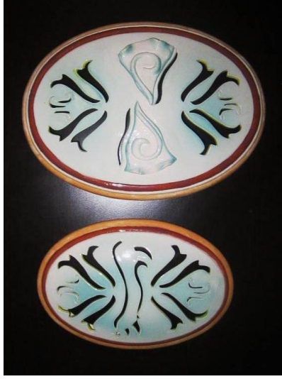
Şekil 9. Çalışma 4 (21x30, 17x24 cm)