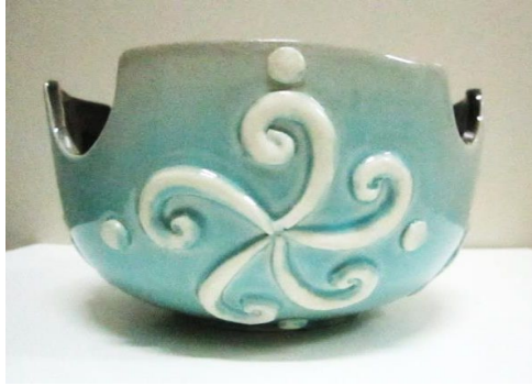
Şekil 7. Çalışma 3 (18x9 cm)

Pişirim: İlk pişirim 950°C, sırlı pişirim 1020°C.