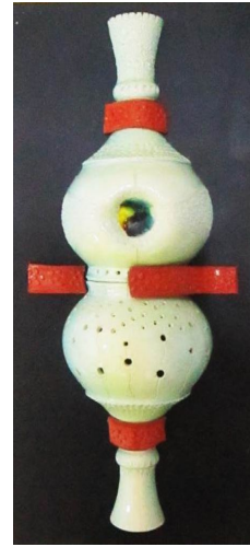
Şekil 16. Çalışma 9 (38x 18, 5 cm)