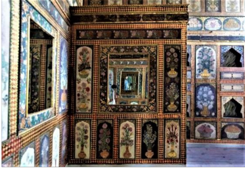
Şekil 6: Yemiş Odası süsleme detayı.