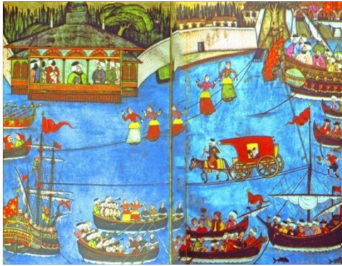
Şekil 1: III. Ahmed'in şehzadelerinin sünnet düğünü tasvir eden minyatürlerde Aynalıkavak Kasrı

Lale Devrinin eğlence yönü giderek ön plana çıkar ve Nedimin, "Gülelim eğlenelim kâim alalım dünyadan / Gidelim serv-i revanım yürü Sadabada" mısraları dönemi özetleyen bir formül olur. Şenlik ve eğlencelere saray öncülük eder, Seyyid Vehbi'nin Surname-i Vehbi adlı eserinde III. Ahmed'in şehzadelerinin sünnet düğünü için Haliçte kırk gün süren şenlikler Levni'nin minyatürlerinde anlatılır (Şekil 1). Yine dönemin ünlü ressamı Vanmour'un resimleri (Şekil 2) Lale Devrinin eğlenceleri ve gündelik yaşamı hakkında bilgiler vermektedir. Toplumsal hayatta bu gelişmeler yaşanırken mimaride bu değişim hareketinin uzağında kalmaz. Şehircilik ve imar çalışmalarının hızlandığı Payitahtta devletin üst düzey yöneticileri ve varlıklı aileleri, Boğaziçi ve Kâğıthane'nin Sadabad bölgesine yerleşirler.