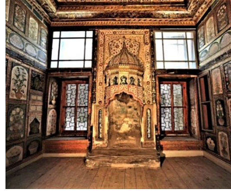
Şekil 9: Yemiş Odası ocak detayı.