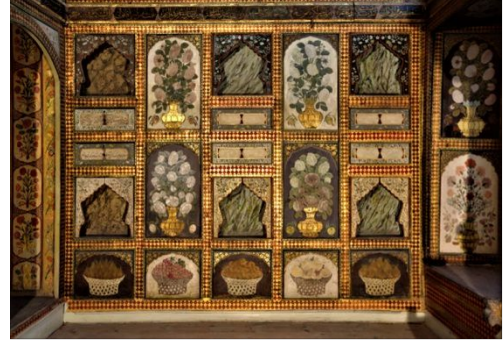
Şekil 7: Yemiş Odası duvar detayı.