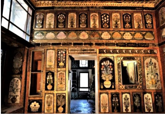
Şekil 8: Odanın duvar süslemeleri.