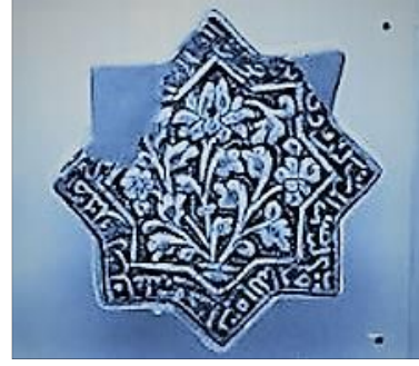
Şekil 5: 13.yy Anadolu Selçuklu dönemi seramikleri.

Lale Türk sanatında kutsallaştırılan bir çiçektir. Nitekim tek soğandan bir çiçek veren lale Osmanlı sanatında Allahın birliğine atfedilerek, camilerin, türbelerin ve sivil yapıların iç mekânlarında yaygın bir süs ögesi olarak kullanılır. Geleneksel Türk tezyini sanatlarında kullanılan hatayi (stilize edilmiş çiçek ve bitki anlatımı) motifler XVI. yüzyılda saray nakkaşısı olan Kara Memi ile çiçek ve bitki motifleri izlenimci bir üslupla yorumlanarak yarı stilize edilmiş biçimde resmedilir. Ancak XVIII. yüzyılda batılılaşma etkisi ile Osmanlı sanatına giren barok ve rokoko üsluplarının da etkisiyle klasik Türk tezyini sanatlarında kullanılan natüralist teknikteki çiçek bezemeleri harmanlanarak şükûfe (süslemeye sadece çiçek motiflerine dayanan bir üslup) adı verilen yeni bir üslup ortaya çıkar. Barok bir vazo içerisinde, kurdele ile bağlanmış, tek çiçek veya saksı içerisindeki çiçekler doğadaki görünüşleri gibi natüralist bir şekilde resmedilir.