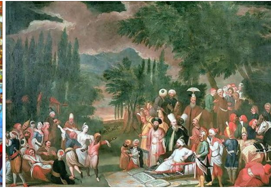
Şekil 2: Vanmourun III. Ahmed'in av partisi adlı tablosu.