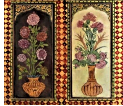
Şekil 11: Odadan süsleme detayı.

Odada bu anlatımlar, dünya nimetleri, bolluk, bereket ve cennet çağrışımını düşündürmekle birlikte yoğun bir şekilde kullanılan bu betimlemeler altın bordürler ile odanın duvar ve tavanlarını sınırlandırır. Duvarlarda Türk rokoku olarak tasvir edilen Edirnekari tekniğinde işlenmiş süslemeler, nişler, aynalar ile duvar ve tavanın birleşiminde oluşan yazı kuşağı ve kuşağın altında da altın mukarnaslar yer alır, tavanının ortasında ayna olduğu bilinmekle birlikte günümüzde tavan cam ile kaplıdır (Şekil. 10). Odanın içerisinde bulunan ocak aynı teknikle resmedilmiş bitki motifleri ile kaplıdır ve iç kısmında da manzara resmi yer alır. Oda oldukça renkli, süslü bir iç mekâna sahip olması sebebiyle de döneminin küçük bir dekoru niteliğindedir.