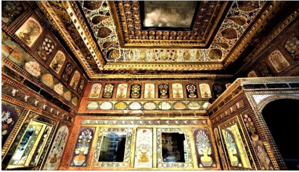
Şekil 10: Odanın tavan görünümü.