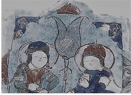
Şekil 4: Selçuklu dönemi seramikleri.

içerisinde sergilenen Selçuklu dönemi Kubadabad Sarayı kalıntılarındaki seramiklerde (Şekil. 4) yine İstanbul Arkeoloji Müzesi kompleksi içerisinde sergilenen 13. yüzyıl Anadolu Selçuklu dönemi seramiklerinde de (Şekil. 5) çiçek desenleri yer almakta. Bu sebeple de Türk sanatında çiçeğin iç mekânda kullanılan bir süs ögesi olduğunu da belgelemektedir. Osmanlı iç mekân süslemelerinde de oldukça geniş yer bulan çiçek anlatımı Lale Devri ile yeni bir üslup oluşturur ve bu dönem süslemelerinde kullanılan çiçeklerin stilize edilmeden doğada bulunduğu haliyle yani natüralist bir teknikte anlatımı görülür.