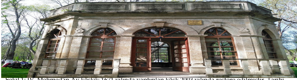
Şekil 1: IV. Mehmed 'in Av köşkü; 1671 yılında yaptırılan köşk 2003 yılında restore edilmiştir. Tarihi Kırkpınar güreşlerinin yapıldığı Sarayıçi Meydanı'nın 200 m kuzeyinde, Merkez/ Edirne