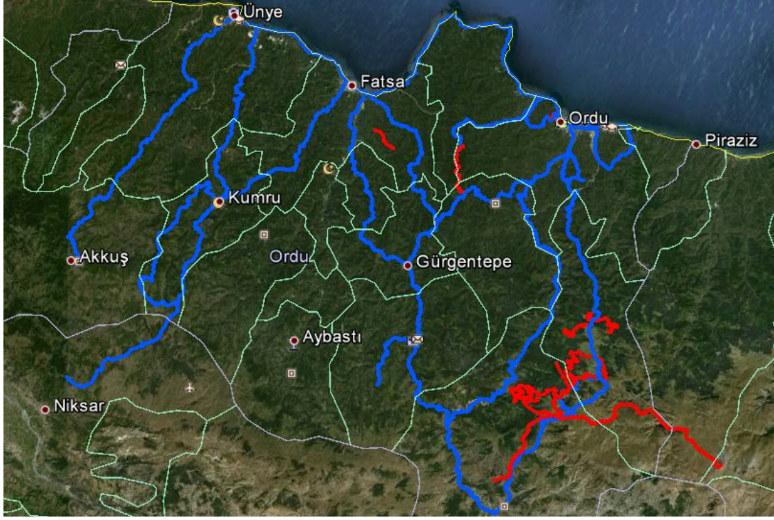
Şekil.2. Ordu ili yürüyüş ve bisiklet rotaları