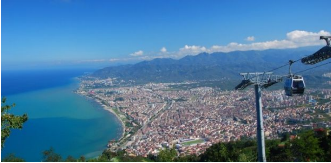
Foto 9. Boztepe

Boztepe: Boztepe'ye Selimiye Mahallesinden 6 km'lik yol güzergahından ve Oğmaca-Yaraşlı çevre yolu bağlantısıyla ulaşabilmektedir. Sahilde Atatürk parkından binilen teleferik ile muhteşem manzarayı seyrederek ulaşmak da mümkündür. 530 m. rakımlı Boztepe'den, yamacına serilmiş Ordu şehrini ve Karadeniz'in tüm renklerini seyretmek doyumsuzdur (Foto. 9).