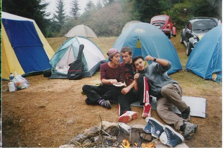
Foto 27- 28. Turnalık Çambaşı kamp alanlarından