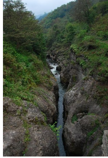
Fato. 26 Küpkaya Kanyanu

Kamp Karavan Turizmi: Ünye ve Perşembe Kıyıları, Yason Burnu, Turnalık, Çambaşı, Tekmezler, Sayacabaşı, Boztepe, Keyfalan, Mesudiye, Çukuralan, Kızılağaç, Cüle ve Savahçimeni yaylalarında kamp karavan turizme alt yapısı hazırlanmış bölgeler bulunmaktadır. Ordu turizminde bir marka olmuş Vosvos Şenliği kampçıları Turnalık ve Çambaşı Yaylalarında kamplamışlardır (Foto 27,28).