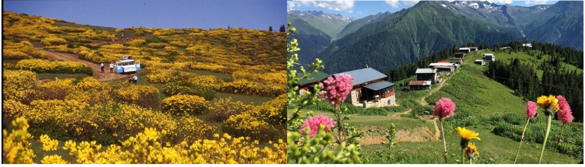
Foto: 3.-4. Çambaşı Yaylası

Düzoba Yaylası: Yayla bakımından zengin Kumru ilçesinin Düzoba Yaylasına ulaşım rahatlıkla sağlanmaktadır. Düzoba, Bakacak ve Ericcek yaylalarının merkezi haline gelmiş olup Mayıs- Ekim döneminde Pazar günleri yayla pazarı kurulmaktadır.