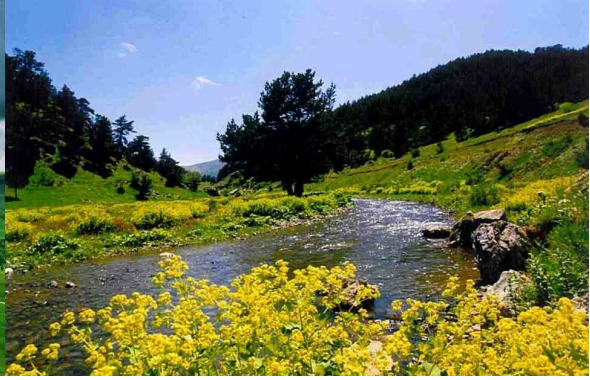
Foto 8. Topçam Yaylası