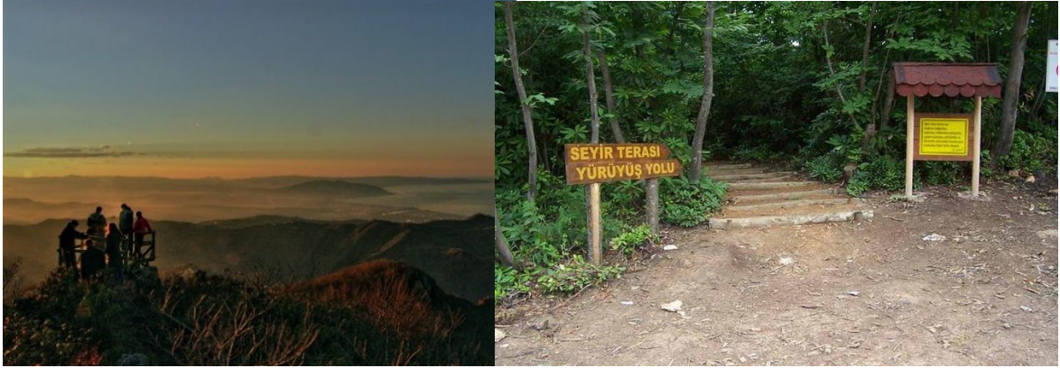
Foto 17-18 Yoroz Kent Ormanı

Yoroz Kent Ormanı; Saraycık mahallesinde bulunan Yoroz Kent Ormanı, kente 20 km mesafededir. Rahat ulaşımı, zengin flora ve fauna özelliği bulunan mevki doğal bir seyir terası özelliğindedir. Kent ormanı gezi ve piknik için gereken tüm düzenlemelere sahiptir (Foto 17,18) (www.ordu.bel.tr).