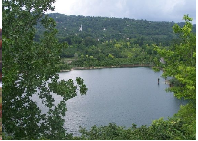
Foto 14. Gaga Gölü