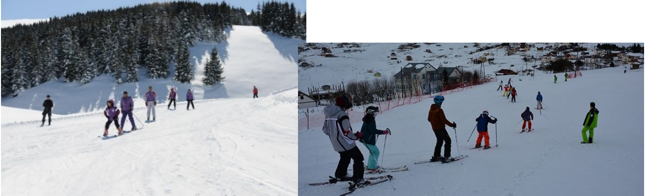
Foto 19-20. Çambaşı Kayak Merkezi

Çambaşı kayak merkezi; Kabadüz ilçesi Çambaşı Yaylasında 650 dönüm alan üzerinde kurulan kayak merkezi, “Türkiye'nin denize en yakın kayak pisti” unvanına sahiptir. Kayak merkezi babylift, telesiyej, kayak evi ve okulu, otel, helikopter pisti, idari ve sosyal tesisler ile 2500 kişiye hizmet verebilecek kapasitedir (Foto 19-20).