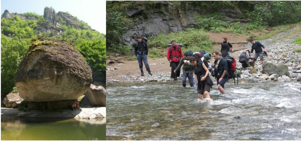
Foto 23- 24 Turnasuyu Vadisi

Dağ ve Doğa Yürüyüşü ve Bisikleti: Araştırma sahasında doğal güzellikleriyle öne çıkan bölgelere öncelik verilerek birbiriyle bağlantılı yürüyüş ve dağ bisikleti rotaları belirlenmiştir. Çambaşı, Topçam ve Yeşilce bölgesinde henüz doğal bozulmamış oba ve yaylaların peyzaj güzellikleri tarihi motifler ile birleştirilerek en iyi yürüyüş rotaları oluşturulmuştur. Nisan-Ekim dönemi Ordu yürüyüş parkurlarını adımlamak için en uygun zamandır. 24 adet yürüyüş ve uzun yürüyüş parkuru ve güzergahları Tablo 1'de verilmiştir. Ordu kent merkezinin 6-7 km. doğusunda denize dökülen Turnasuyu vadisi yürüyüş parkuru Türkiye'nin en ideal yürüyüş parkurlarından biri olarak Atlas Dergisi Yürüyüş Rotaları rehberinde yer almıştır (Foto 23, 24) (Tablo 2).