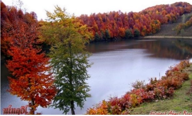
Foto 13. Ulugöl