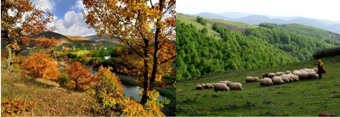
Foto. 5.- 6. Argan Yaylası

Keyfalan Yaylası: Deniz seviyesinden 1.200 m. yükseklikteki yayla, Ordu'ya 134 km. Mesudiye'ye 20 km. uzaklıktadır. Ulaşım asfalt yolla kolaylıkla sağlanmaktadır. Çam ormanları ile kaplı Kara Tepenin eteklerinde çimenler ile kaplı yaylanın üç obası bulunmaktadır. Yöre yaylaları arasında mimari olarak geleneksel yayla evi ve oba yerleşim örneğini gösteren nadir yaylalardandır. 1995'te Turizm Merkezi ilan edilmiş yaylanın büyük bir bölümü Milli Parklar Genel Müdürlüğü tarafından av koruma ve üretme sahası olarak koruma altına alınmıştır.