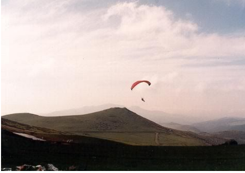
Foto 21. Perşembe Yaylasından

Yaylasına iniş”, “Perşembe Yaylasında Karga Tepesinden Yaylaya iniş” şeklinde düzenlenen atlayış parkurları bulunmaktadır (Foto21,22).