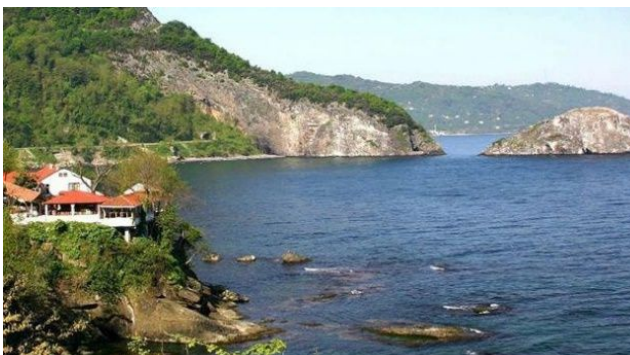
Foto 11. Hoynat Adası

Hoynat Adası: Perşembe ilçesinin en önemli unsurlarından olan adanın eskiden gemiciler tarafından sığınak ve depo olarak kullanıldığı tahmin edilmektedir. Ada martı ve karabatak kuşlarının doğal yaşam alanı olup "Tepeli Karabatakların Türkiye'de tek yuva yaptığı yerdir" (Foto 11).