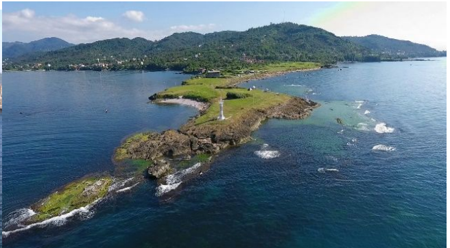
Foto 12. Yason Burnu

Yason Burnu: Perşembe ilçe merkezine 15 km. mesafedeki yarımada, 1. derece arkeolojik, 2. derece doğal SİT alanıdır. Karadeniz sahili boyunca üzerinde kilise bulunan tek yarımadaının güzelliği görülmeye