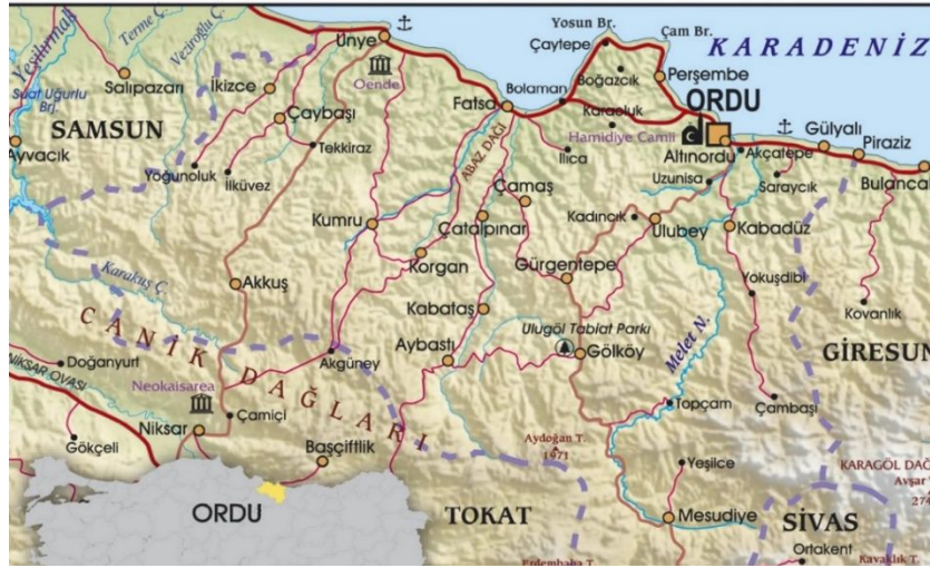
Şekil 1: Ordu ilinin lokasyon haritası

Coğrafi olarak büyük oranda Orta Karadeniz, planlamada Doğu Karadeniz Bölümüne dâhil edilen (Özçağlar, 2006) Ordu ili güneyde Tokat ve Sivas, doğuda Giresun, batıda ise Samsun ile komşudur. 5952 km 2 yüzölçüme sahip ilin doğal sınırlarını; doğuda Turnasuyu, güneyde Kelkit Çayı, batıda Terme Ovası ve kuzeyde ise 107 km. kıyı uzunluğu ile Karadeniz çizer (Şekil 1). Hititler, Persler, Pontuslar, Romalılar, Bizanslılar, Selçuklular ve Osmanlılar 17.000 yıldır yörede siyasi hâkimiyet kurmuş uygarlıklardan bazılarıdır (Anonim, 2016). İlin ekonomisi fındığa dayalıdır. Bal ve kivi üretiminde ülkemizde ilk sıralarda yer alırken kıyı balıkçılığı da yörede gelişmiştir. Fındığa, orman ürünleri ve toprağa dayalı sanayi dışında yörede sanayi gelişmemiştir. Turizm yörenin ekonomisinde çok önemli bir yeri bulunmakta olup kalkınma projelerinde öncelikli sektör olarak görülmektedir.