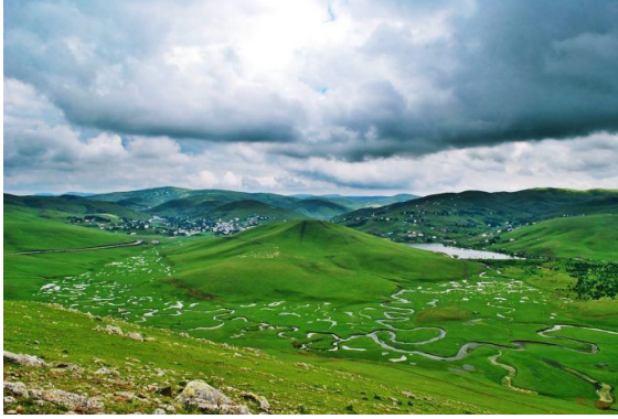
Foto 7. Perşembe Yaylası