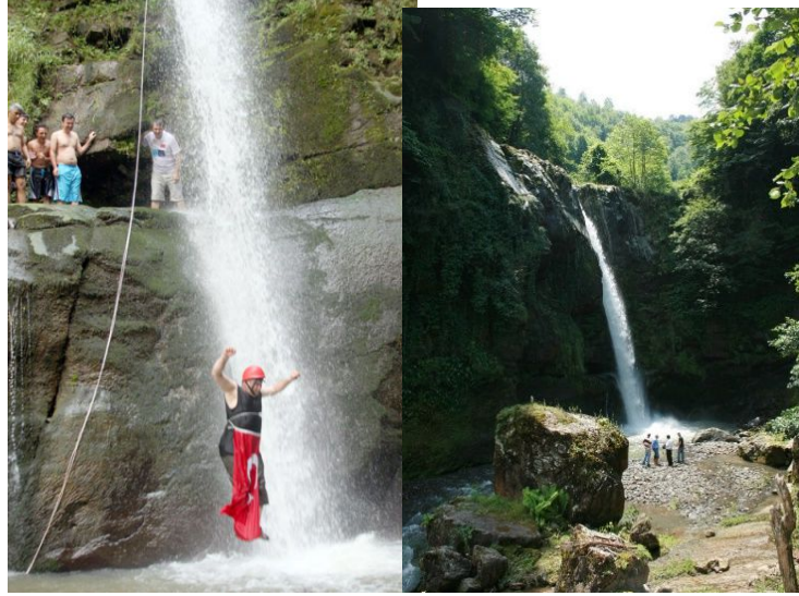
Foto 15.-16 Ohtamış Şelalesi

Ohtamış, Ulubey İlçesine 20 km. uzaklıkta bulunan yörenin en büyük şelalesi 30 m. yükseklikten 90° lik bir eğim ile dökülmektedir. Araştırma sahasındaki Değirmen, Kestane Yokuşu, Akköy, Kaşdere gibi birçok şelale dinlenme ve ziyaret için idealdir (Foto.15-16), ( www.ordu.bel.tr ).