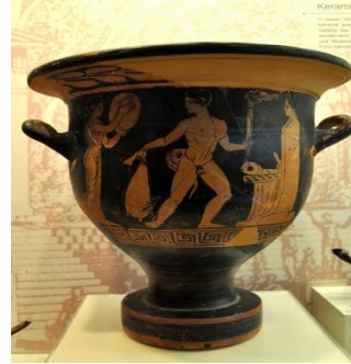
Resim 2: Olimpiyat Ateşini yakan bir sporcu ile kadın din görevlilerinin betimlendiği Yunan Vazosu.