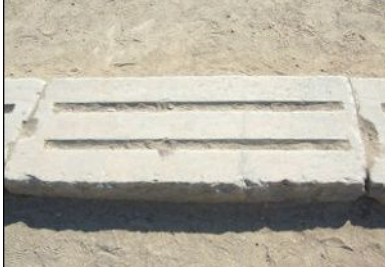
Şekil-3: Antik olimpiyatta başlangıç çizgisi