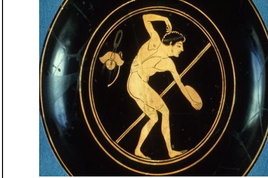
Resim 1: Milattan önce 510-500 yıllarına ait bir tabakta disk atan Yunan sporcusu( http://www.perseus.tufts ).

9. Kadınların spor etkinliklerine katılımı: Antik çağ yunan şenliklerinde kadınların sporcu olarak yarışmaları konusunda tartışmalı görüşler vardır. Bazı kaynaklara göre kadınlar kendi aralarında yarışmıştır. Eski Olympia'da Zeus'un karısı, Hera onuruna ayrı bir şenlik düzenlenirdi. Bu festival, evlenmemiş kızlar için koşu yarışları içerirdi. Yunan gezginlerinden biri olan Pausanias'ın aktardıklarına göre bu festival hakkında pek az şey biliniyor. Zeus Tapınağı'ndaki Hera Tapınağı'nın tasvirinde, yarışmaların şehirlerindeki 16 kadından oluşan bir komite tarafından düzenlendiği belirtilir (Kyele,2014). Bazı kaynaklara göre seyirci olarak yer almışlardır. Ama bir vazodaki resim bize en azından oyunlarda kadınların olduğunun bir göstergesidir (Resim- 2). Antik yunanda atletizm yarışlarının bugünkü gibi bir çizgiden başladığını (Resim-3), antik yunan ile ilgili kaynaklarda pek yer almayan futbolun yapıldığını (Şekil 4) görmekteyiz.