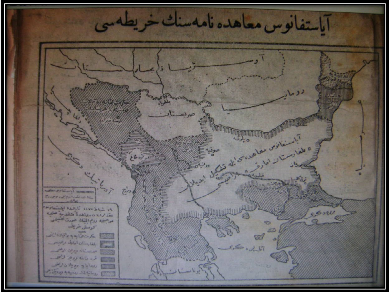
Resim1-1877-1878 Osmanlı Rus Harbi Sonrasında Çizilen Sınırlar

19. yy. sonunda gerçekleşen Osmanlı Rus harbi sonrasında Balkan hükümetleriyle yapılan mütareke 19 Şubat 1878 tarihli Ayastafanos anlaşması ile gerçekleşmişti. Harita değerlendirildiği zaman Rumeli'nin bazı kısımlara ayrıldığı ve bu suretle Balkan hükümetlerinden her birine ne kadar toprak verildiği de anlaşılır.