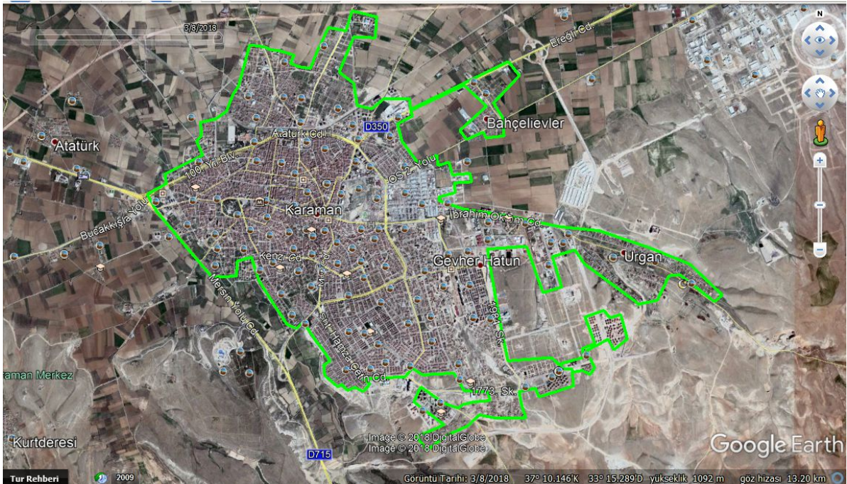
Uydu Fotoğrafı 10. Yapılaşması Tamamlanmış Alanlar (2018 Ağustos)