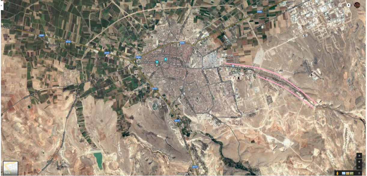
Uydu Fotoğrafi 4. Karaman-Urganboğazı Güzergahı

Karaman-Mersin yolunun ilk 10km'lik kısmında yolun her iki yönünde ticari alan olarak değişikliğe gidilmiştir. Ancak bu güzergahta tarım dışına çıkarılan alanlarda nitelikli tarım arazisi miktarı oransal olarak düşüktür.