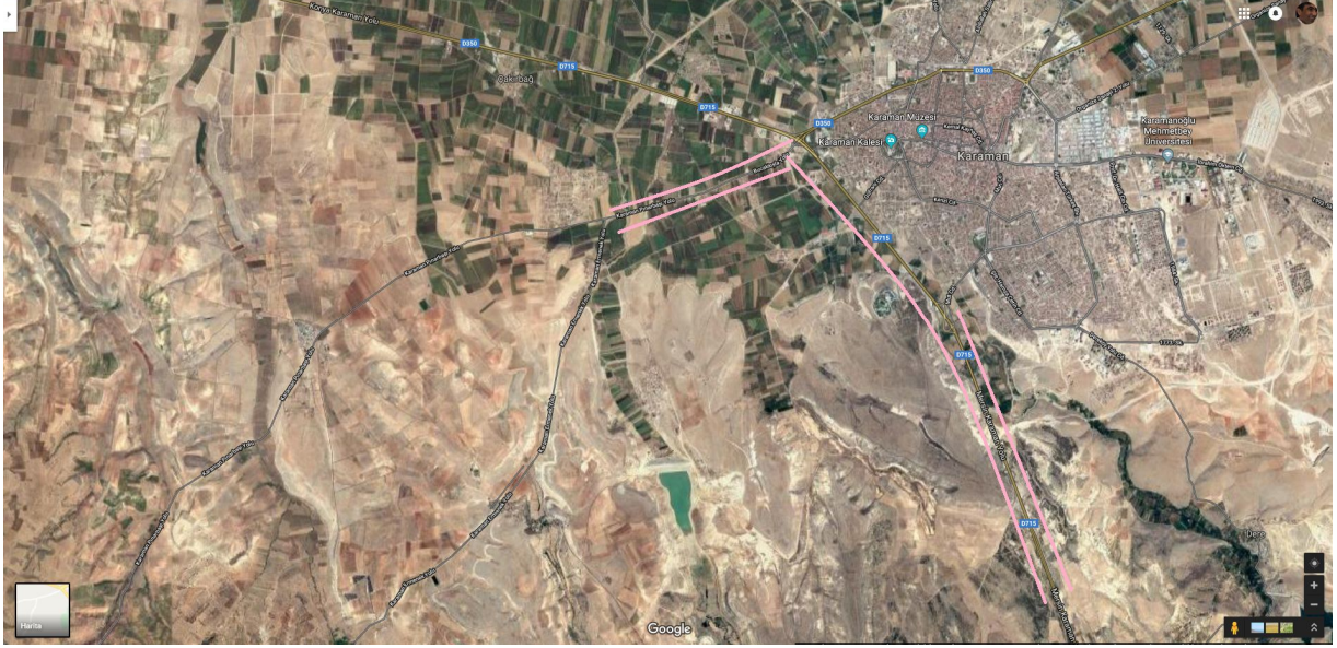
Uydu Fotoğrafi 3. Karaman-Bucakkışla ve Karaman-Mersin Yolu Güzergahları

Karaman merkez ile Bucakkışla köyü arasındaki yol güzergahının Karaman Otogarının olduğu noktadan 5km mesafedeki alan birinci derece tarım arazisi özelliğindedir. Kent planlarındaki değişiklik sonrası bu yol güzergahının her iki tarafında da 200m derinlikte ticari ve konut alan şeklinde bir değişikliğe gidilmiştir.