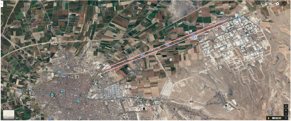
Uydu Fotoğrafları 1. Karaman-Adana Yol Güzergâhı (Organize Sanayi Bölgesi Güzergâhı)

Karaman kent merkezi ile Karaman Organize Sanayi Bölgesi arasındaki birinci derece tarım arazilerinin bulunduğu alanda yol güzergâhının her iki tarafında 200 metre derinliğinde ticari alan oluşturulmuştur.