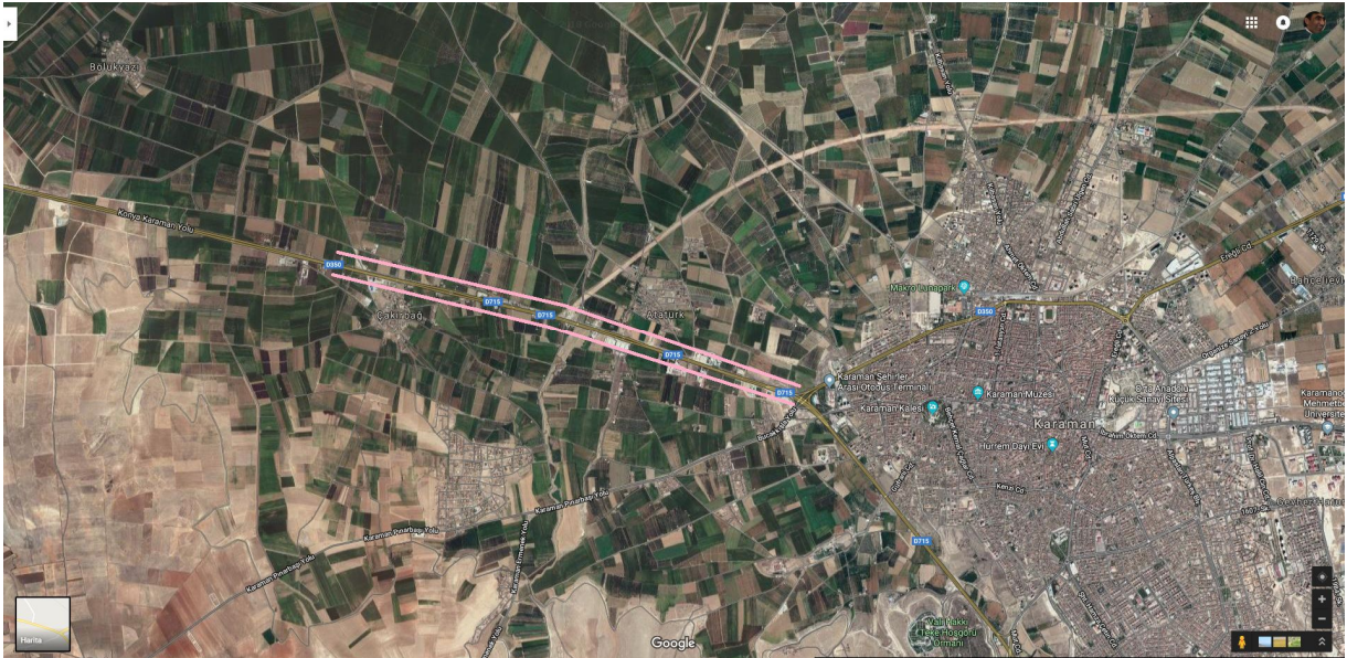
Uydu Fotoğrafları 2. Karaman-Konya Yolu Güzergâhı

Karaman kent merkezi ile Karaman Organize Sanayi Bölgesi arasındaki birinci derece tarım arazilerinin bulunduğu alanda yol güzergâhının her iki tarafında 200 metre derinliğinde ticari alan oluşturulmuştur.