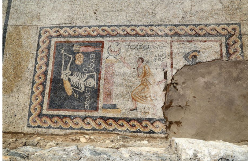
Resim-1 (Pamir & Sezgin, 2016)