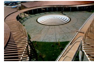
Şekil-1: Olbia Kültür Merkezi, Sol ve orta resim: Hava fotoğrafı(URL-1), sağ resim: Meydan ve havuz düzenlemesi(URL-2)

Olbia, 2001 yılında, Ağa Han Ödülleri'nin sekizinci döneminde, 'Eski Yapılar İçin Yeni Yaşamlar' başlığı altında arketipleri yeniden yorumlayan bir simge olarak ödüllendirilmiştir. 1980'li yıllarda Türkiye'de yaygın bir dil olarak kullanılan bu yorumlama, Olbia Kültür Merkezi'nde de duyarlı bir ölçek anlayışı, yapı bütünlüğüyle birlikte ele alınan detay anlayışıyla öğrencilerin ve yerleşke içerisinde bulunan diğer kullanıcıların kendilerini yere ait hissederek kullandıkları önemli bir iletişim noktası olmuştur (Erkarlan, 2001).