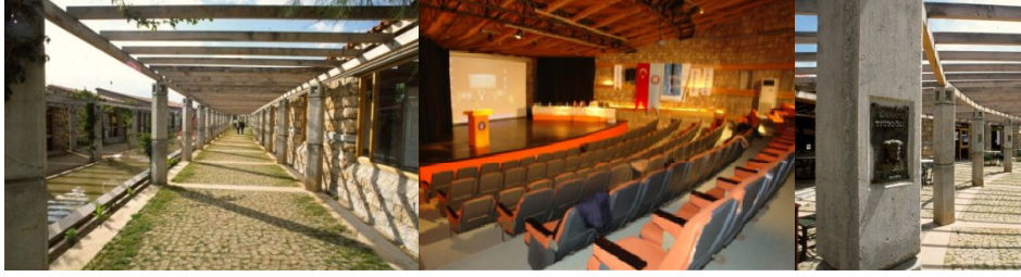
Şekil-4: Taş duvar örme tekniği(URL-5) Şekil-5: Çatı Sistemi(URL-6) Şekil-6: Kolonlar(URL-7)

yerleşkeye giren kullanıcıların yürüyerek ulaşabileceği mesafede bulunması, bütün fakültelerle ilişki kurması ve kullanıcıların kendilerini bu alana ait hissetmesi önemsenmiştir. Yapım tekniği oluşturulurken, Antalya'nın geleneksel duvar örgü tekniği kullanılmış ve hem bu tekniğin hem de yerel malzemenin sürdürülebilirliği korunmuştur (Şekil-4). Tavan sisteminin yapısına bakıldığında geleneksel makas sisteminin yeniden yorumlanarak çağdaş bir bakış açısıyla oluşturulduğu görülmektedir. Bu makas sisteminde kullanılan ağaçlar Antalya'nın yerel kimliğini oluşturan sedir ağaçlarıdır. Böylece duvardan tavana kadar her ayrıntıda yerel malzeme kullanılmış, geleneksel yapım teknikleri modern bir bakış açısıyla yorumlanmıştır (Şekil-5). Ortasından geçen su yolu saat kulesinin bulunduğu birinci meydanda genişleyerek bir havuz oluşturmaktadır. Havuzun ortasında dikili olan çınar ağacı Olbia'nın yaşını simgelemektedir. Kolonların üzerine yapılan oyuntuların içinde Cengiz Bektaş'ın saptamış olduğu çeşitli sanatçıların kabartma resimleri bulunmaktadır. 75 kişi tasarlanmış ancak 25 tanesi yaptırılabilmiştir (Şekil-6).