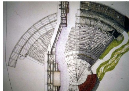
Şekil-3: Olbia Kültür Merkezi Konferans Salonu(URL-4)

Bu yapının tasarımında göz önünde bulundurulmuş kriter, üniversitenin kimlik ve aidiyet sorunu olmuştur. Bu kimlik sorununu çözmek için kullanıcıların alışık olduğu oylum düzlemi üzerinden Bektaş'ın deyimiyle bir yol güzergahı yaratılmıştır. Güzergah oluşturulurken doğaya ve coğrafi verilere uygun olması,