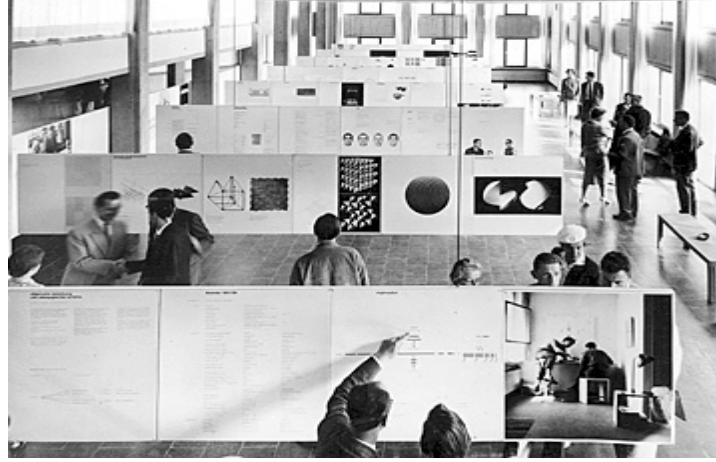
Şekil 6: Bauhaus tasarım okulu

Buraya kadar gelinen noktada, mimarın eğitiminin tarihsel sürecinde, sistem bağlamında görülen tüm değişim ve dönüşümlere rağmen, akademik eğitimin ortak nokta olarak sanat öğretisi ve sanatçı kimliğinin olumlanması üzerine temellendiğini söyleyebiliriz. Bu konuda Erzen (1976), özellikle mimarlık eğitiminin sanata olan yakın duruşundan söz etmektedir ve sanat ve mimarlık eğitimi arasındaki benzerliğin, estetik olgu ve yaşantıyı birbirine yaklaştırmasından kaynaklandığını belirtmektedir. Bu tür bir eğitimin yer aldığı atölyelerdeki süreç birçok bakımdan sanat eğitimi sürecine benzemekte ve belirgin bir biçimde estetik bir yaşantı ortamı gerektirmektedir. Öğrenciden beklenen çözümlenme ve yaratıcılık, onu ister istemez estetik bir sürece sokmaktadır ve tasarım problemiyle karşılaşan öğrencinin içinde bulunduğu yaşantı süreci bir sanatçınınkinden çok farklı değildir.