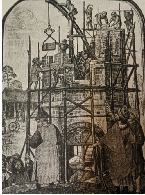
Şekil 1: Mimar ve işçiler, döneme ait bir illüstrasyon (Cuff, 1991, 14)

Davis (2006, 39), geleneksel toplumda mimarın sadece çizen kişi değil aynı zamanda inşa alanında çalışan başka deyişle işlev tasarımı-uygulamayı bir araya getiren, işçileri gözetken kişi olduğunu ve bu yönleriyle onların işinin ustaların rollerinin bir uzantısı olarak kabul edildiğini belirtmektedir (Şekil 1).