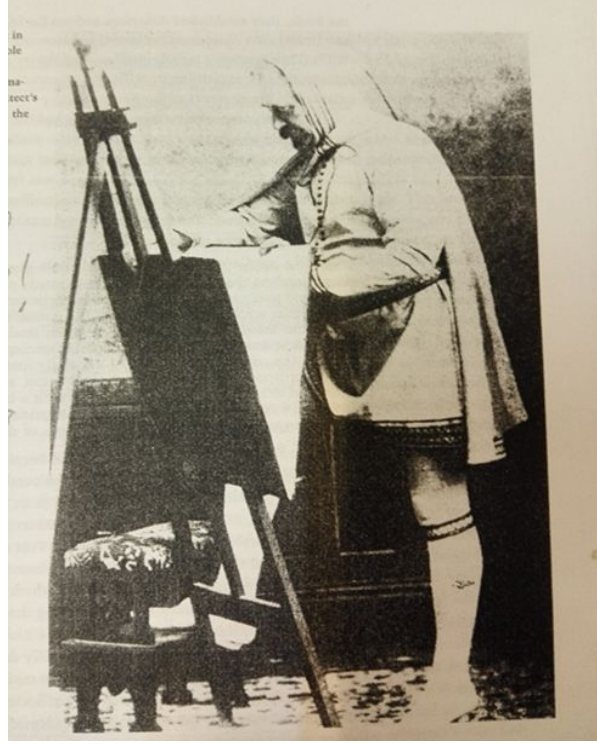
Şekil 5: Richard Morris Hunt, 1883 (Cuff, 1991).

birlikteliği sağlanmıştır (Erbil, 2009, 61). Şekil 5’de, Ecole des Beaux Arts mezunu Hunt’ın ressam gibi giyinmiş olması, mimarın güçlü sanatçı kimliğinin göstergesidir.