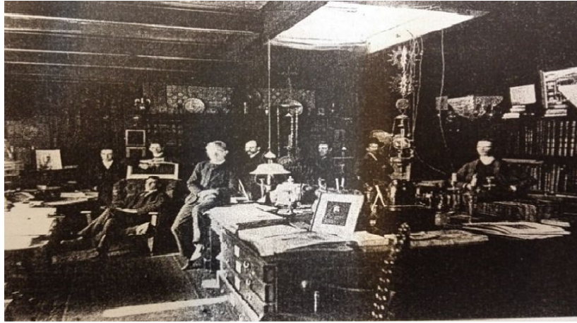
Şekil 4: Henry Richardson’ın ofisi ve çalışanları (Cuff, 1991)

Fransız Kraliyet Mimarlık Akademisi’nin kurulmasıyla birlikte mimarın eğitimindeki ilk köklü değişiklik gerçekleşmiştir. Bu sistemde, mevcut eğitim sistemi kuramsal temellere dayandırılmaktadır. Okul ortamında; öğrenciler zorunlu dersler ve konferanslarla kuramsal eğitim almakta, okul dışında ise akademisyenin ya da başka bir deyişle ustanın bürosunda tasarım çalışmaları yapmaktadırlar (Şekil 4).