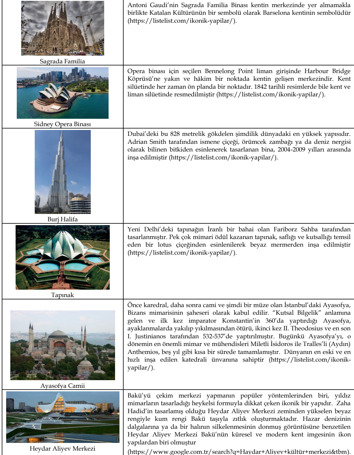
Tablo 1: Dünyada ve Türkiye'de Kent İkonlarına Ait Örnekler

Dünya kentlerini simgeleyen ve kentlerin bu yapılarla anılmasını sağlayan örnekler aşağıdaki tabloda değerlendirilmiştir.