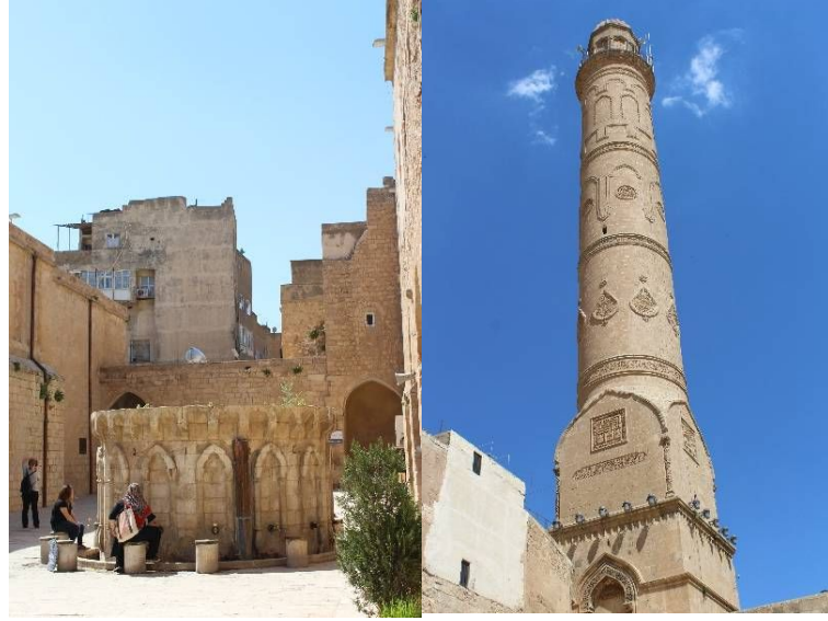
Şekil 9: Mardin Ulu Camii

Bazı Süryani yazarlar kiliseden çevrildiğini söylerler. Yapı 12. yüzyıl Artuklu Dönemi mimarisinin temel özelliklerini yansıtmaktadır. Yapının malzemesi düzgün kesme taştır. Ulu Camii'nin kubbesi dıştan yivleme tekniğiyle yapılmıştır ( https://www.kulturportali.gov.tr/turkiye/mardin/gezilecekyer ).