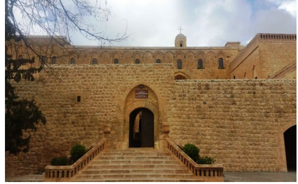
Şekil 6: Deyrulzafaran Manastırı

Manastır, Romalılar bölgeden çekilince Aziz Şeymun bazı azizlerin kemiklerini buraya getirerek kaleyi manastıra çevirmiştir. Bu nedenle Manastır, önceleri Mor Şeymun Manastırı olarak biliniyordu. Mardin ve Kefertüth Metropolitleri Aziz Hananyo'nun 793 yılından başlayarak büyük bir tadilat yapmasından sonra manastır onun adıyla bilindi. 15. yüzyıldan sonra da manastırın etrafında yetişen zafaran (safran) bitkisinden dolayı manastır, Deyrul-zafaran (Safran Manastırı) adı ile anılmaya başlandı.