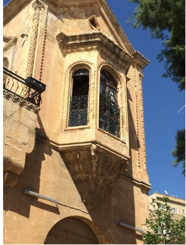
Şekil 5: Cumbalı Ev

Üç ayrı girişi olan yapının alt katı servis birimleri ahır ve müstemilat olarak yapılmıştır. Üst kat şu anda eyvan ve eyvana açılan cumbalı oda ile başoda olmak üzere iki odadan oluşmaktadır. Avluya bakan diğer odanın arka tarafında yapıldığı dönemde evin ortak hamamı olarak kullanılan ancak şu anda bütün geçişleri kapatılmış, kubbeli ve aydınlık fenerli bir mekân bulunmaktadır.