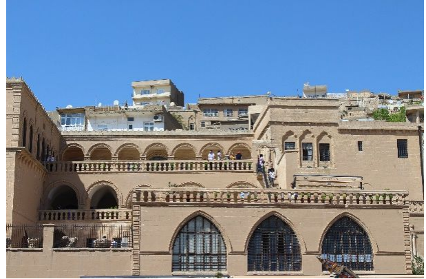
Şekil 7: Mardin Müzesi

Binayı Süryani Katolik Vakfı'ndan satın alan Kültür Bakanlığı restore ettirmiştir. 2000 yılında müze olarak kullanmaya başlanmıştır. Bina arazi eğiminin ve parsel derinliğinin fazla olması nedeniyle tasarımın teraslamalar biçiminde üç kat olarak gerçekleşmesine neden olmuştur.