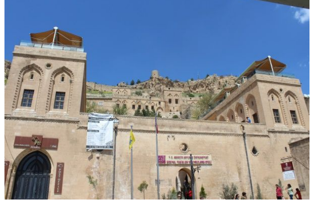
Şekil 4: Eski PTT Binası

Zengin ve görkemli taş işçiliğiyle dikkati çeker. Bina 1950 yılından itibaren PTT binası olarak kullanılmıştır.