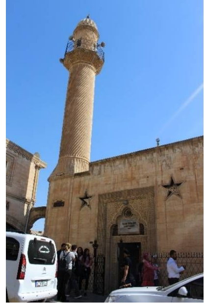
Şekil 8: Kasım Tuğmaner Camii

Minare helezon motiflerle bezenmiştir. Artuklu etkileri mevcuttur. Bu camii eski bir kilisenin temeli üzerine kurulmuştur.