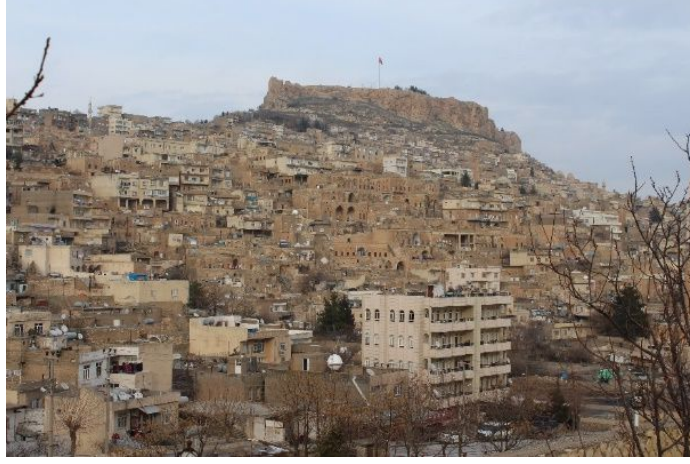
Şekil 1: Mardin'den Görünüm

Mardin kent dokusunda yer alan ve taş işçiliğinin topografyada oluşturduğu pek çok yapı kentin sembolü haline gelmiştir. Bunlar, Kasımiye Medresesi, Zinciriye Medresesi, Eski PTT Binası, Cumbalı Ev, Deyrulzafaran Manastırı, Mardin Müzesi, Kasım Tuğmaner Camii, Mardin Ulu Camii ve Şehidiye Camiidir (Şekil 1).