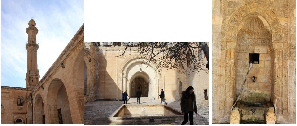
Şekil 10: Şehidiye Medresesi ve Camii

Minareli olarak yapıldığı halde minaresi yıkılmış ve 1914te minare Ermeni mimar Lole Gisoya yeniden yaptırılmıştır. İki şerefeli olan minare, iskelesiz olarak inşa edilmiştir.