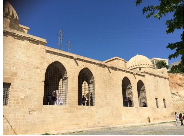
Şekil 2: Kasımiye Medresesi

Medrese iki katlı olup, tek bir avlu etrafında ve cami ve türbe ile birlikte külliye şeklinde yapılmıştır. Kapı çeşitli işlemlerle süslüdür; günümüze kadar bir kısmı tahrip olmuştur. Binanın batısında Şafiler'in kullandığı dikdörtgen biçiminde kubbeli mescit bulunmaktadır. Doğusunda Sünnilerin kullandığı mescit bulunmaktadır. Yapının kuzeyinde ise çeşme yer alır ( https://www.kulturportali.gov.tr/turkiye/mardin/gezilecekyer ).