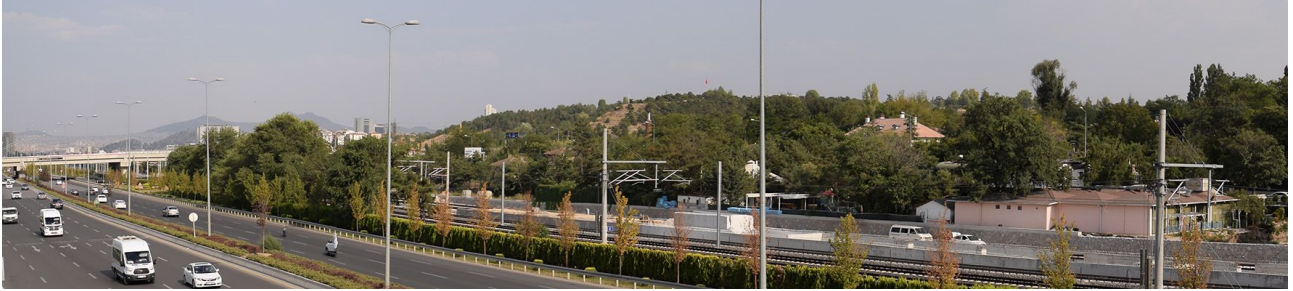
Foto 1:AOC merkez bölgesi içerisinde geçen hızlı araç yolu (Aycı, 2017).

AOC'nin kamusal alanlarının tarihsel süreçte Ankara kenti ile ilişkisinin zayıflamasındaki en önemli nedenlerinden biri Ankara'nın kamusal ulaşım planlamasında AOC ile ilişkilerin göz ardı edilmiş olmasıdır. Ankara için hazırlanan ve AOC'nin batıya doğru uzayan arazileri ile paralel olarak ilerleyen Çayyolu ve Batıkent metro hatlarında AOC tarihi çekirdek alanı ile ilişkilenen ulaşımın kurgulanmamış olması AOC merkezi alanının kentle olan ilişkisini ağırlıklı olarak özel araçla sağlanabilmesini beraberinde getirmiştir (Şekil 1). 2003 yılından sonra bir müddet kapatılan banliyö treninin AOC durağı 2016 yılında açılmış, Tren yolu durağının kapatıldığı süreçte AOC'nin kentle toplu taşıma ilişkisi kesilmiştir (Şekil 2). Aynı şekilde İstanbul ve Eskişehir yoluna paralel uzayan metro hatları da AOC'nin kamusal alanları ile kolay ilişkilene imkanı sunmaktadırlar.