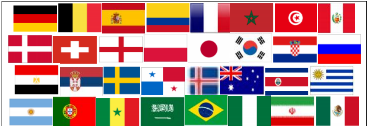
Tablo 1: 2018 Dünya şampiyonasına katılan takımların ulusal renkleri

2018 Dünya şampiyonasına katılan ve 3 maç yapan takımların ulusal formaların renk analizine bakıldığında formalarda bulan renkler 26 kırmızı, 19 beyaz, 14 mavi, 9 yeşil, 7 sarı ve 4 adet siyah renktir (Tablo 1).