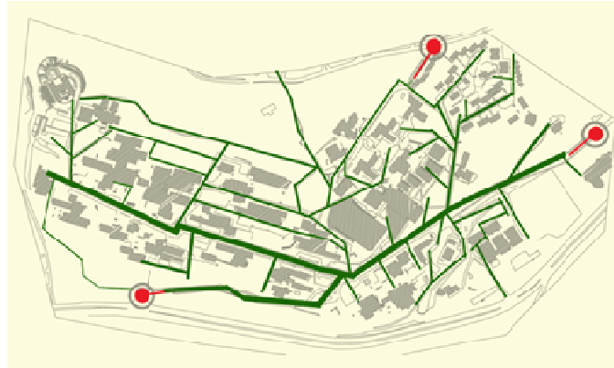
Şekil 1. Çalışma alanı-K.T.Ü. Kanuni Kampüsü Planı ve Sirkülasyonu (Düzenli, 2010).

Kişilerin Bu çalışma Karadeniz Teknik Üniversitesi Kanuni kampüsünde yapılmıştır (Şekil 1). 20 Mayıs 1955 yılında kurulmuş olan Karadeniz Teknik Üniversitesi, İstanbul ve Ankara illeri dışında kurulan ilk üniversitedir. Kuruluşundan yaklaşık sekiz yıl sonra, 19 Eylül 1963 tarihinde Rektörlük ve Fakülte kadroları verilerek Temel Bilimler, İnşaat-Mimarlık, Makina-Elektrik ve Orman Fakülteleri kurulmuştur. Günümüzde Karadeniz Teknik Üniversitesi 16 fakülte, bir konservatuvar, 4 yüksekokul, 10 meslek yüksekokulu, 3 enstitü ve 16 araştırma merkezi, 1828 kişilik güçlü akademik kadrosu, 81 il ve birçok farklı ülkeden yaklaşık 34 bin öğrencisiyle ülkemizin sayılı eğitim kurumlarından biridir.